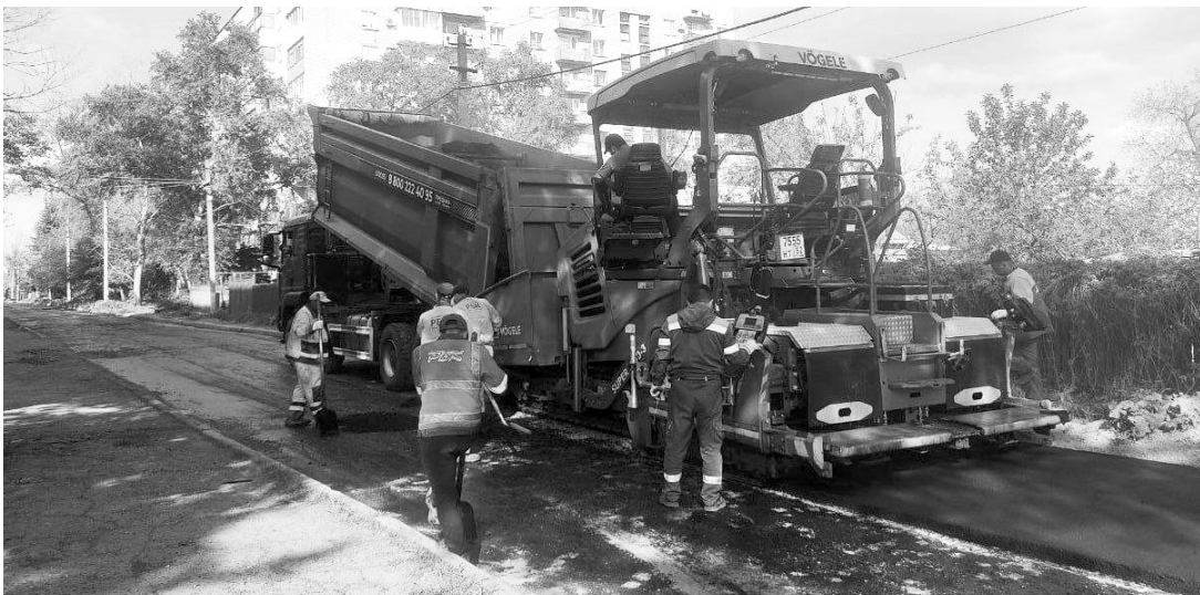
Дорожные работы в городах Респблики.

Освобождение территорий и восстановление Донбасса ещё пару лет назад, с началом СВО, казались очень амбициозными проектами. Если вопросов к нашей армии никогда не было, то с восстановлением было ощущение, что процесс затянется. По крайней мере, так казалось. Но темпы строительства и восстановления, с которыми Россия взялась за дело, приятно удивляют.