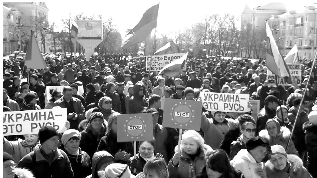
Митинг в Луганске.

А пока депутаты принимали эти бесплодные заявления, на улицах уже начиналась конкретная организационная деятельность. Ещё 20 января на собрании группы активистов Антимайдана было решено создать на базе «штаба самообороны» независимую организацию «Луганская гвардия». В Программе указывалось, что «Гвардия выступает ЗА возрождение нашей Родины, против западной и олигархической оккупации... против возрождения фашизма в нашей стране, против вмешательства агентов влияния во внутренние дела».