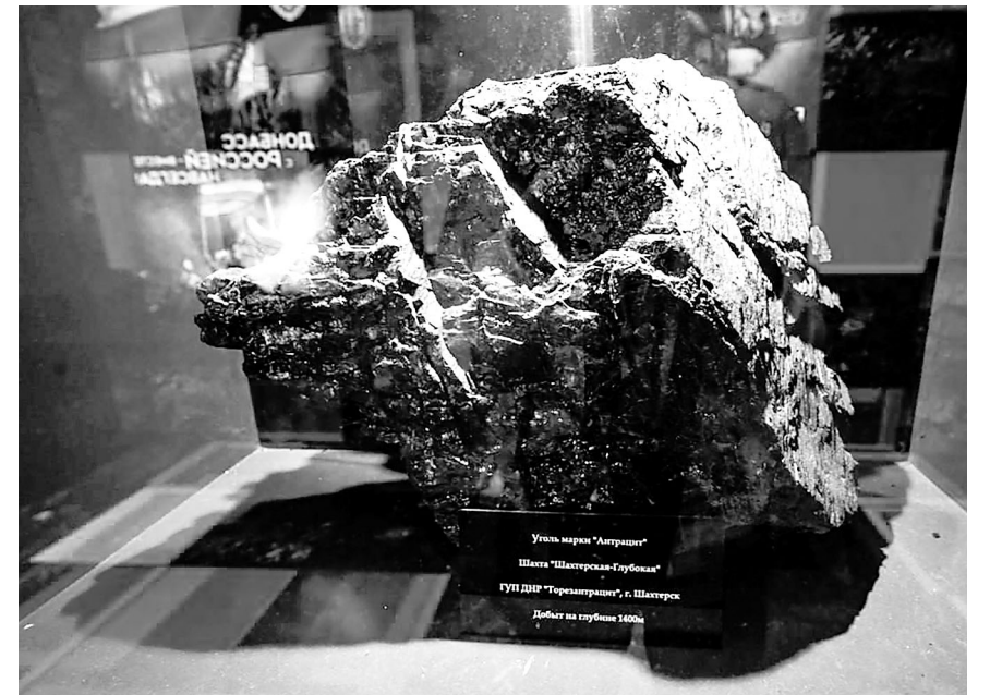
Образцы настоящего угля.