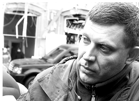
Первый Глава ДНР Александр Захарченко.

Государственный переворот, совершённый в Киеве в феврале 2014 года под руководством трёх оппозиционных партий в опоре на отряды фашиствующих боевиков ряда националистических организаций, катализировал движение Сопротивления в южных и восточных регионах.