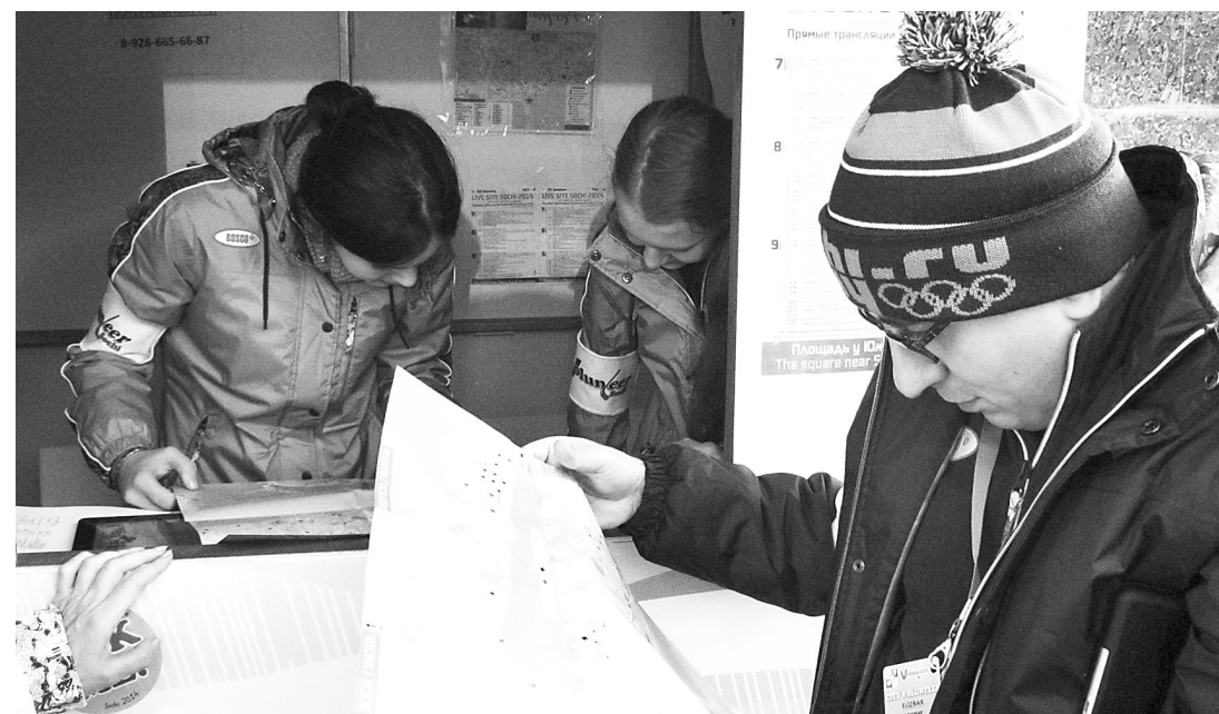
Эффективная работа волонтеров.