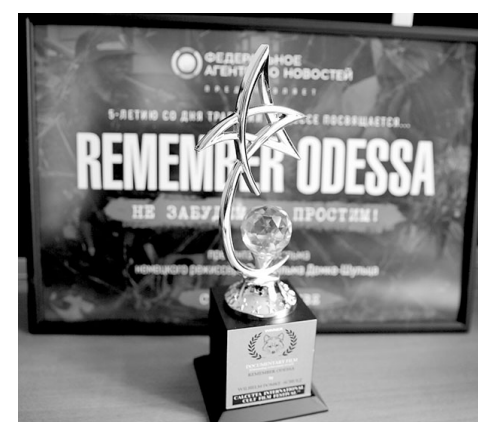
Награда за фильм «Remember Odessa. Не забудем, не простим».