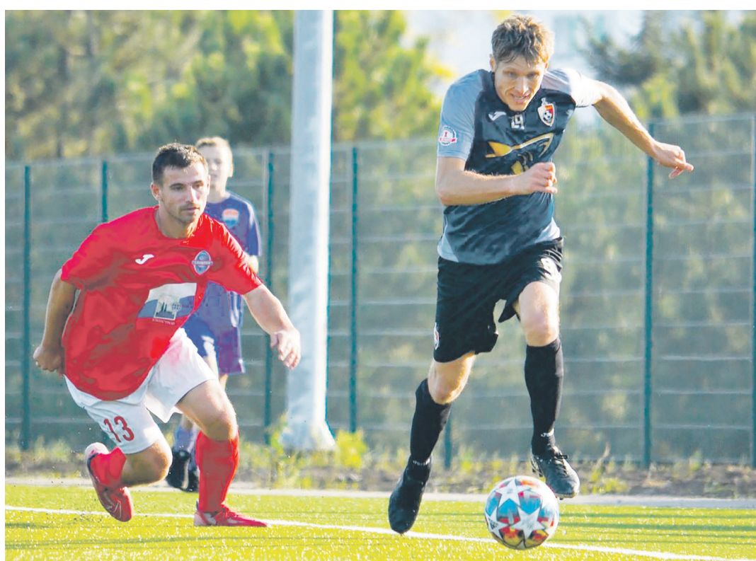
Кубок Содружества-2023. Эпизод матча «Олимпия» (Мариуполь) – «Гвардеец» (Донецк).

Матчи первого круга турнира начнутся 31 марта и завершатся 4 июня. По понятным причинам безопасности играть на наших