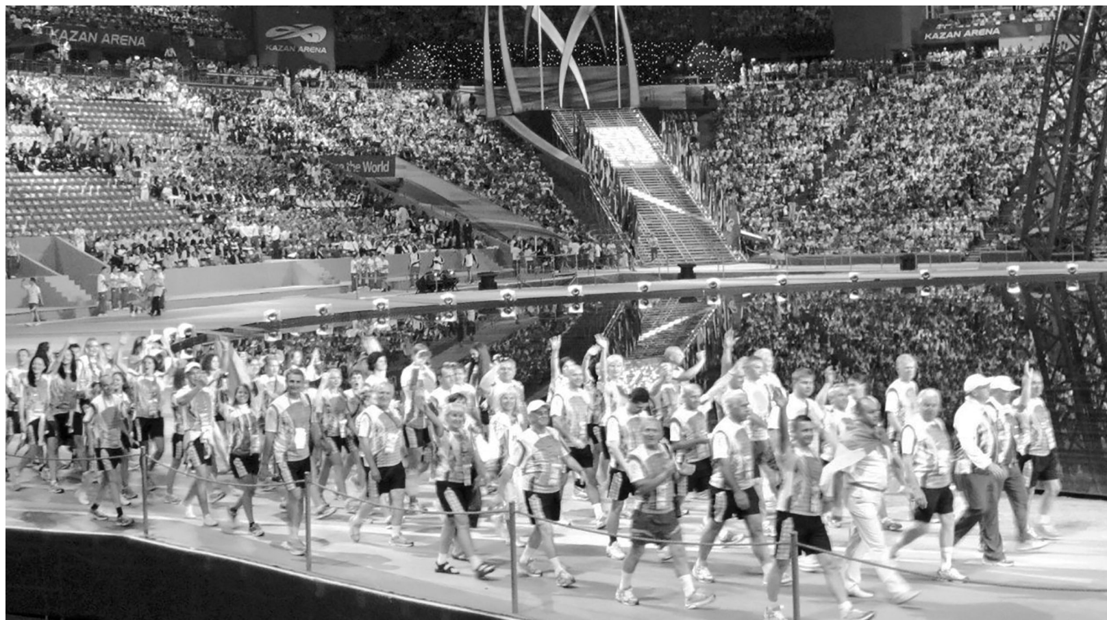
Церемония открытия Универсиады-2013 в Казани.