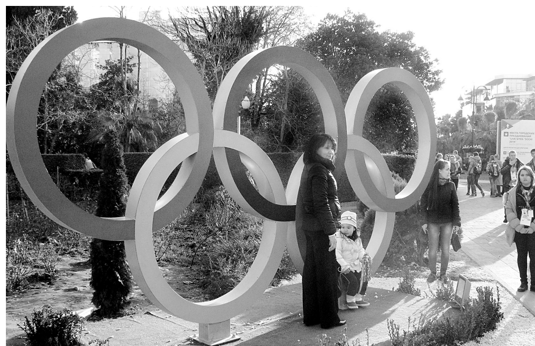
Олимпиада в Сочи и её посетители.

— Для многих станет откровением тот факт, что этот самый скандал имеет отношение не к спорту, а к российской (точнее — советской) ракетно-ядерной программе. Дело в том, что исходным сырьём для получения мельдония является такой компонент топлива, закачиваемого в баки межконтинентальных ракет, как несимметричный диметилгидразин (НДМГ), он же — гептил, он же — аэрозин. Вещество крайне токсичное, но, как ни странно, впервые выделенное из продающихся в любом магазине фруктов, которыми, кстати, ещё никто на моей памяти не отравился: у растений гептил содержится в небольших дозах, выполняет функцию регулятора наследственности и стимулятора роста. Последним фактором когда-то даже пользовались некоторые недобросовестные аграрии, гробившие своё и чужое здоровье в погоне за прибылями и почестями. Поэтому в СССР было принято решение о создании технологии утилизации НДМГ с истёкшим сроком хранения путём переработки в препараты для сельского хозяйства, ветеринарии и медицины. Одним из таких «мечей, перекованных на орала», стал мельдоний. Вот поэтому он стоит костью в горле у наших западных «партнёров», ищущих к чему