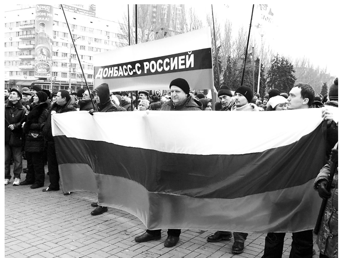
Требования митингов Русской Весны были однозначными.