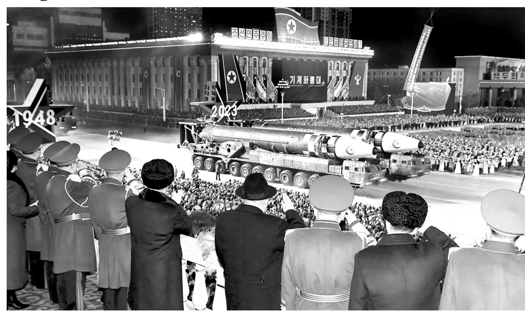
Военный парад в КНДР. 2023 год.

предложили Северу и Югу установить перемирие сроком на шесть месяцев, начиная с 1 января 1863 года. После прекращения огня между Американским Союзом и Конфедерацией Штатов Юга должны были начаться переговоры о мирном урегулировании конфликта на неких взаимоприемлемых условиях. Три европейских государства обещали стать гарантами перемирия и взять на себя роль посредников в переговорном процессе. Свою заботу о мире Англия, Франция и Испания мотивировали обеспокоенностью ожесточением конфликта, приводящего, как они утверждали, к ненужной и бессмысленной гибели людей, воюющих как за Север, так и за Юг. Позже Гражданская война в Соединённых Штатах, действительно, была признана самым кровопролитным вооружённым конфликтом XIX века, где ежегодные людские потери, в среднем исчислении, превысили аналогичный показатель Наполеоновских войн.