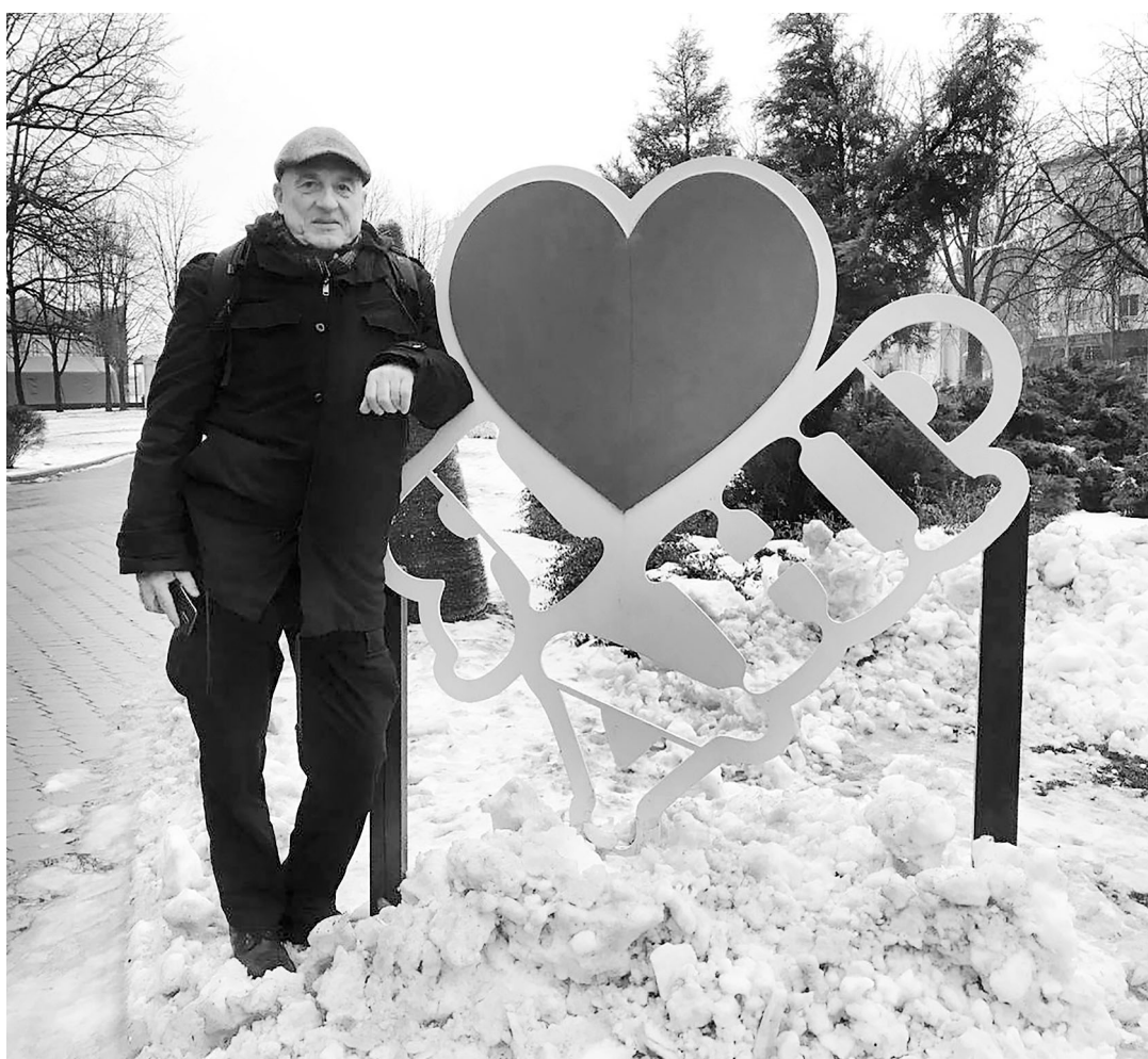
В ДНР во время работы над фильмом «Жизнь и смерть в Донбассе».

На сегодняшний день снял более 70-ти фильмов, в основном репортажи и исторические документальные фильмы для общественного вещания, а также художественные документальные фильмы, такие как «Жизнь в тупике: дневник Ближнего Востока» (удостоен премии в Чикаго в 2003-м году) или «Кримрайз» (награжден в 2018-м году в Санкт-Петербурге). В 2019-м году дебютировал как автор книги «Чудесное путешествие Вернера по ГДР».