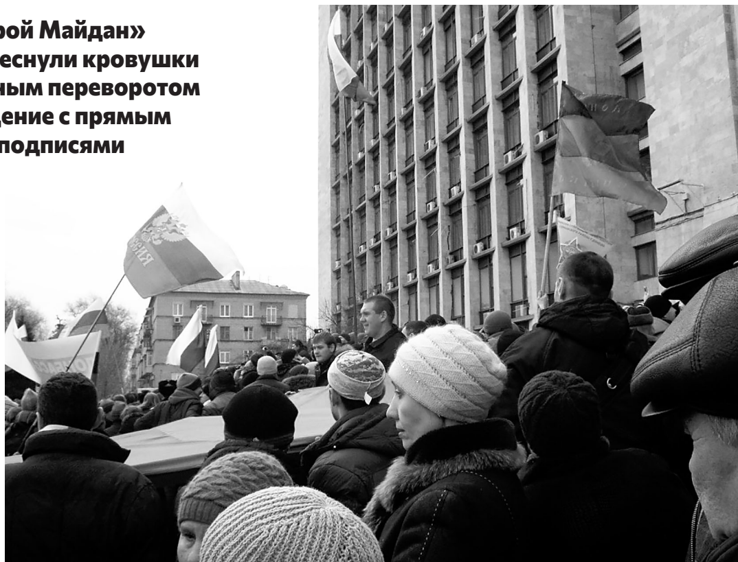
Донецк. Первые митинги 2014 года.

В Луганске движение приобрело специфический оттенок «военной демократии»: в сети появилось несколько роликов «луганских партизан», на которых вооружён-