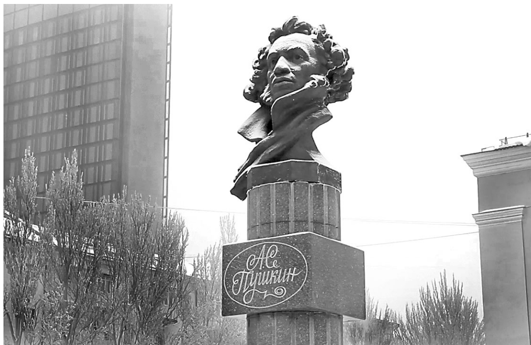
Бюст А.С. Пушкина в Донецке.

Так появляется третий фигурант дела – голландский дипломат Луи Геккерн, приёмный отец Жоржа Дантеса. Пикантности ситуации придаёт следующие детали: Геккерн усыновил Дантеса в 1836 году, когда «сынчочку» было уже 24 года. Сам «папочка» никогда не состоял в браке и (чтобы выразиться помягче) разделял «передовые европейские ценности». Иными словами, РЕВНО-