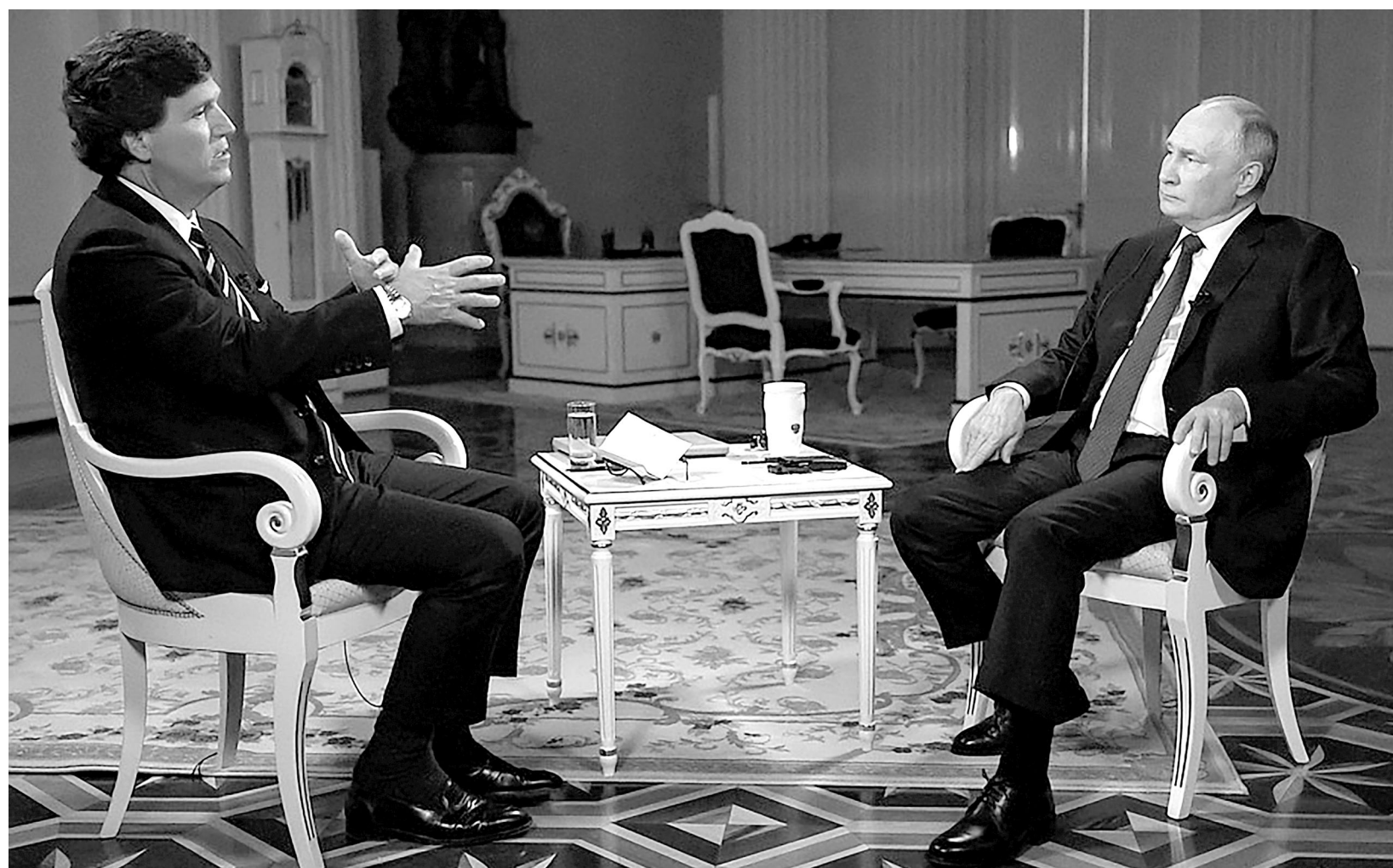
Общение Владимира Путина и Такера Карлсона.

Встреча Президента России с американским журналистом Такером Карлсоном – событие, которое нельзя недооценить. Многие европейские СМИ назвали это интервью «самым важным событием года», имея в виду, что после его публикации страны Запада больше не смогут продолжать твердить аксиому «Украина – это жертва, а Россия – агрессор». Конечно, в ходе двухчасового общения был затронут огромный спектр вопросов, касающихся и геополитики, и экономики. Но мы остановимся именно на той части, в которой Владимир Путин объясняет, что такое украинский феномен.