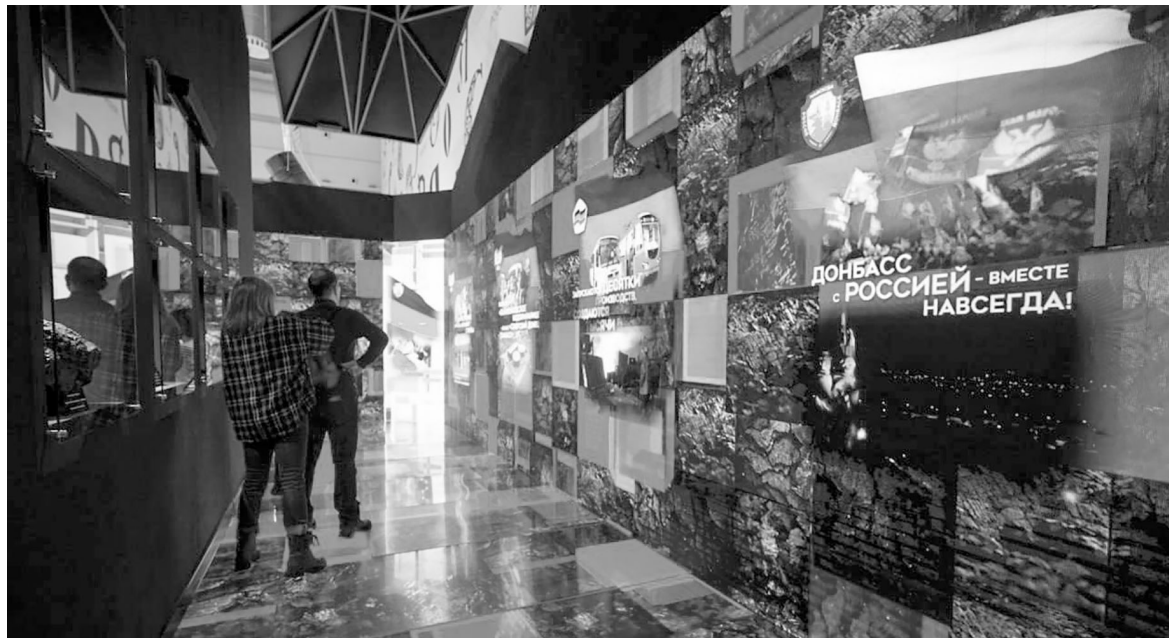
Коридор времени, открывающий донецкую экспозицию.