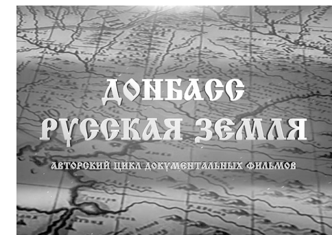
Обложка многосерийного проекта о истории края.