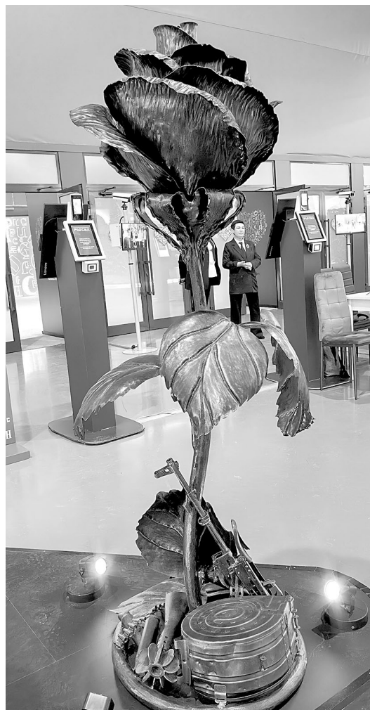
Роза, выкованная из осколков снарядов.

Наша изюминка – кованая роза. Наверное, по количеству прикосновений от посетителей выставки она бьёт все рекорды. До