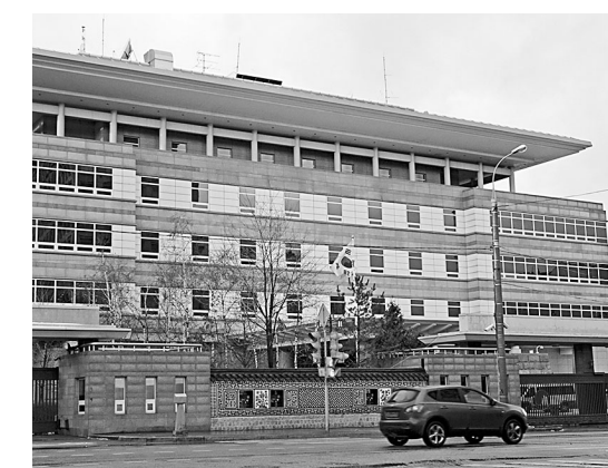
Посольство Республики Корея в столице России.