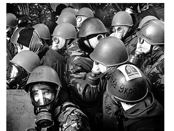
Ударные силы государственного переворота в Киеве.

Юлий ФЕДОРОВСКИЙ (Луганск) Артем ОЛЬХИН (Донецк)