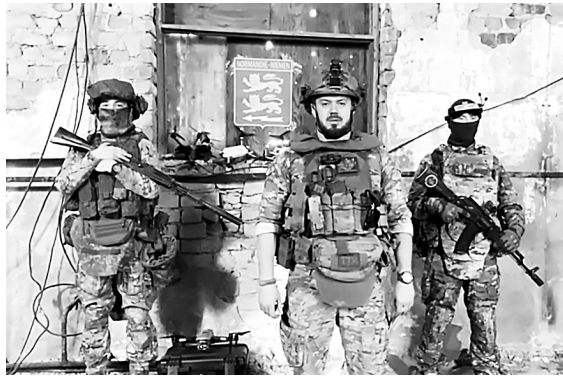
Бойцы французского добровольческого соединения.