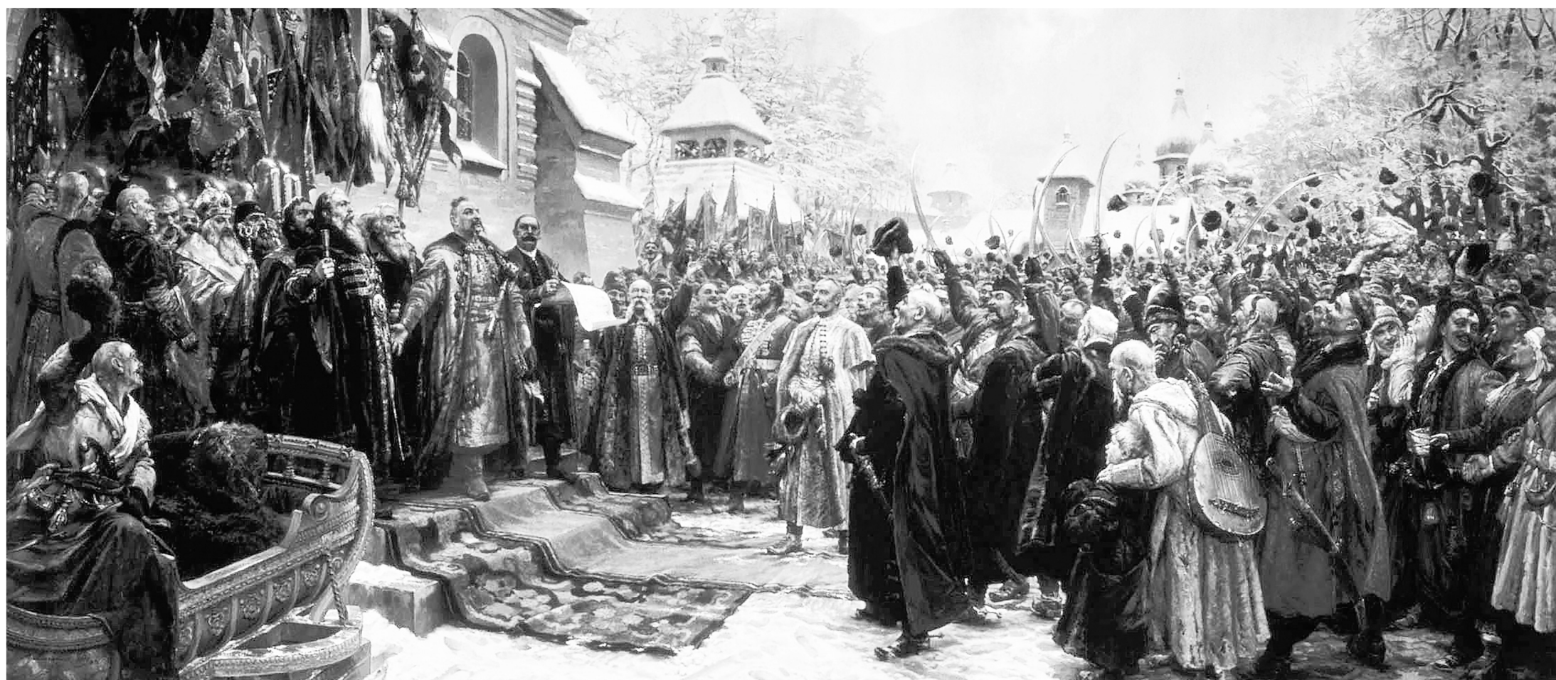
«Навеки с Москвой, навеки с русским народом». Картина Михаила Ивановича Хмелько. Национальный художественный музей Украины.

Была и ещё одна причина: русские политики не доверяли казачьим вождям, зная их как людей ненадёжных и готовых ради личной выгоды легко предать и поменять лагерь. Потому русским людям, начавшим восстание против Варшавы, в Москве сочувствовали, посылали гуманитарную (и не только) помощь, отменили таможенные сборы на границе, но в войну ввязываться не спешили и очень уклончиво отвечали на все заигрывания гетмана. Подчеркну, участники событий во всех дошедших до нас документах называли себя русскими людьми , а свою землю – Малороссией . Никаких украинцев в то время ещё не существовало.