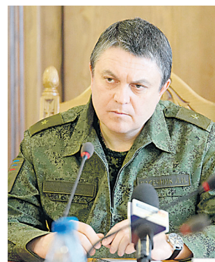
Леонид ПАСЕЧНИК, Глава ЛНР

Не сомневаюсь, что скоро территория Донецкой Народной Республики будет полностью освобождена, и мы вместе отметим нашу Победу!»