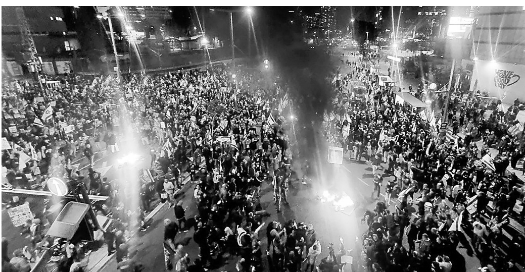
Сбор на один из антиправительственных митингов.