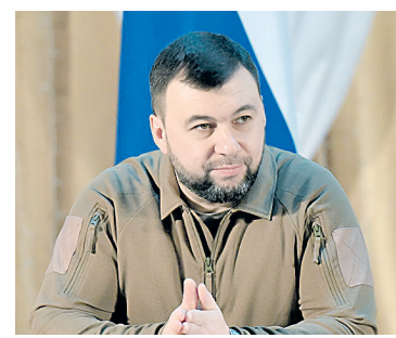
Денис ПУШИЛИН, Глава ДНР

И, кстати, анализ событий тоже был сделан верно. Уже 12 апреля начались бои сначала в Славянске, а потом и по всей территории ДНР и ЛНР.