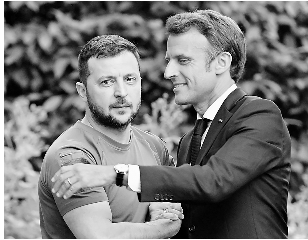
Странные отношения Зеленского и Макрона подталкивают мир к войне.

правительством вызывает всё большую напряжённость в европейских государствах, как, например, в Молдове или Болгарии. В Словакии это уже привело к смене правительства.