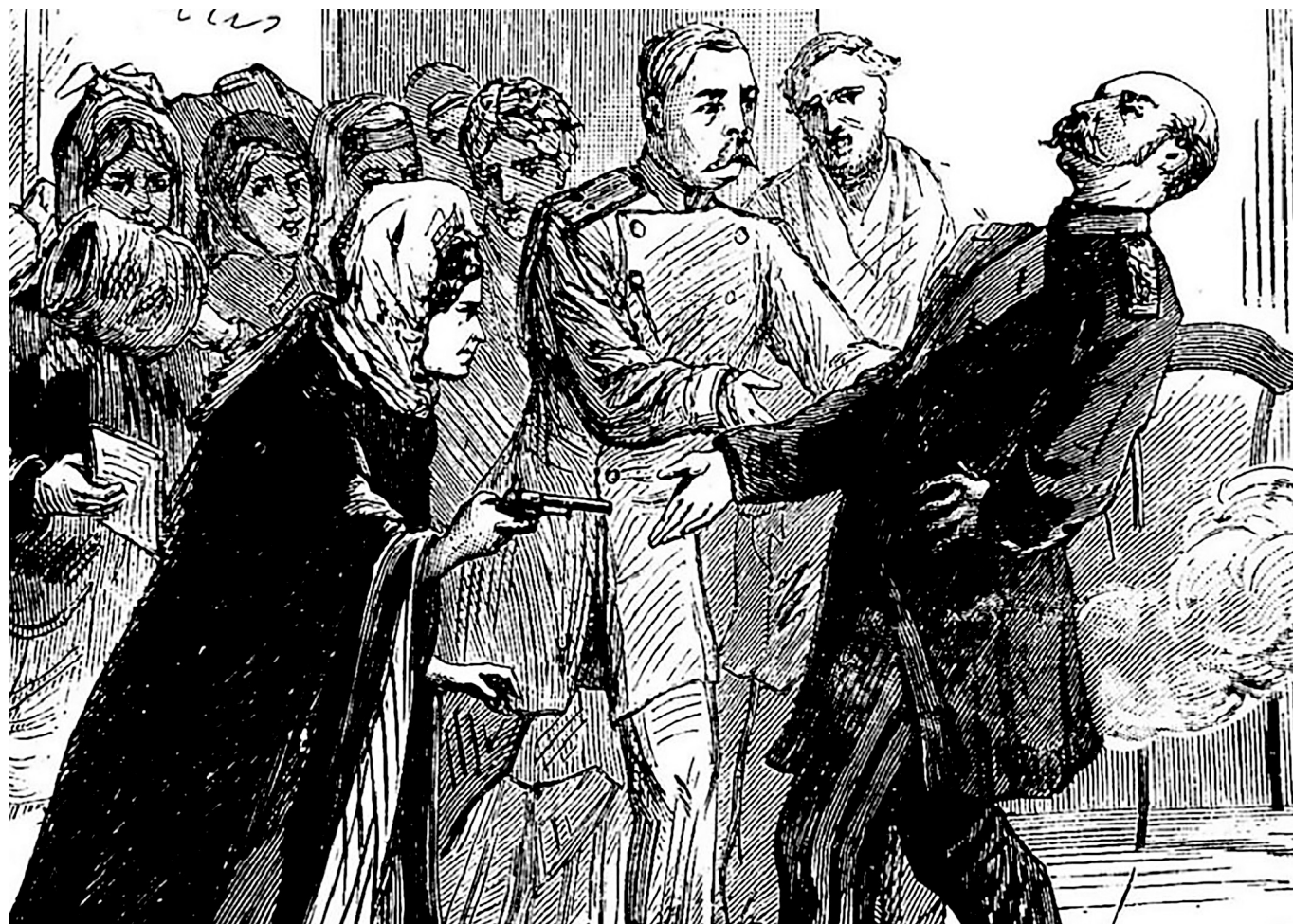
Вера Засулич стреляет в генерала-губернатора Ф.Ф. Трепова. Рисунок из французского журнала 1878 г.