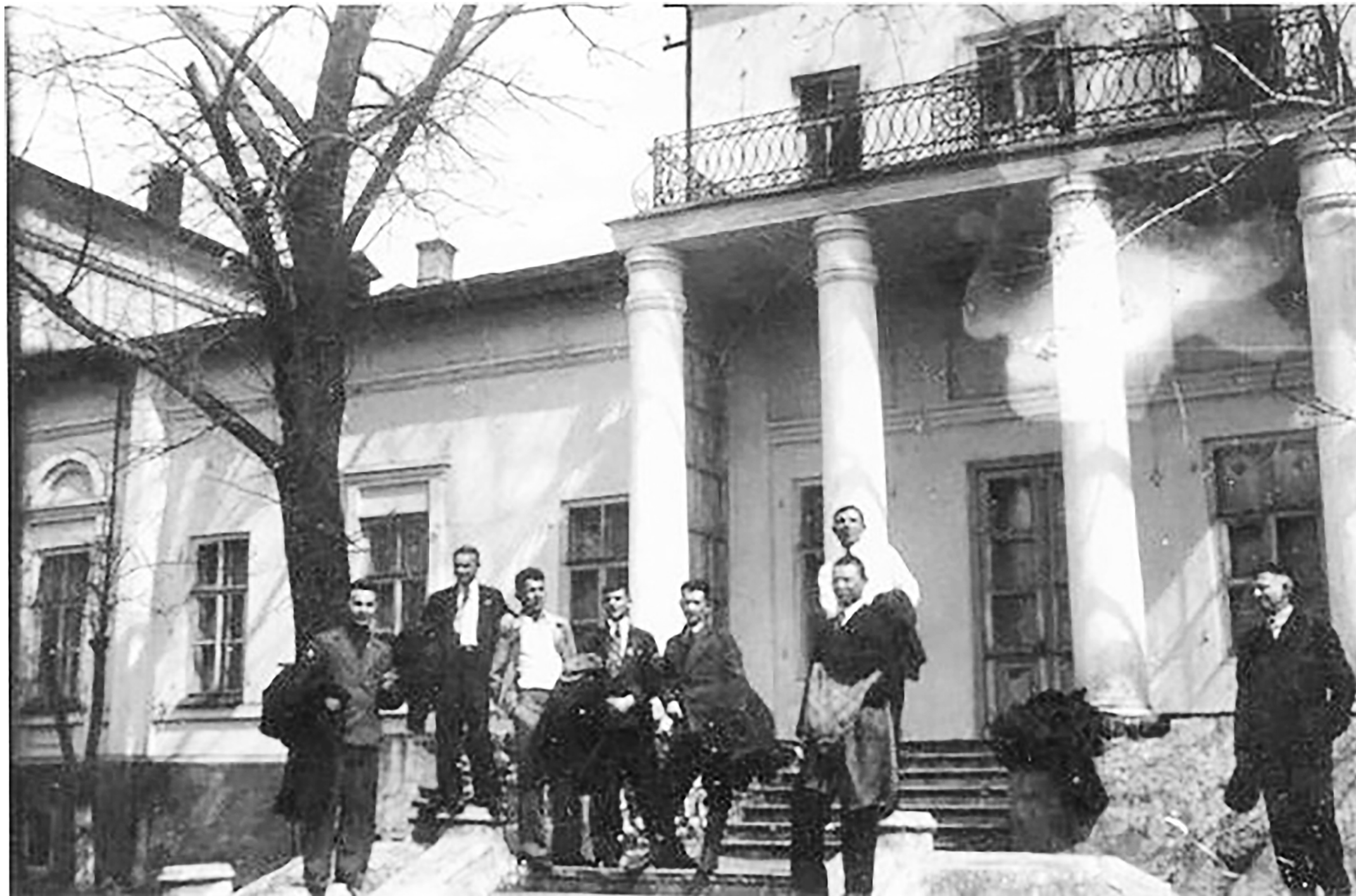
Фасад усадьбы Михалковых в Амвросиевском районе в начале XX века.