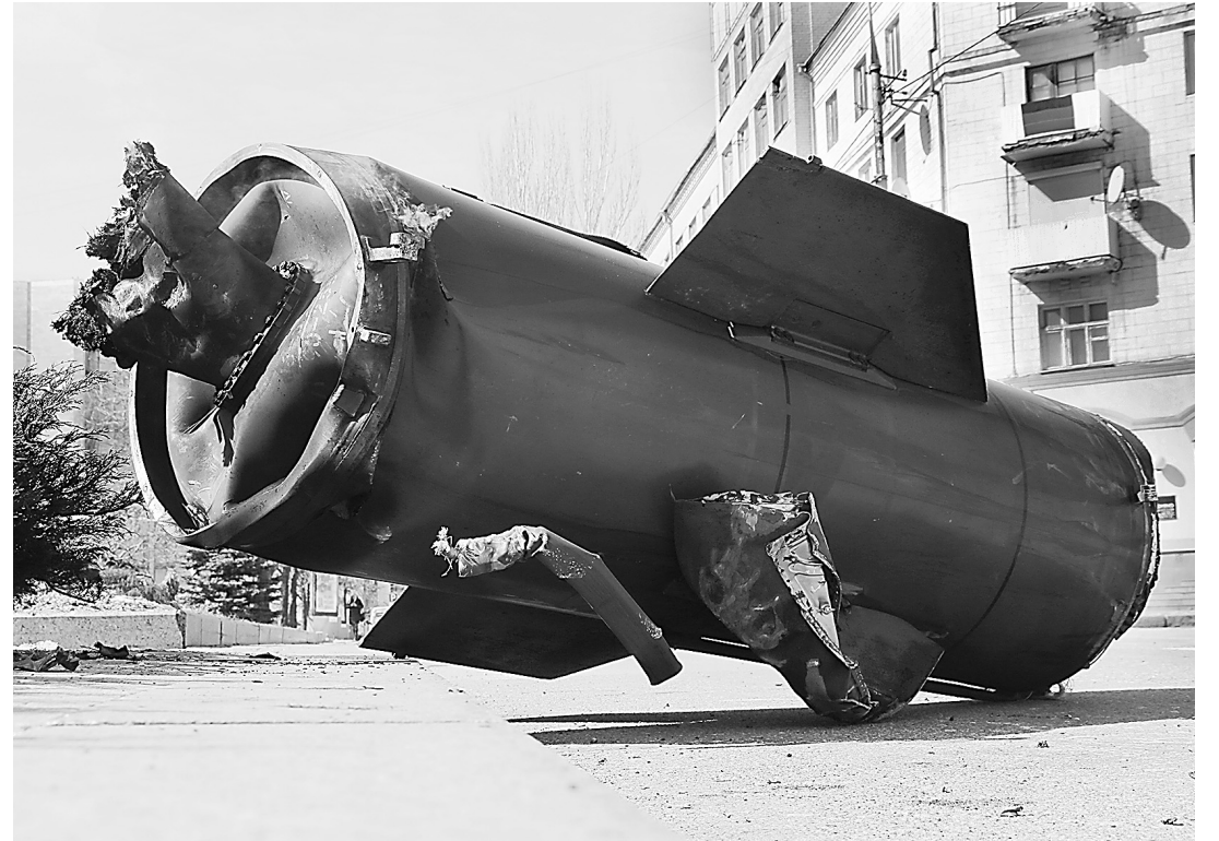
Фрагмент ракеты, упавшей в центре Донецка. Март 2022 г.