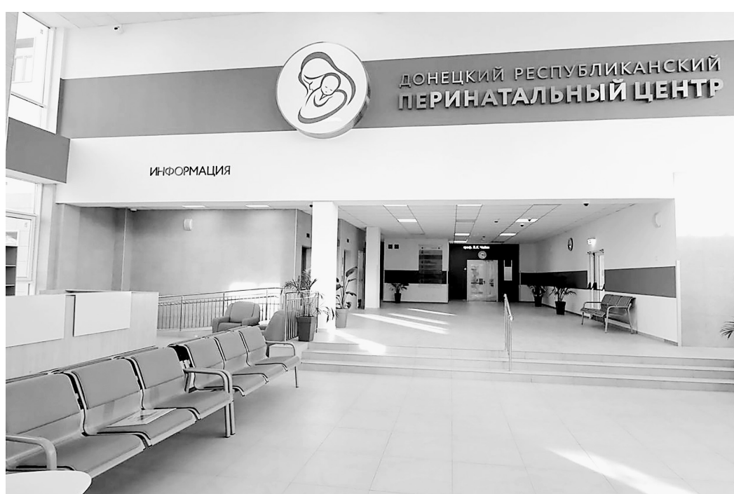
Первый за историю Донецка перинатальный центр.