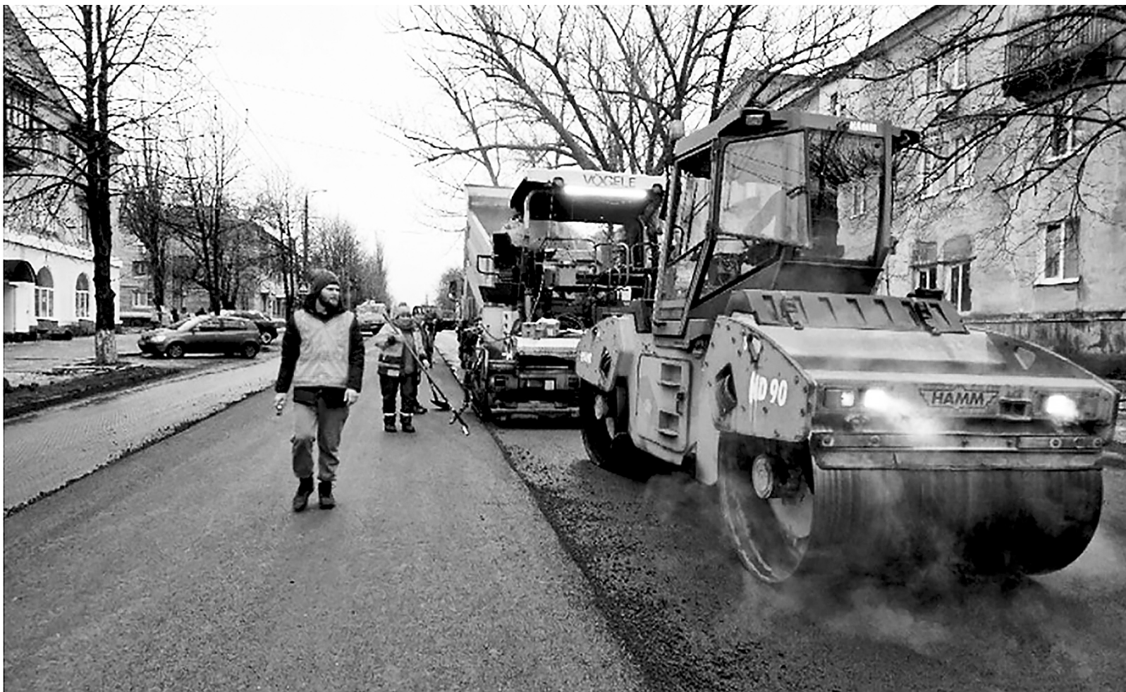
Восстановление дорог, как символ возрождения.