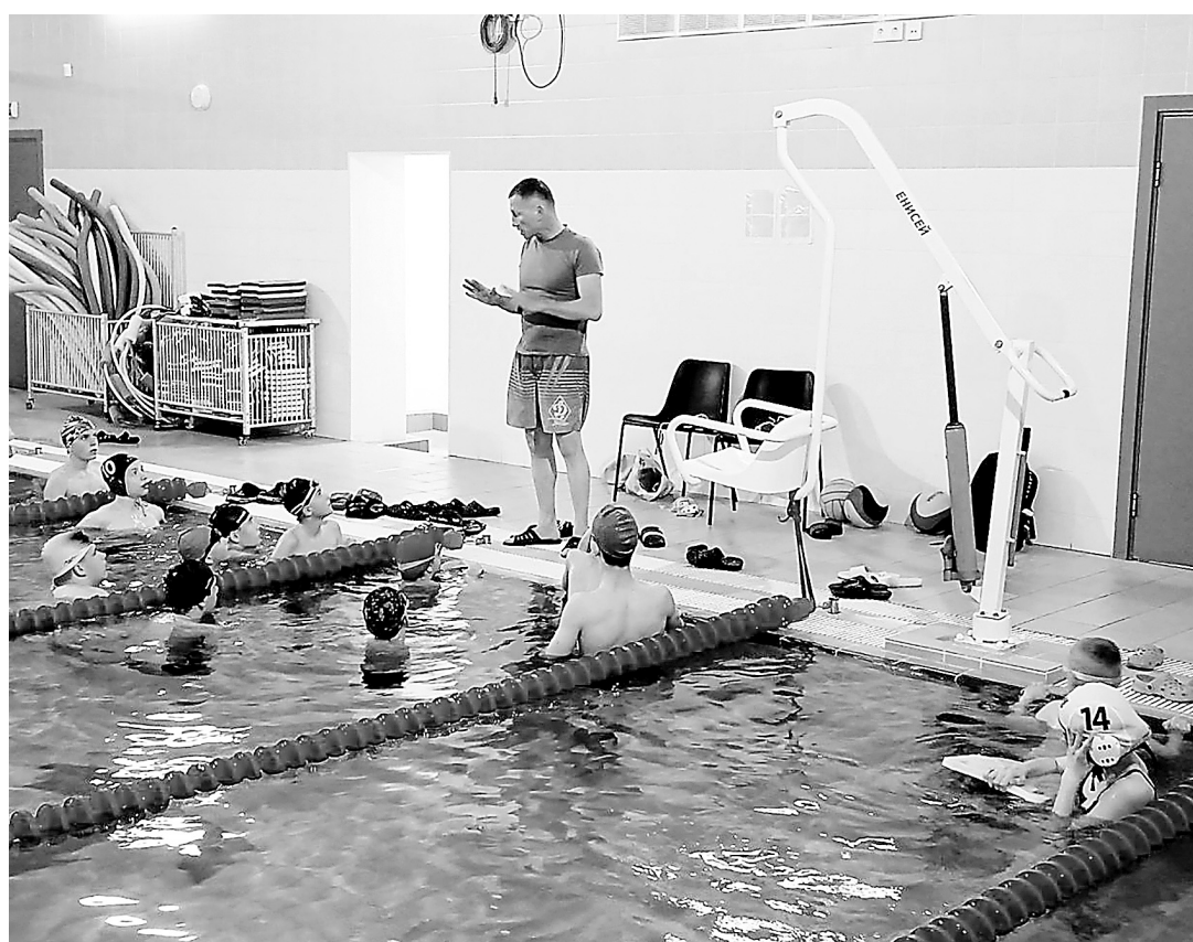
Юные пловцы тренируются в плавательном бассейне КДЮСШ «Прометей».

Пётр Топуз из Мариуполя, специально для ДК