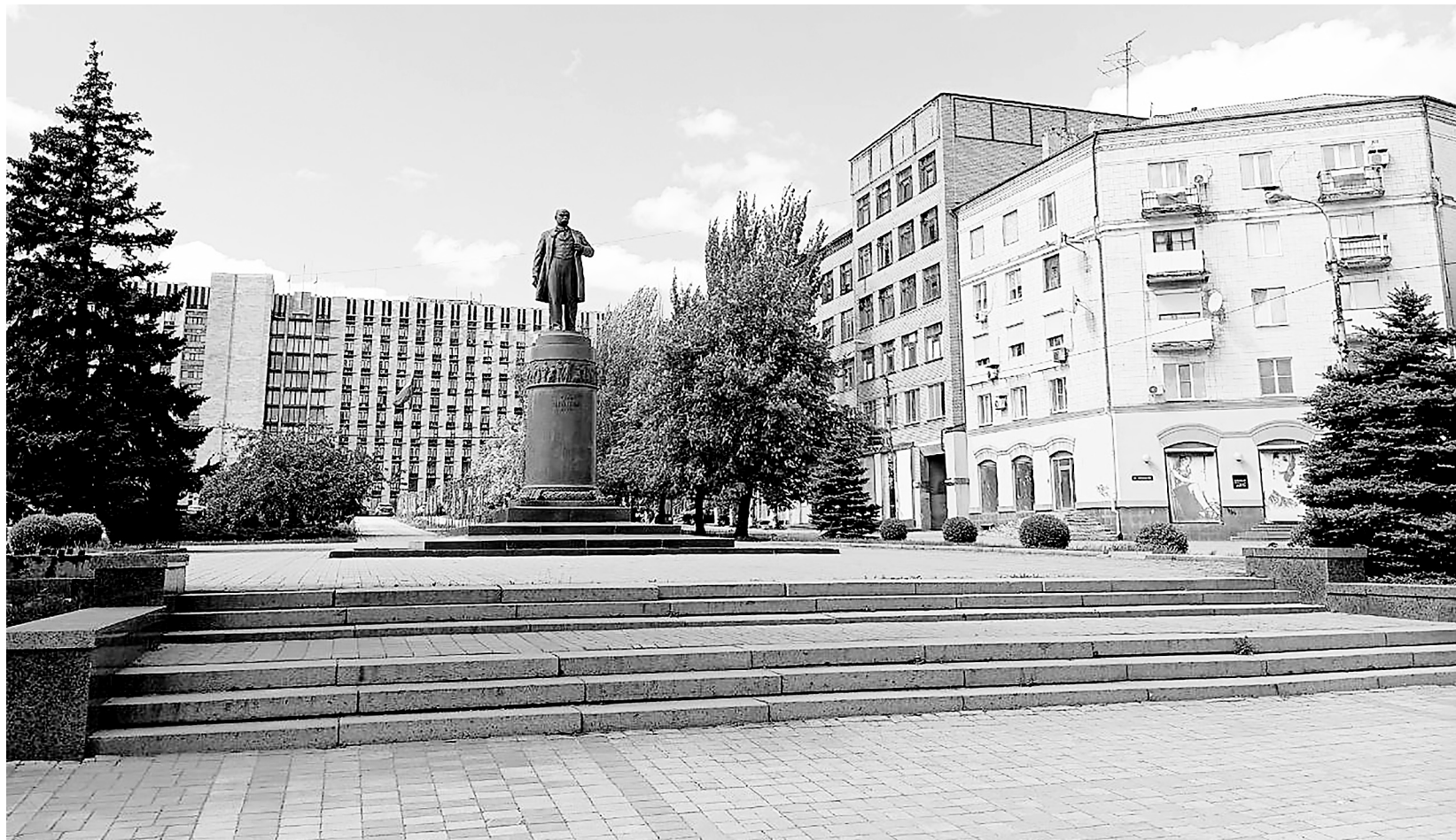
Долго ли ещё памятник русофобу будет стоять в центре русского Донецка?