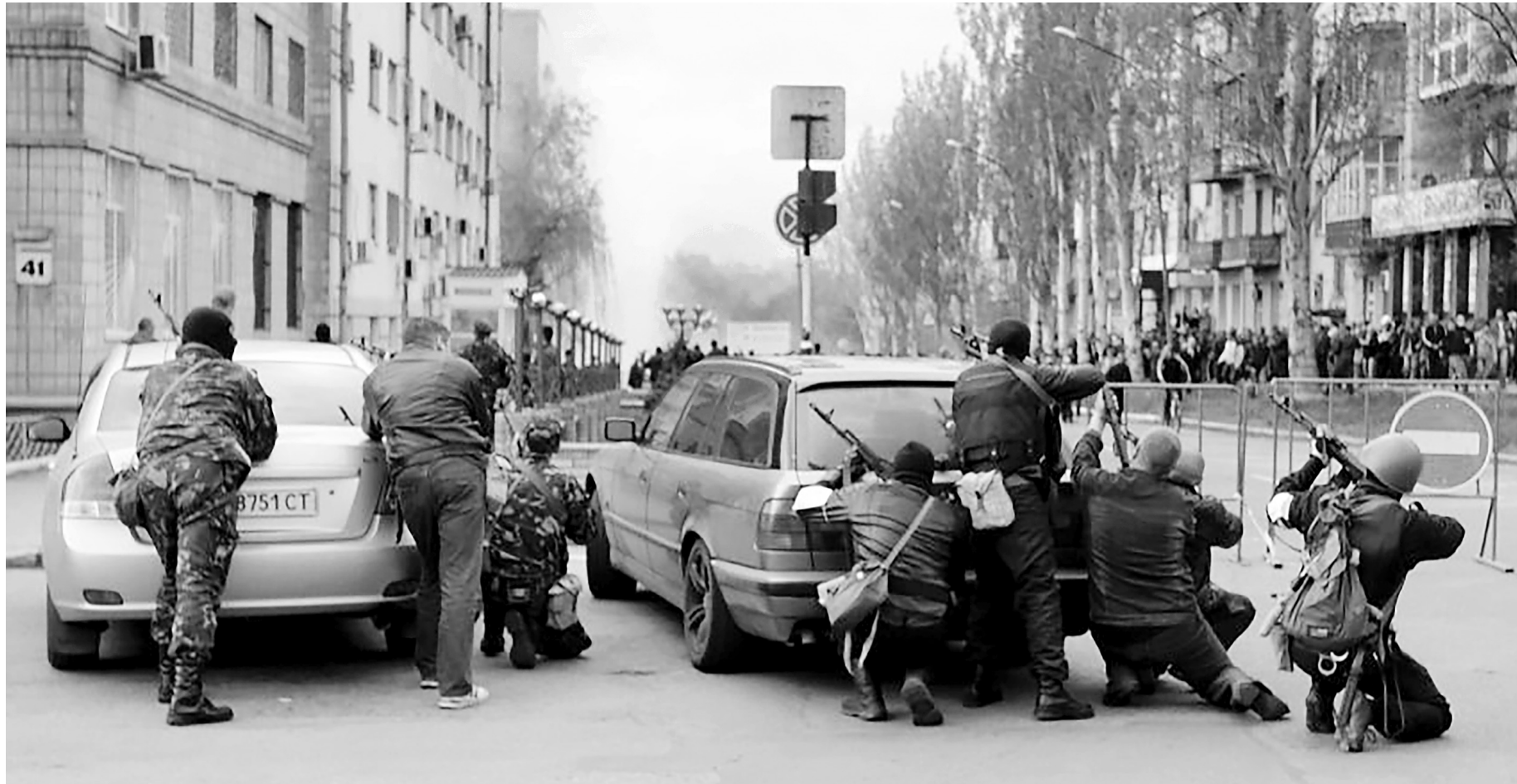
Сражались оружием, добытым у противника.

К сожалению, мирный период существования Республик оказался очень краток. Уже 22 мая, после визита главы киевской хунты Александра Турчинова в военный лагерь «АТО» под Славянском, украинские войска начали боевые действия на территории Луганщины. Колонны бронетехники НГУ и ВСУ двинулись через Рубежное на Северодонецк. На мостах через Донец их встретили баррикады народного ополчения ЛНР. Некоторые мосты были взорваны, завязались бои в промышленном узле Лисичанск – Северодонецк – Рубежное. Одновременно была атакована Станица Луганская. Произошёл первый подрыв железнодорожных путей на перегоне Штеровка-Цетово. Мирные города Луганщины впервые после Великой Отечественной услышали залпы артиллерии и рёв самолётов. В Ровеньках, Попасной, Стаханове, Алмазной, Антраците в полдень досрочно прекращены занятия, учащиеся школ и дети из садов рпущены по домам. Глава ЛНР Валерий Болотов объявил военное положение и обратился к президенту Российской Федерации Владимиру Путину с просьбой о помощи миро-