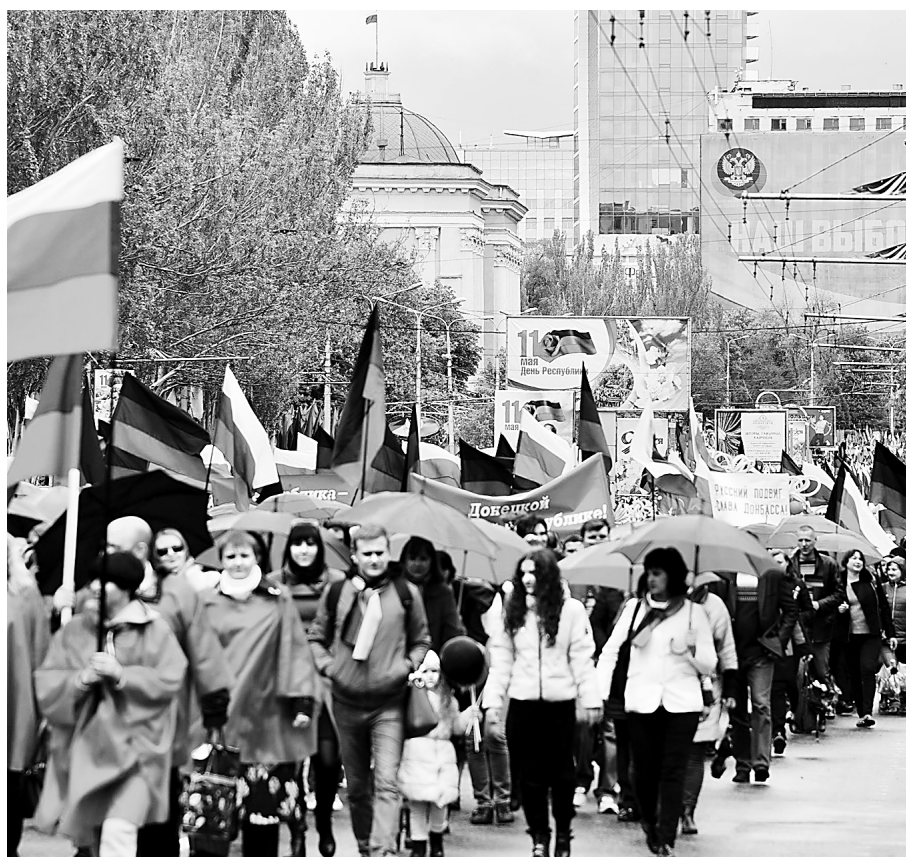
Шествие по улице Артёма. Фото Валерия Дудуша.