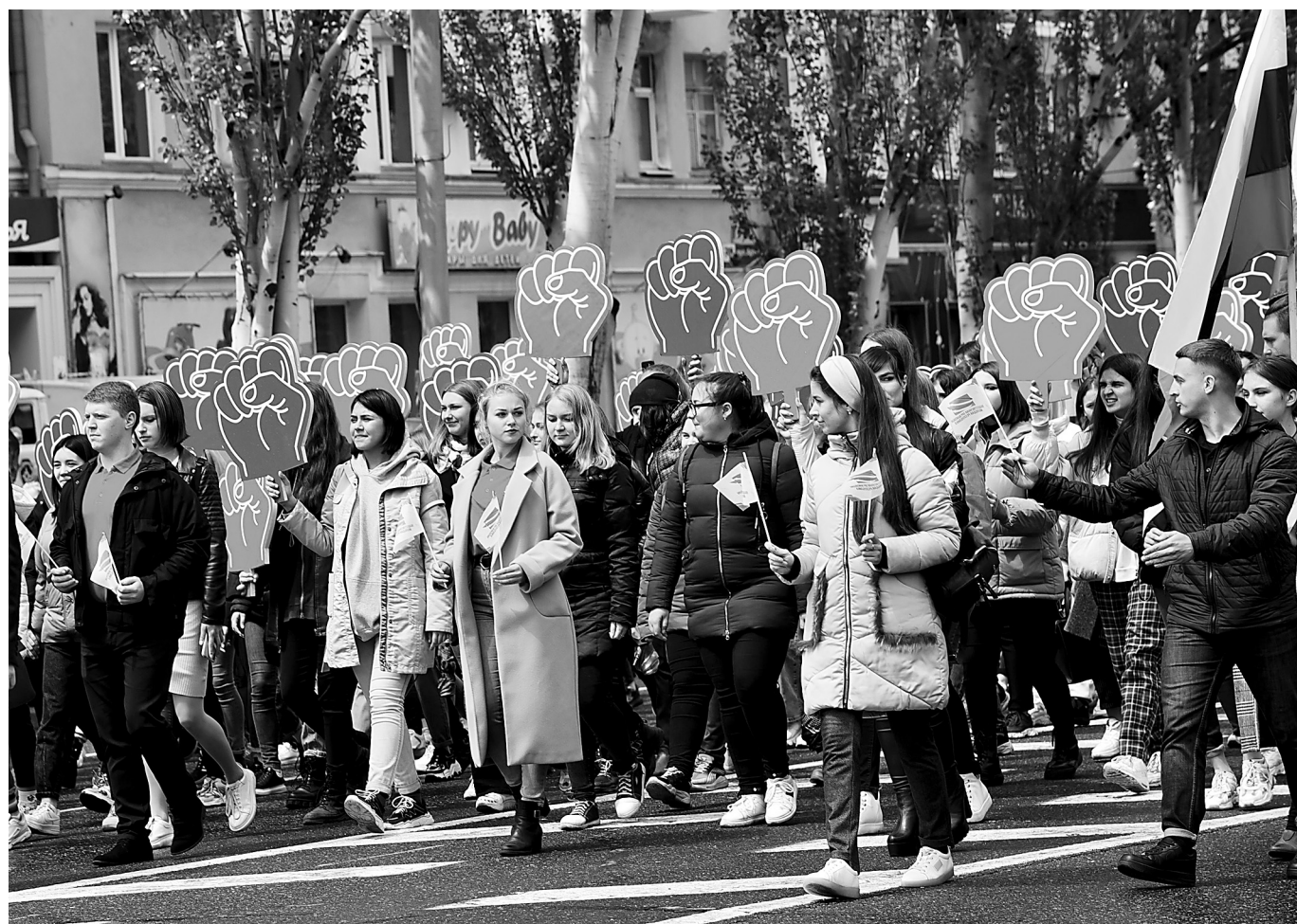
Первомайская демонстрация в столице ДНР.

Началась череда выходных с короткими перерывами на рабочие дни. Что для жителей ДНР предстоящие праздники и как собираются их провести? Самое лучшее для такого общения – донецкие бульвар Пушкина и Парк кованых фигур. Туда и отправился.