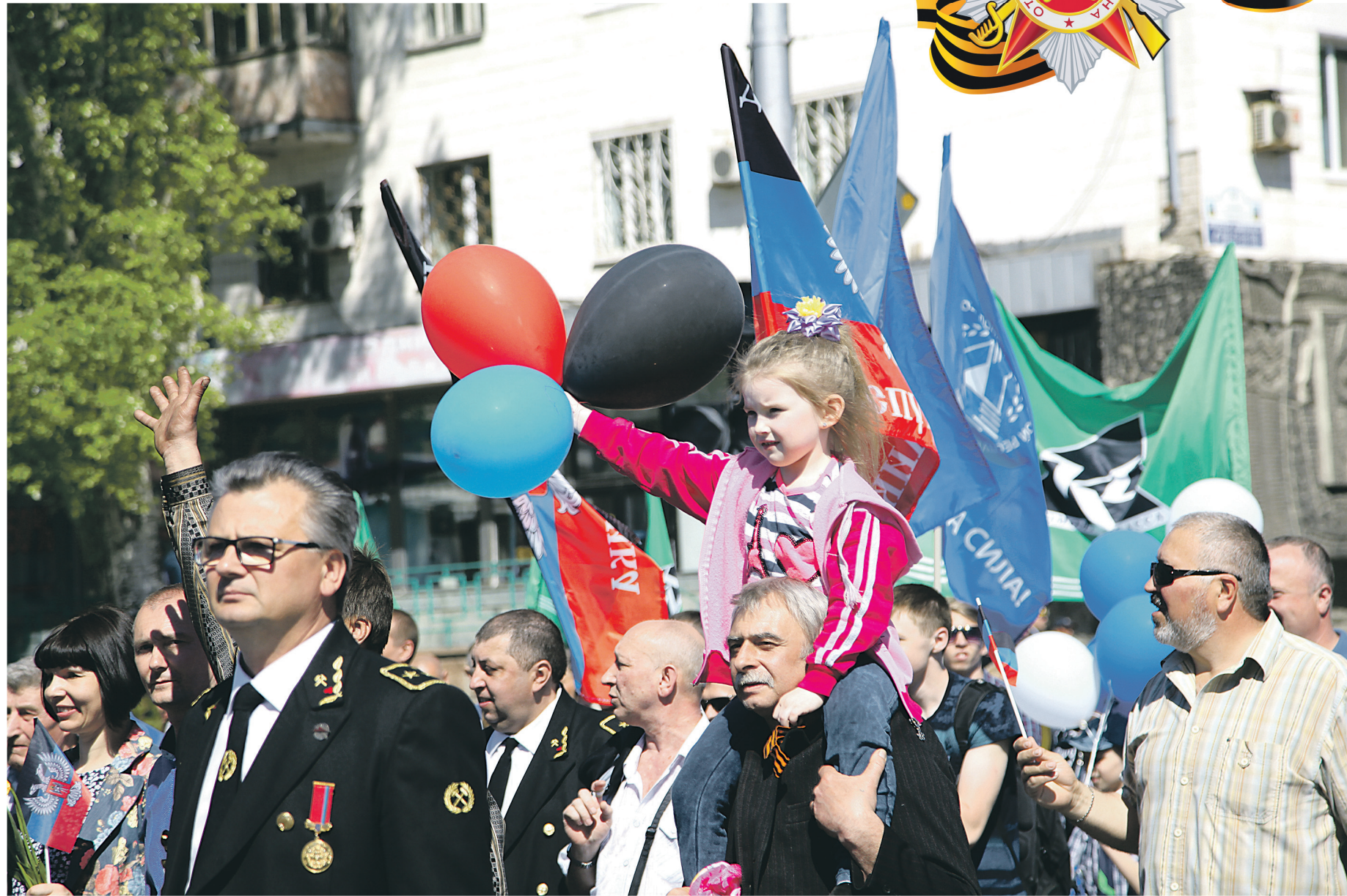
Майские праздники традиционно собирают в центре Донецка людей всех возрастов.

То же самое, кстати, происходит и с днём 8 марта – сколько не бьются головой об стену деятели вроде Ирины Фарюн – успеха не достигают. Напротив, именно это негодование, с которым люди встретили требования отказаться от привычных праздничных дат, во многом стало причиной столь активного всплеска народного протеста в 2014 году. Потому что нам просто лишней раз напомнили, чего хотят лишиться – сна-