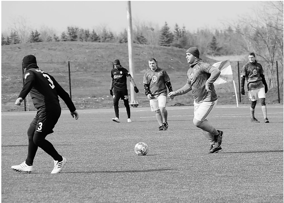
Кубок «За Президента РФ». Матч команд «Эспаньола» и «Калибр».

В результате боевых действий весной 2022 года в Мариуполе было разрушено не только множество жилых домов, но и серьёзно пострадала спортивная инфраструктура. Её нужно было не просто восстановить, а дать ей новую жизнь. Чтобы у мариупольцев появилась возможность заниматься спортом в современных условиях. За что и взялись российские строители.