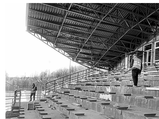
Легкоатлетический стадион в Донецке.

Донбасс исконно знаменит достижениями в различных видах спорта своих уроженцев. Лишь перечисление спортсменов и их достижений займёт не одну газетную полосу. Вот только спортивные объекты, на которых и воспитываются будущие звёзды, давно, можно сказать, с советских времён капитально не реконструировались.