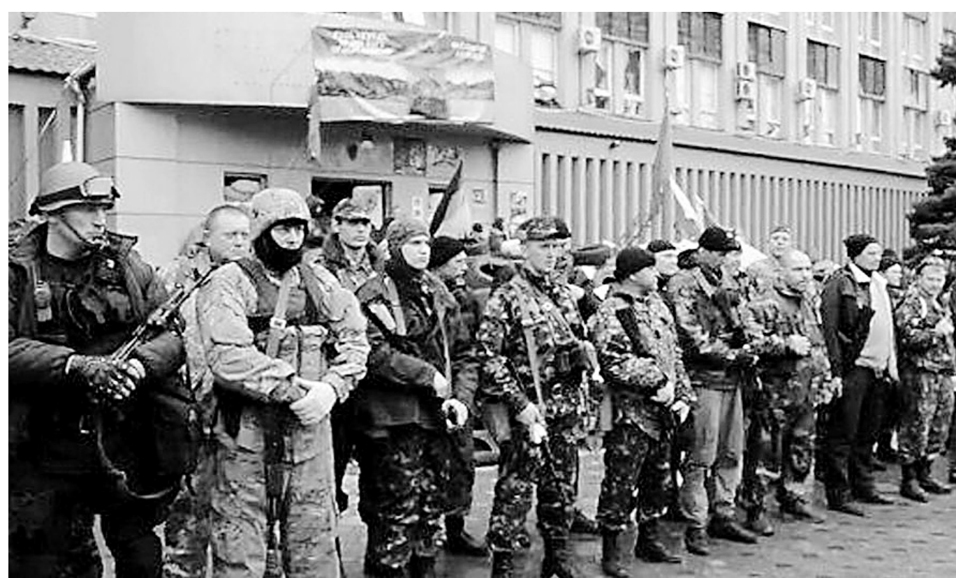
Они первыми встали на защиту своего края.