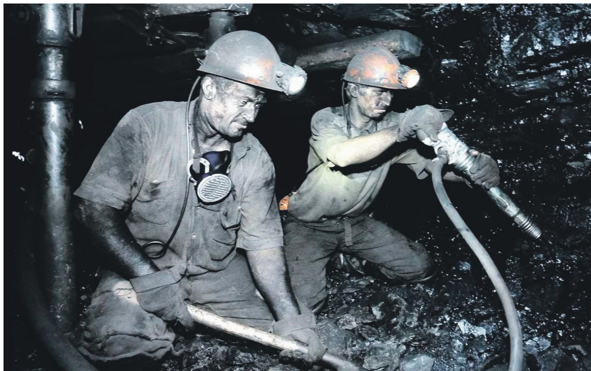
Шахтёрский труд – всегда сражение.