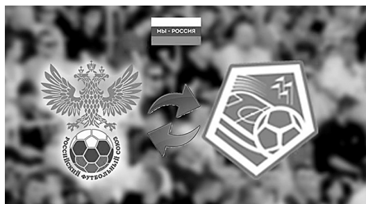
Коллаж «Донецкого Края».

Обращение к президенту России Владимиру Путину губернатора Херсонской области Владимира Сальдо с просьбой поспособствовать включению футбольных клубов Донбасса, Новороссии, Республики Крым и Севастополя в российские соревнования под эгидой РФС подняло определённую информационную волну.