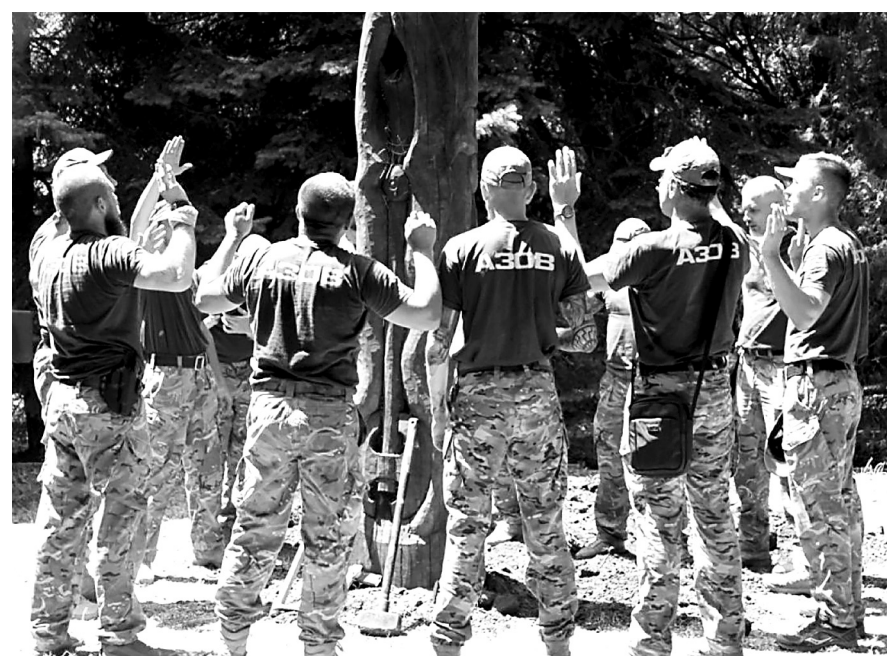
Вот так правильно: щирые поклоняются своему деревянному истукану.

КАЗАКИ (ДАЖЕ ЗАПОРОЖСКИЕ) НИКОГДА НЕ МЕЧТАЛИ НИ О КАКОЙ «УКРАИНЕ». ОНИ ДАЖЕ НЕ ЗНАЛИ ТАКОГО НАЗВАНИЯ. ЭТО В СОВЕТСКОЕ ВРЕМЯ ВОЗНИКЛА МИФОЛОГЕМА, ЧТО «ВО ВРЕМЯ ПЕРЕЯСЛАВСКОЙ РАДЫ В ЯНВАРЕ 1654 ГОДА ПРОИЗОШЛО ВОССОЕДИНЕНИЕ РОССИИ И УКРАИНЫ». А ПОСКОЛЬКУ ОБРАЗОВАНИЕ В СССР БЫЛО ХОРОШИМ, МИФОЛОГЕМА ЗАКРЕПИЛАСЬ НАДЁЖНО, НЕ ВЫРУБИШЬ ТОПОРОМ.