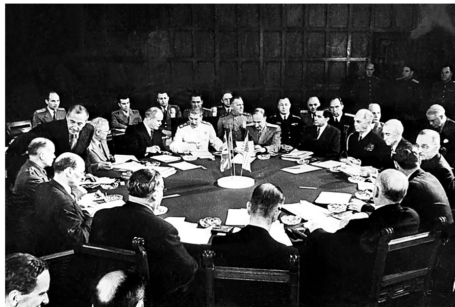
Иосиф Сталин на Потсдамской конференции.