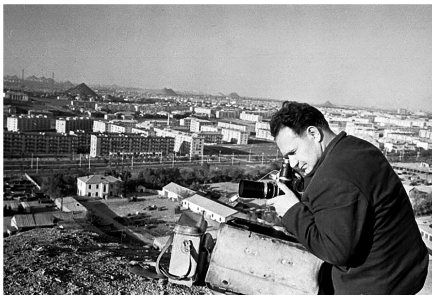
Евгений Халдей снимает панораму Донецка.

Утром 22 июня 1941 года, вернувшись в Москву из командировки, Халдей получил распоряжение из редакции срочно прибыть на работу. В столице на улице 25-го Октября, где находилась редакция