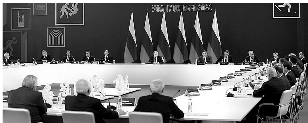
Заседание Совета при Президенте по развитию физической культуры и спорта.

В этой связи добавлю, что с каждым годом всё больше наших компаний, предпринимателей новых спортивных центров, площадок – и не только в тех регионах, в которых они непосредственно работают, но и по всей стране. Они становятся организаторами соревнований и берут шефство над клубами и спортшколами, реализуют свои, корпоративные программы поддержки спорта».