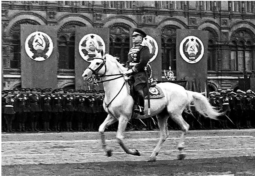
24 июня 1945 года. Парад Победы. Маршал Советского Союза Георгий Жуков на Красной площади.

«На тридцатилетие Великой Победы Евгений Ананьевич приехал в Берлин. Туда он привёз варианты снимков Победы. Даже просил, чтобы его подняли на квадригу Бранденбургских ворот. Есть такое редкое фото, где Халдей показывает полковнику Народной армии ГДР –