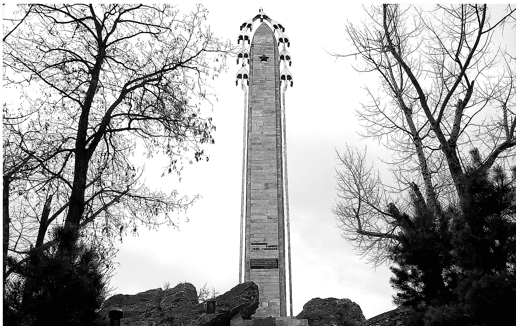
Памятник «Белые Журавли» в Парке Победы имени Расула Гамзатова в ауле Гуниб, Дагестан.

22 октября в России отмечают один из самых поэтических праздников – День белых журавлей. Эти красивые птицы стали символом памяти, скорби и света. В этот день чтят память погибших в войнах солдат.