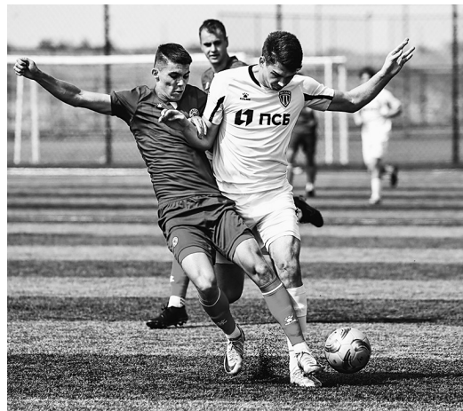
Лига Содружества–2024. Матч донецкого «Шахтёра» и луганской «Заря».

НИКОТО НЕ ЗАПРЕЩАЛ НАШИМ КЛУБАМ ЗАЯВЛЯТЬСЯ В ДИВИЗИОН «Б» ВТОРОЙ ЛИГИ. ДРУГОЙ ВОПРОС – ГОТОВНОСТЬ К ТАКОМУ ШАГУ. ЗДЕСЬ ВСТУПАЕТ В СИЛУ КОМПЛЕКС ТОГО, ЧТО У НАС ЕЩЁ НАДО ДОВОДИТЬ ДО НЕОБХОДИМОГО УРОВНЯ – В ЧЁМ-ТО БОЛЬШЕ, В ЧЁМ-ТО МЕНЬШЕ.