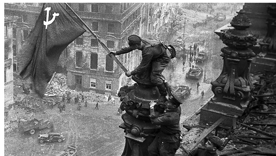
Знамя Победы над рейхстагом.

Символично и то, что все делегаты конференции были одеты в мундиры, пиджаки защитного или чёрного цвета. На Сталине же был белый мундир генералиссимуса. Он значительно выделялся среди всех.