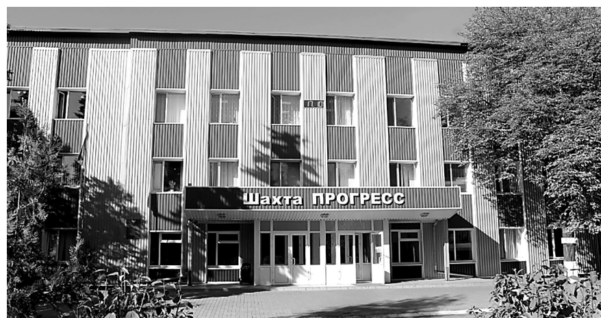
На шахте «Прогресс» планируется ввод новой лавы.

Пресс-служба Минэнерго России сообщила, что переданные инвестору шахты продолжат наращивать добычу угля. Рост добычи будет осуществляться за счёт ввода в эксплуатацию новых лав и технического перевооружения действующих.