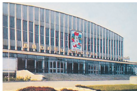
Дворец спорта «Дружба». Год 1976-й.