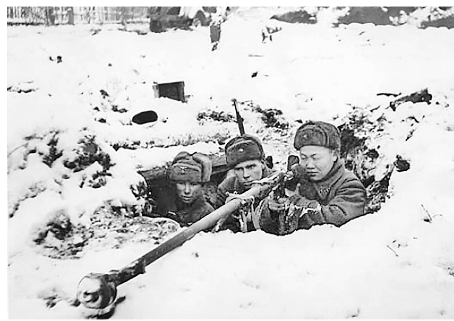
Расчёт ПТРД-41 на позиции во время битвы за Москву.

Согласно статье Александра Юрьевича Кривичко «Завещание 28 павших героев», опубликованной 28 ноября 1941 года в «Красной звезде», танковую атаку отбивали 28 панфиловцев, причём 29-й боец струсил, за что и был застрелен своими однополчанами на поле боя. По данным этой публикации, те 28 солдат совершили героический поступок: они сожгли 18 танков, что остановило атаку немецких войск. Причём сделали они это ценой собственных жизней. Фамилии этих выдающихся людей Родина узнала позже из публикации 22 января сле-