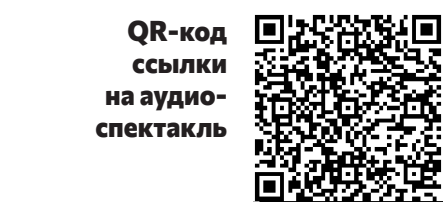
QR-код ссылки на аудио-спектакль

Последней точкой на пути рассказчика становится дом Хараджаева. Александр Давидович Хараджаев – мариупольский купец I гильдии, судовладелец, меценат, горловский голова Мариуполя с 1860 по 1864 годы, первый Почётный гражданин города. Он званный гость на церемонии, поэтому важно ему вручить пригласительные лично. В ходе беседы с хозяином дома рассказчик знакомится с неизвестным художником, которому Хараджаев собирается организовать выставку. По мнению мецената, только благодаря таким людям, как он, зажигаются