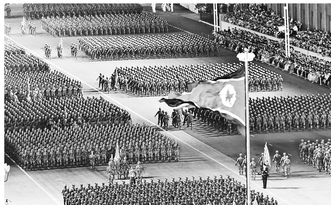
Куда маршируют колонны северокорейских военных?

Тут бы нам всем нелишним было вспомнить, что F-16 могут наносить удары в глубины территории России, и для этого они теперь расположены не так уж далеко от наших границ. Можно пытаться убедить себя и окружающих, что это всё пока ничего не значит и верить в утверждения, что «Украина никому не нужна». Но реальность показывает, что киевский режим продолжает активно использовать. И что Запад, вообще-то, не напуган в достаточной степени для того, чтобы отказаться от своих планов по дестабилизации России. Поэтому новый виток противостояния с использованием