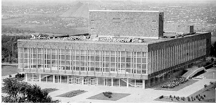
Дворец молодёжи «Юность» – 1970-е годы.

Храм культуры, художественного и технического творчества, спортивных достижений. Место концентрации молодости, здоровья и радости. Всё это – в прошедшем времени о дорогом сердцу каждого дончанина «Юности». Сегодня по дворцу молодёжи «гоняют» ветра, сам он вследствие многократных обстрелов ВФУ лишился остекления и привычного облика. Доживает или выживает – покажет время. Тем не менее, 29 октября донецкая «Юность» отметила 49-летие. И как бы там ни было, она остаётся памятником донбасскому характеру – прошедшему суровые испытания, но не сломленному.