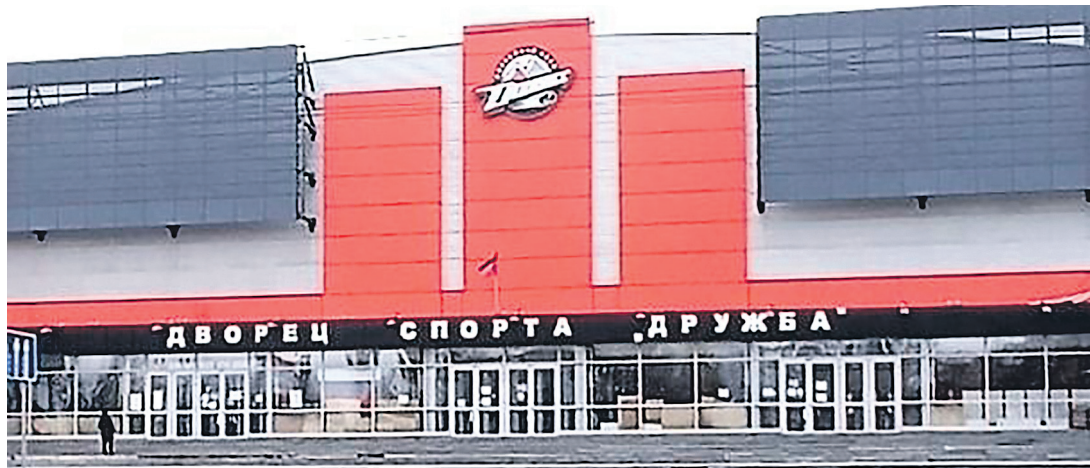
Дворец спорта «Дружба». Год 2024-й.