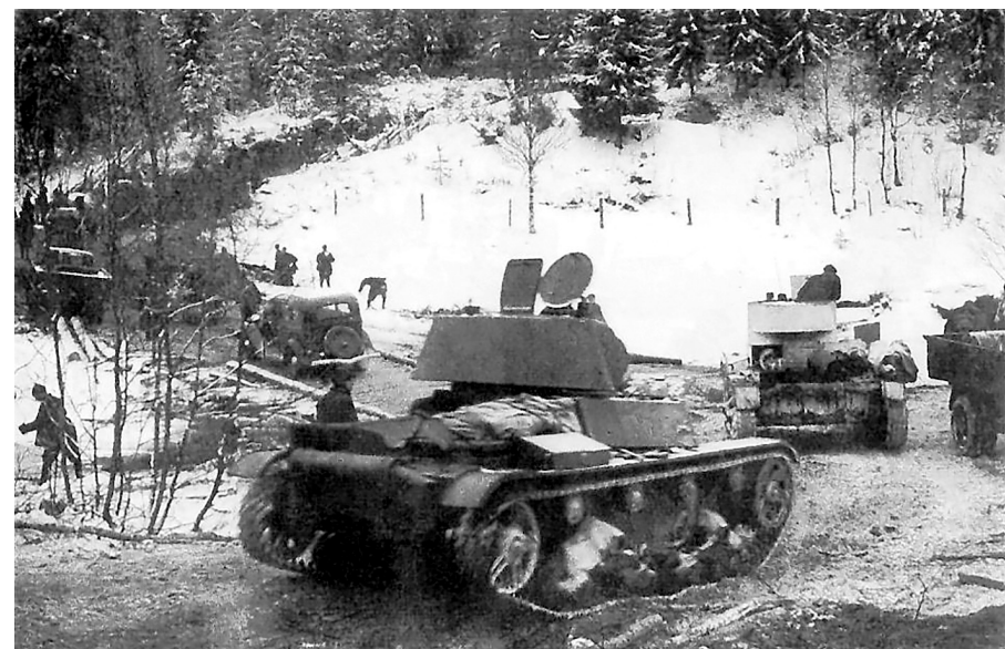
Наступление войск 7-й армии РККА на Карельском перешейке. Декабрь 1939 года.