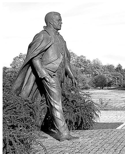
Памятник Иосифу Кобзону, чьё имя будет носить возрождённая «Юность».

репутацию самого лучшего концертного зала города на 1 100 мест. На сцене дворца молодёжи выступали лучшие артисты. Спортзал