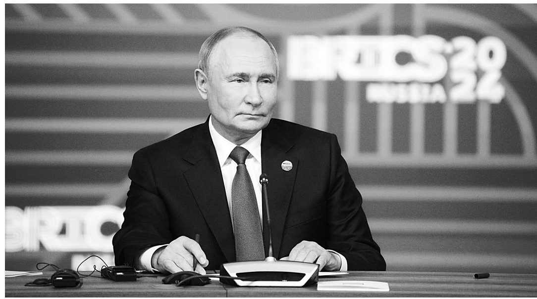
Президент России Владимир Путин на пресс-конференции по итогам саммита в Казани.

На заседании БРИКС в расширенном составе президент России Владимир Путин подчеркнул: «Доля стран БРИКС по паритету покупательной способности по итогам 2024 года и вовсе составит 36,7%, что уверенно превышает долю стран Группы семи, их доля составит