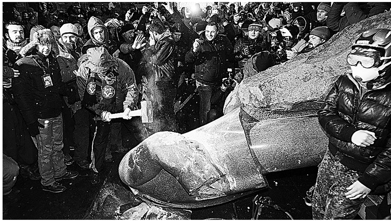
Вакханалия безумия в украинском исполнении.

В этом шокировавшем всех поведении нарочито отсутствовали какие бы то ни было причинно-следственные связи и логика. Многие тогда обращали внимание на тот факт, что украинское государство и возникло-то при Ленине, могли бы хоть за это его помиловать. Другие сравнивали поведение нового майдана с безумствами времён разгрома