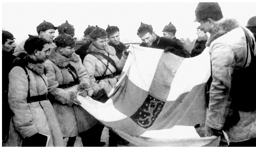
Комсостав и рядовые красноармейцы с захваченным флагом Финляндии.

Можно по-разному оценивать личность Иосифа Сталина, но политической близорукости у него не было. И было ясное понимание заграничных настроений. Ещё в 1931 году он утверждал: «Мы отстаем от передовых стран на 50–100 лет. Мы должны пробежать это расстояние