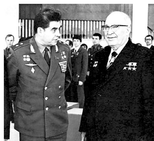
Уроженцы Донбасса – Георгий Тимофеевич Береговой и Ефим Павлович Славский.

О наукоёмкости своего ведомства Славский однажды сказал: «Сейчас у меня своя академия наук: 24 академика, 670 докторов и 4 500 кандидатов наук!» Кроме них трудились сотни тысяч инженеров, рабочих и других специалистов высшей квалификации. Была заложена богатая и крепкая корпоративная культура ядерной отрасли – российский