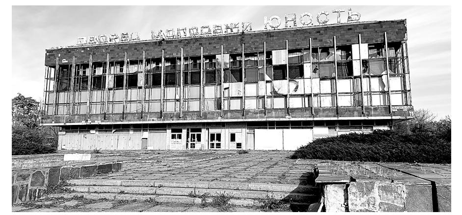
«Юность» – символ стойкости нашего края.

В военное лихолетье «Юность» лишилась остекления, получила множество рубцов и шрамов. Но всё равно долгое время принимала в своих стенах талантливую донецкую молодёжь и детвору, жаждущую творческого развития. Сегодня здание стало домом для стенных донецких ветров. Проезжая мимо, ощущаешь глубокую грусть и досаду от того, во что превратила война некогда прекрасное место жизни.