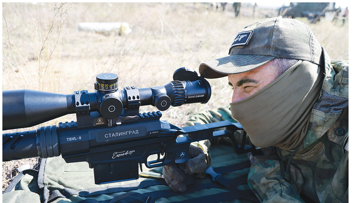
■ Снайпер Кот-Потаскун

По словам Испанца, именно в его подразделении самые минимальные потери, потому что здесь давно и плотно работают над контролем неба. И в этот момент разведка докладывает командиру об обнаруженной точке, где спрятались вражеские наводчики. Буквально за минуту готовятся снаряды, и мы бегом за бойцами отправляемся к гаубице Д-30, чтобы «потушить глаза» противника.