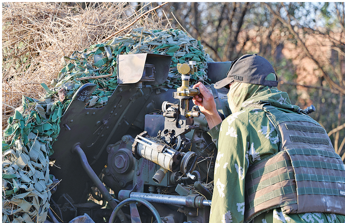
■ Боец настраивает из укрытия прицел пушки по вражеской позиции

Подъезжая к полигону, мы сначала подумали, что враг где-то пошёл на прорыв. На самом деле это бойцы «Эспаньолы» в сжатое время