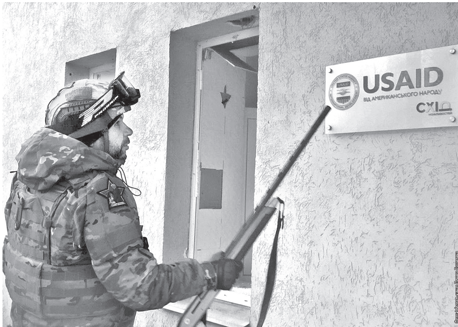
■ Денис Пушилин: «Эту табличку USAID мы сняли со стены в освобождённом Курахово»

С 2014 года USAID и связанные с ним структуры выделяли гранты на «освещение российской угрозы», создавая образ «внешнего врага». Это позволяло Киеву оправдывать военные операции в Донбассе, а Западу – вводить санкции против России.