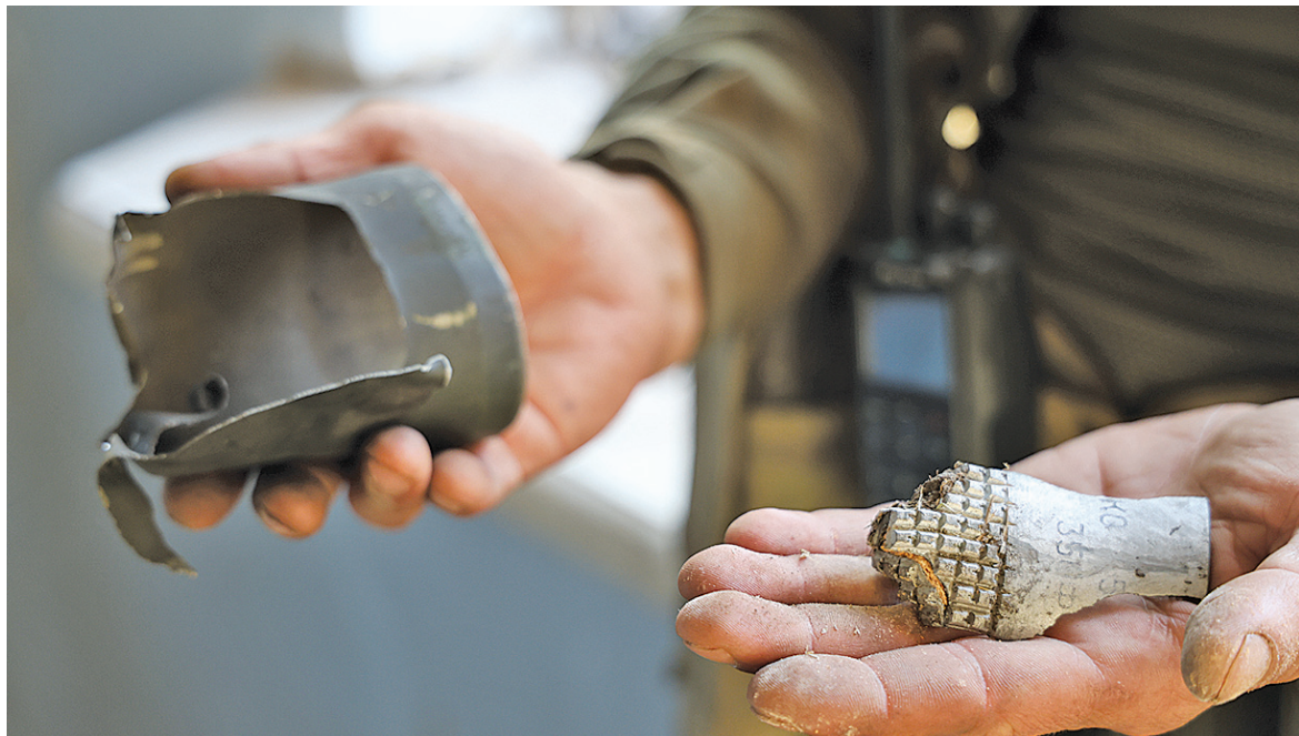
■ Испанец показывает части разорвавшихся снарядов, сброшенных вражеским коптером на наших бойцов

В этот момент Стас лично оставил послание на снаряде за погибших бойцов. После этого пламенную «открытку» тут же отнесли к пушке.