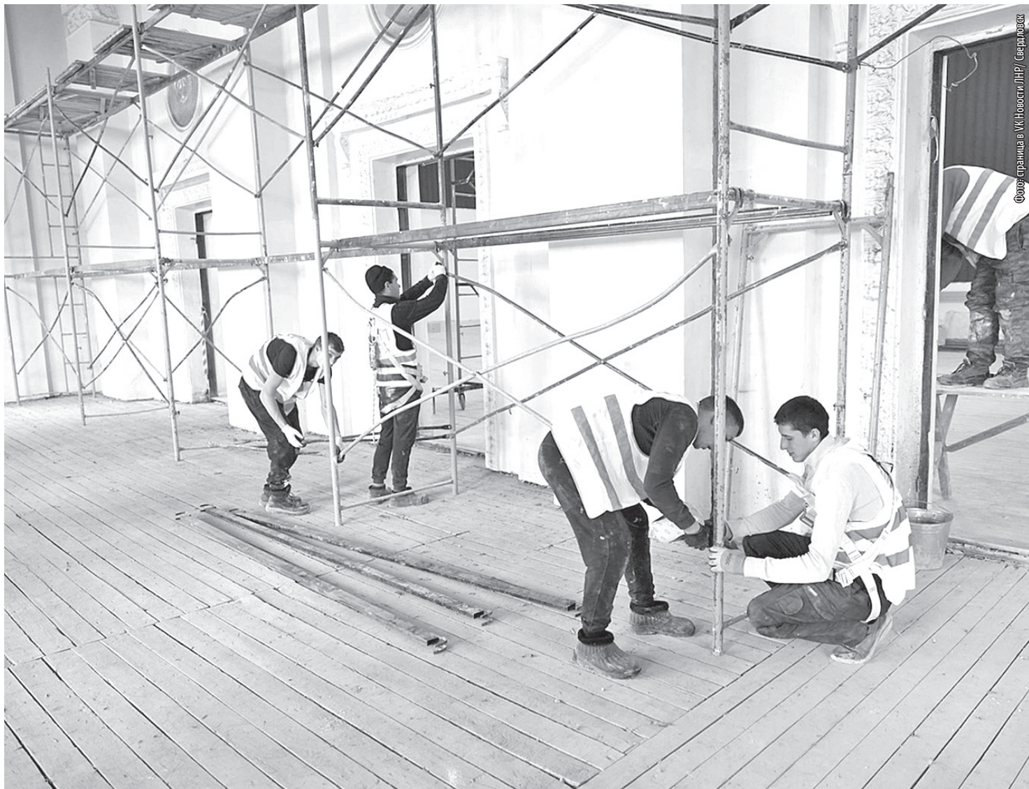
■ Дворец культуры в Червонопартизанске. Ремонт идёт полным ходом

Также в текущем году в населённых пунктах Славяносербского муниципального округа при поддержке региона-шефа планируются капитальные работы по обе-