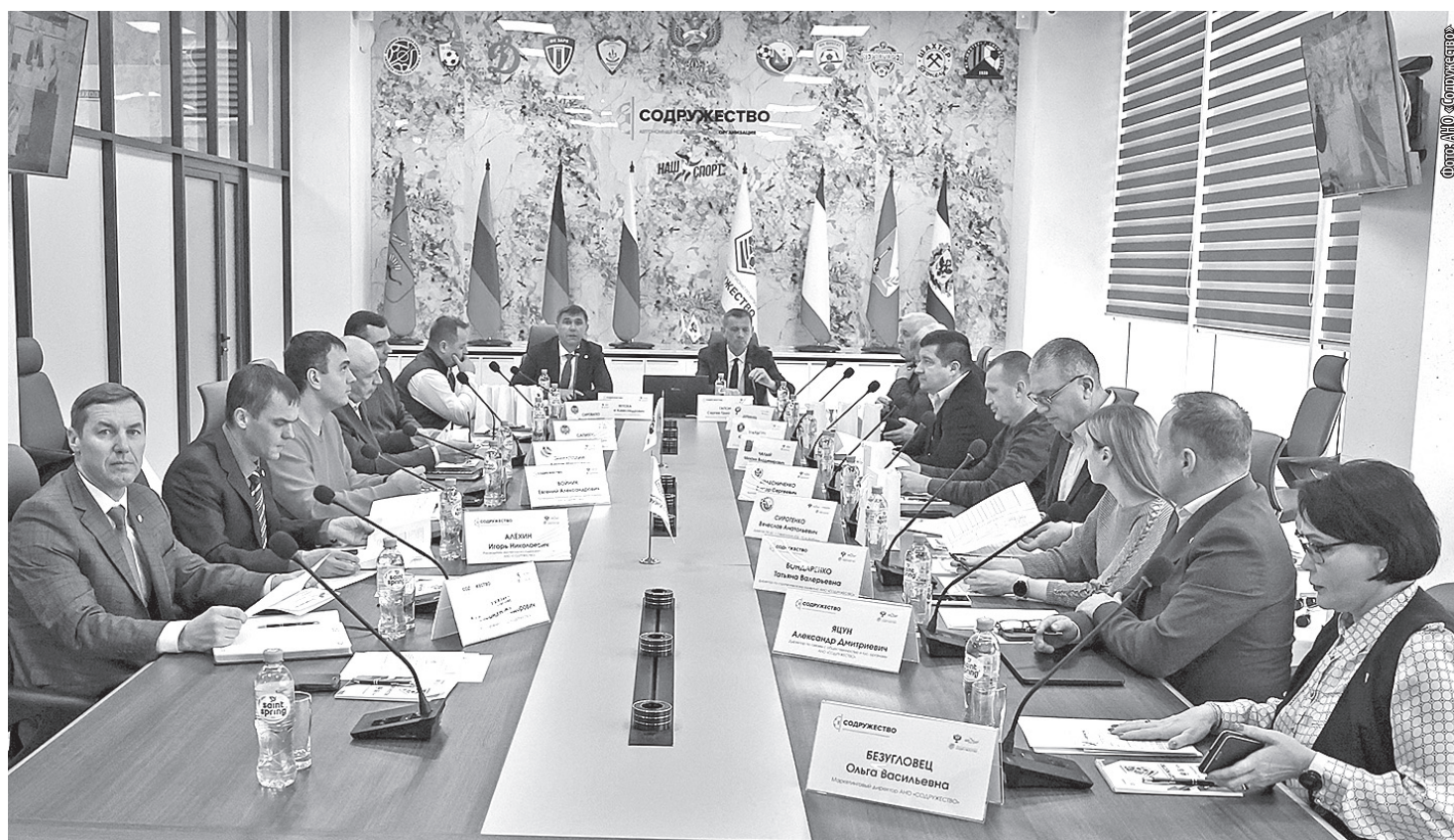
Евпатория. Во время судьбоносного для футбола Донбасса совещания