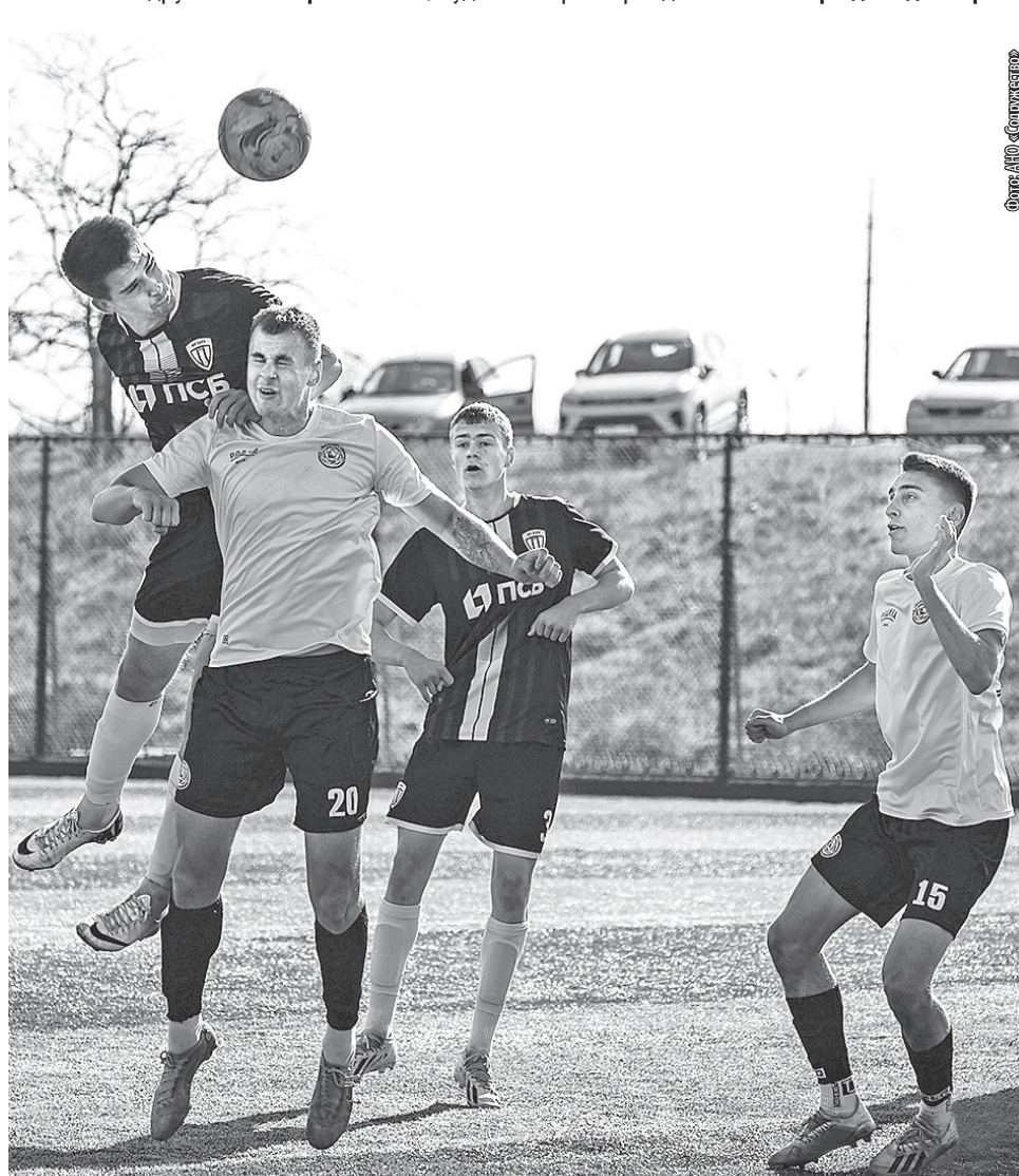
Лига Содружества-2024. Матчи донецкого «Шахтёра» и луганской «Зари» всегда проходят в бескомпромиссной борьбе