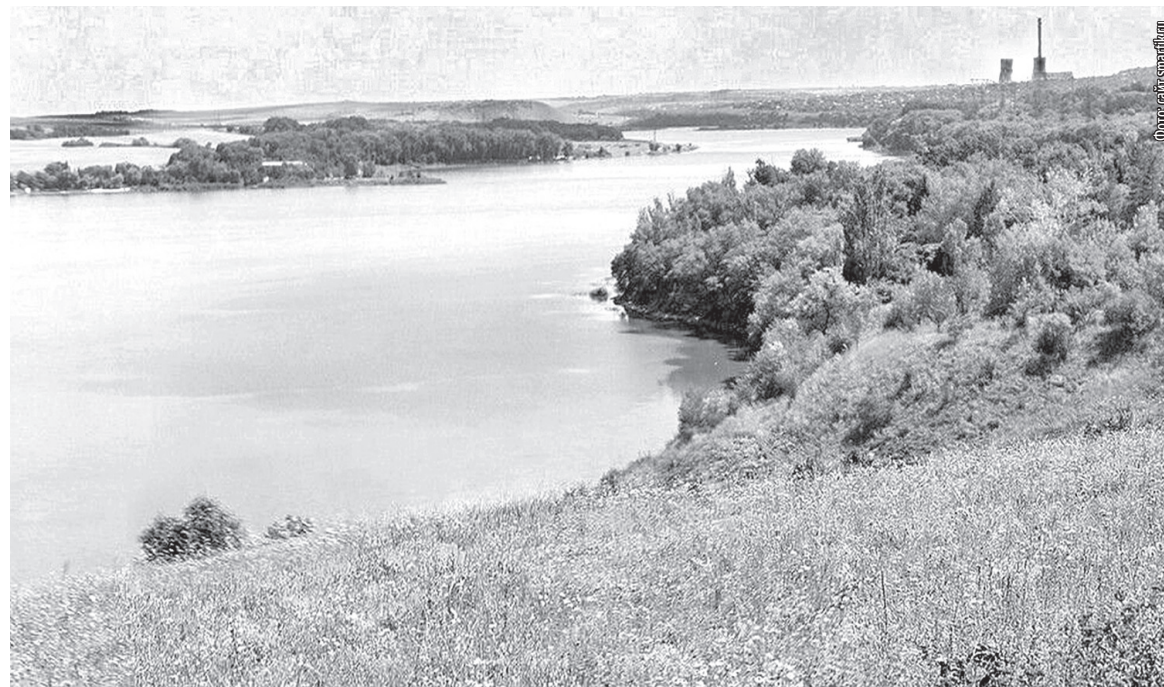
■ Просторы Ханжонковского водохранилища

Двигаемся дальше через площадь Ленина по проспекту Ильича