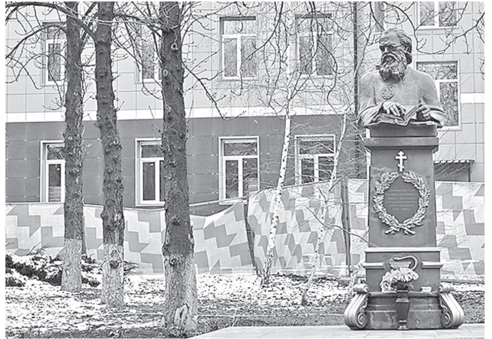
■ 10-й корпус больницы Калинина. Было - стало