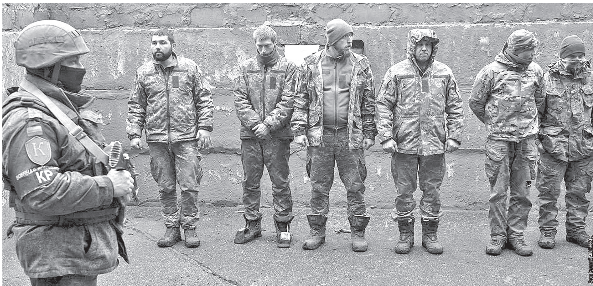
■ Пленные солдаты ВСУ: они выбрали жизнь