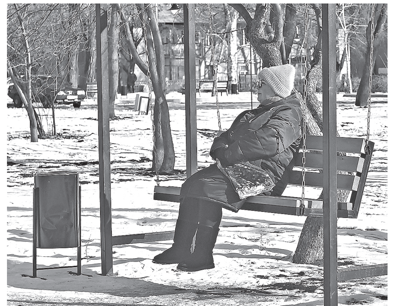
■ Комфортные лавочки, на которых можно отдохнуть и поразмышлять

«Очень удобно молодым мамочкам здесь гулять. Удобная площадка для деток. И главное – относительно тихо и проезжая часть далеко. Весь наш район в восторге от сквера. Возьму на себя смелость и выражу благодарность от жителей всего района за такой подарок», – поде-