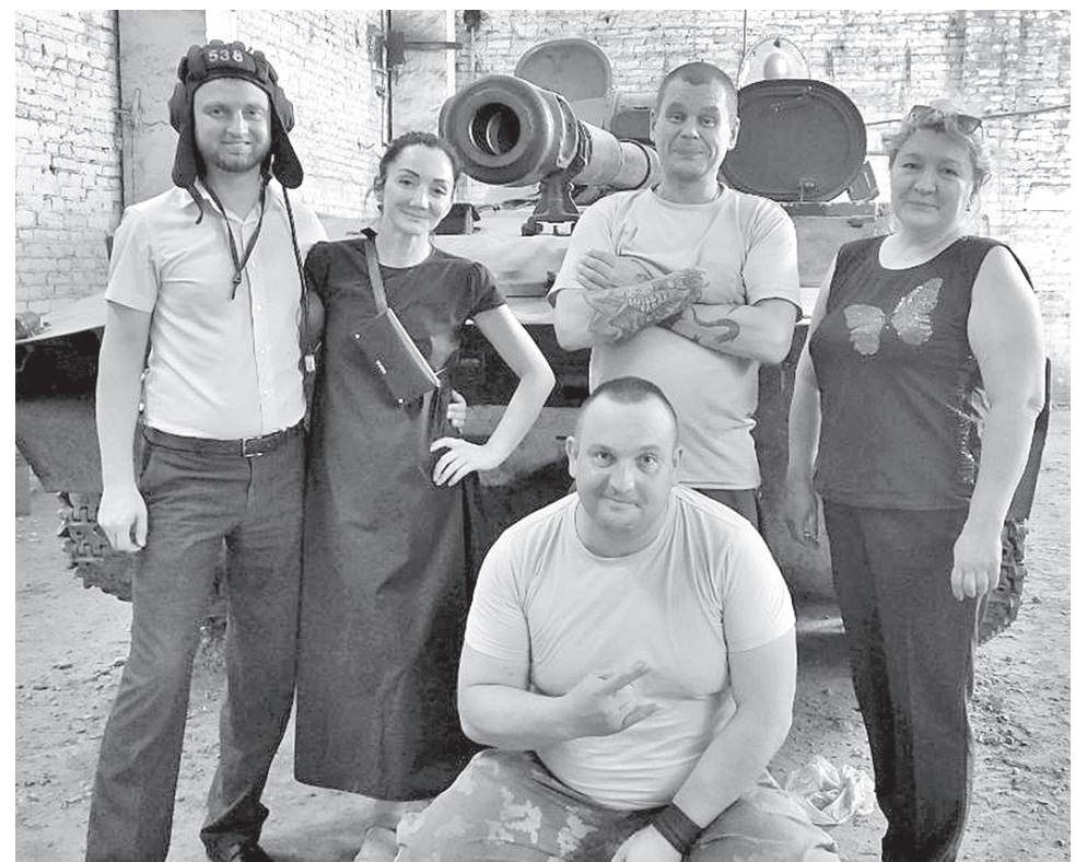
■ Военное братство медиков