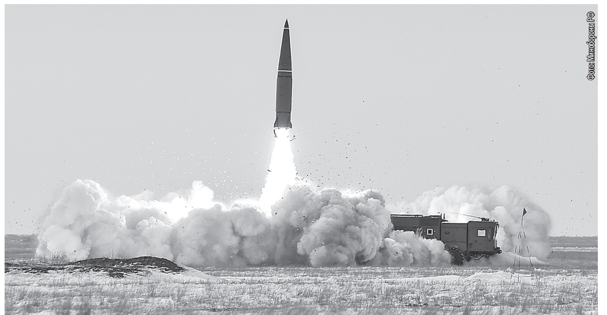
■ «Искандером» – по местам дислокации украицистов

«На одном из направлений СВО в ЛНР в ходе разведывательных мероприятий были обнаружены замаскированные позиции и скопление живой