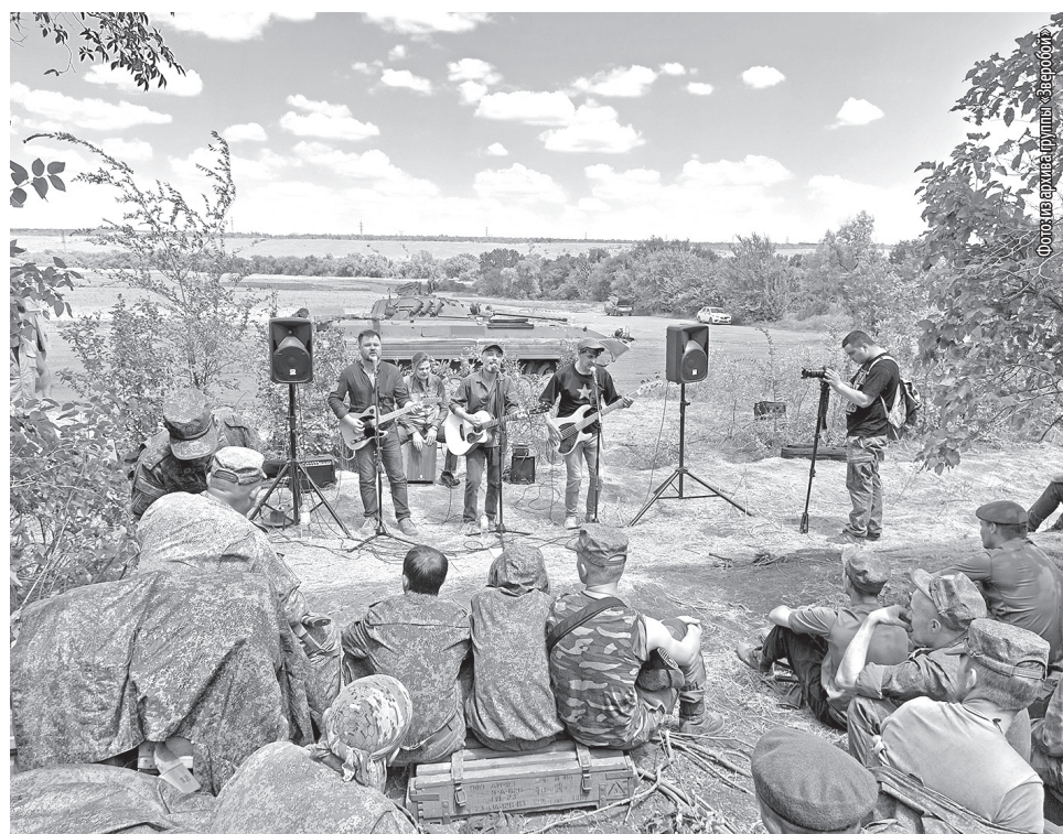
■ «Зверобой» – выступление перед бойцами СВО