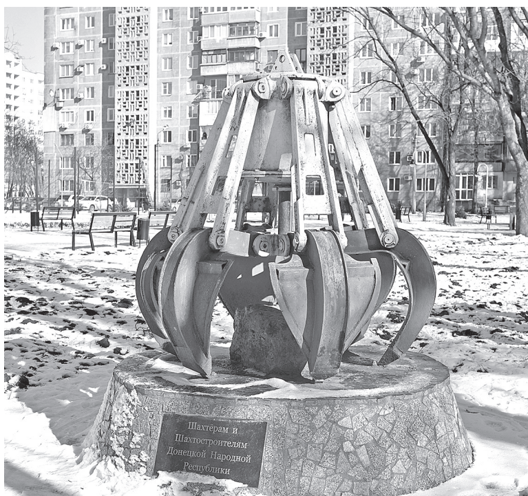
■ Стилизованный памятник «Шахтёрам и шахтостроителям ДНР»

В прошлом году Глава ДНР Денис Пушилин приезжал на стройплощадку – проверить, как движется работа: