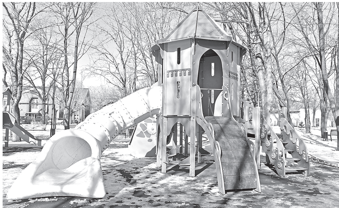
■ Атракцион ждёт весну и детский смех

«Мы очень ждали открытия обновлённого «Строителя». Сначала просили реконструировать его, затем участвовали на интернет-платформе в конкурсе и выиграли его для нашего парка. Это наша маленькая победа», –