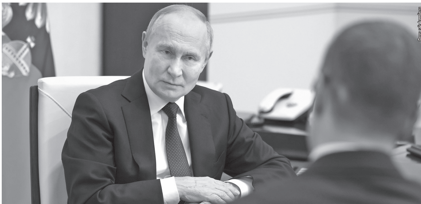
■ Президент РФ Владимир Путин во время интервью Павлу Зарубину