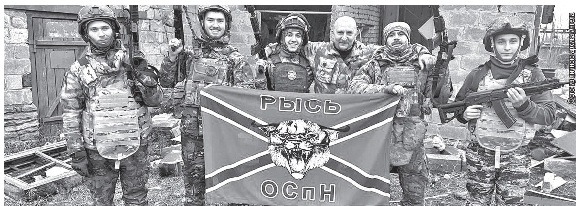
■ Разведчики «Рыси». Ангел – четвёртый слева

и противником расстояние было метров семь. И как визитную карточку оставляли рисунок маленького ангелочка с нимбом. К своим вернулись через полтора месяца, без потерь».