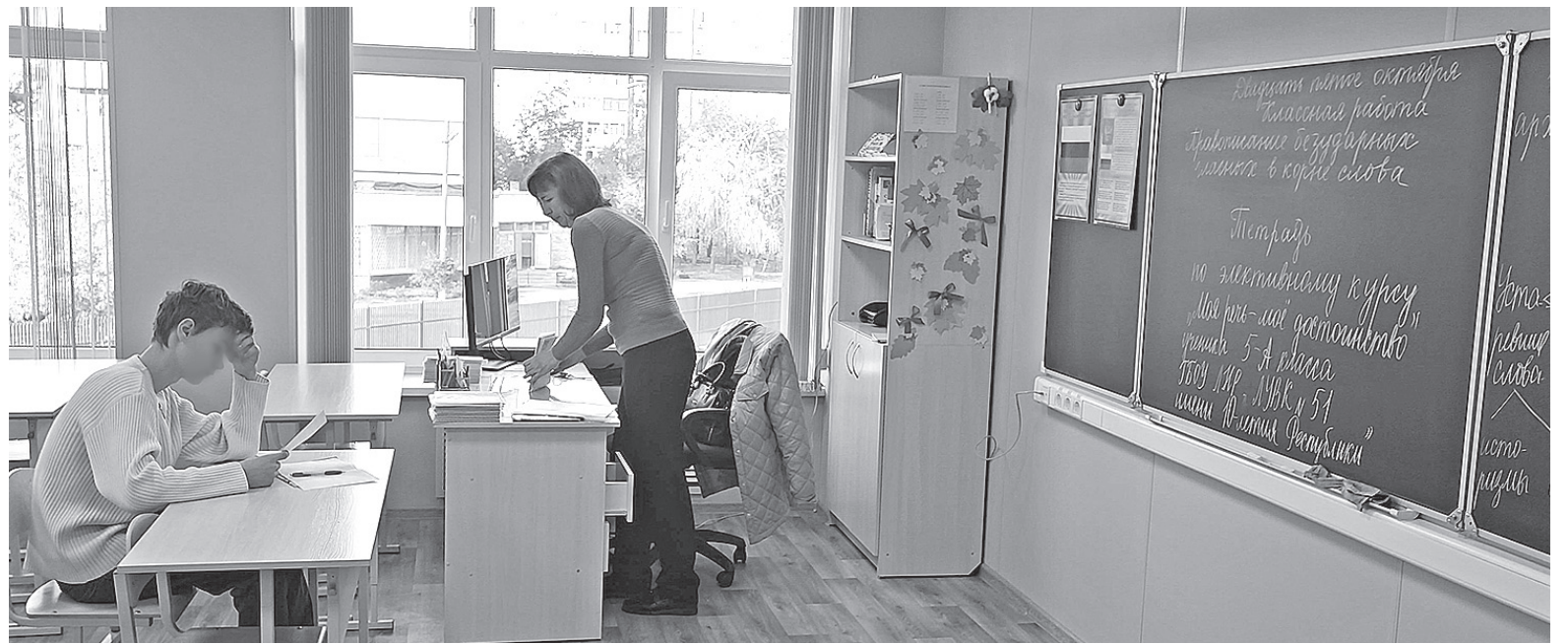
■ Школа № 51. Классная работа: «Правописание безударных гласных в корне слова»

«В прошлом году знаковым стало восстановление 51-й школы, которая получила имя 10-летия Республики. Она как раз 10 лет ждала своего восстановления, – продолжает рассказывать министр. – Здание было разрушено прямыми попаданиями украинских снарядов, а сейчас это школа с уютной территорией, спортивным ядром, современным оснащением, которое радует школьников».