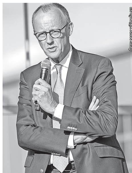
■ Что Мерц грядущий нам готовит?

Германия сейчас будет поддерживать политику Трампа. В том числе и в отношении России. А что там Мерц заявлял ранее – это, в общем-то, дело десятое.