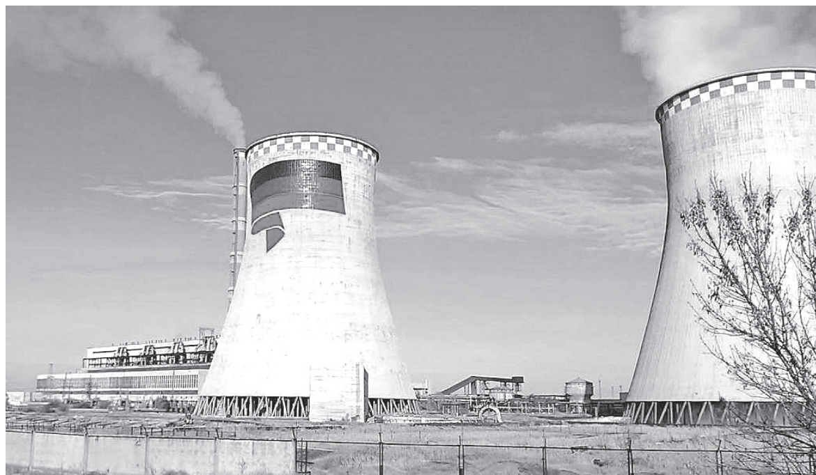
■ Знаменитая Зуевская ТЭС во всей красе