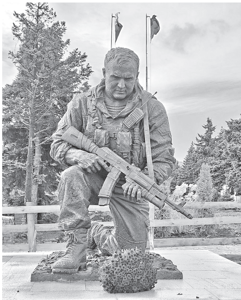
■ Памятник защитнику Саур-Могилы

Идём по главной через весь город. На выезде справа появится