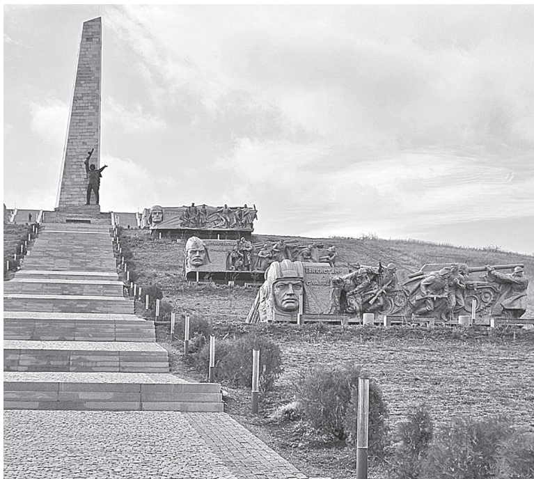
■ Саур-Могила – место силы русского духа