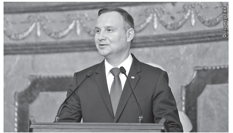
■ Дуда – витязь на распутье

мобилизовали европейских политиков, стремящихся к централизации альянса. Брюссель вдруг испугался, что без американской помощи Украина моментально проиграет войну. А сам ЕС останется беззащитным. Пять процентов на свои вооружения не тратит даже Польша, которая вооружается, как только может, после того как значительную часть своей техники и боеприпасов отдала Украине. Аналогичная ситуация наблюдается и в других западных странах.