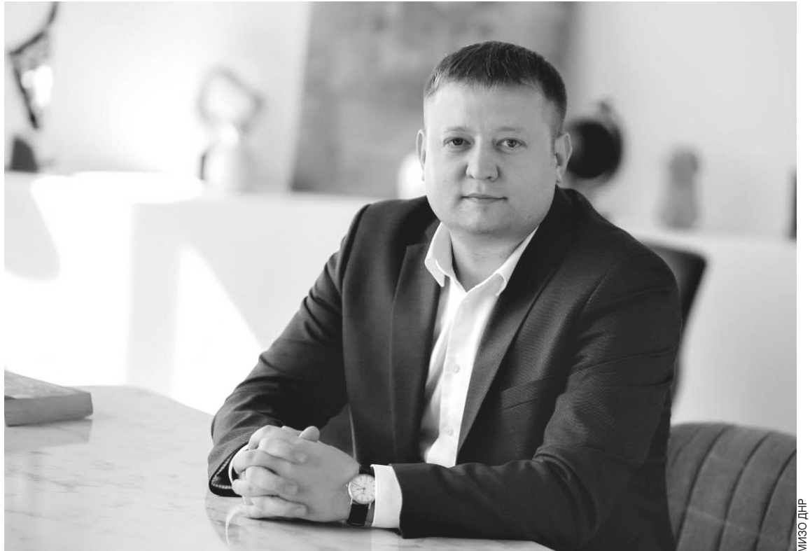
■ Александр Дудник: «Наша задача – превратить земельные ресурсы Донбасса в драйвер экономического роста»

ДОНБАССКАЯ ЗЕМЛЯ СЕЙЧАС В ОДНОМ РЯДУ С САМЫМИ ЦЕННЫМИ РЕСУРСАМИ НАШЕГО КРАЯ – УГЛЁМ И МЕТАЛЛОМ. ЭТО НЕДООЦЕНЁННЫЙ ДРАЙВЕР ВОЗРОЖДЕНИЯ ДНР. «ЗЕМЕЛЬНАЯ ЛИХОРАДКА» И РАЗГРАБЛЕНИЯ ПРИ УКРАИНЕ ЗАКОНЧИЛИСЬ, ТЕПЕРЬ КАЖДЫЙ МЕТР НА УЧЁТЕ В ЕДИНОЙ БАЗЕ. КАК СОХРАНИТЬ СВОЁ ИМУЩЕСТВО, ПРАВИЛЬНО ОФОРМИТЬ НОВОЕ И ГДЕ ЗОЛОТАЯ ЖИЛА ДЛЯ РАЗВИТИЯ БИЗНЕСА? НЮАНСЫ ПЕРЕХОДНОГО ПЕРИОДА НА РОССИЙСКОЕ ЗАКОНОДАТЕЛЬСТВО МЫ РАЗОБРАЛИ С И. О. МИНИСТРА ИМУЩЕСТВЕННЫХ И ЗЕМЕЛЬНЫХ ОТНОШЕНИЙ ДНР АЛЕКСАНДРОМ ДУДНИКОМ