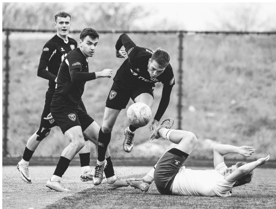
■ На пути к победе «Заря» уложила «Шахтёр» на лопатки