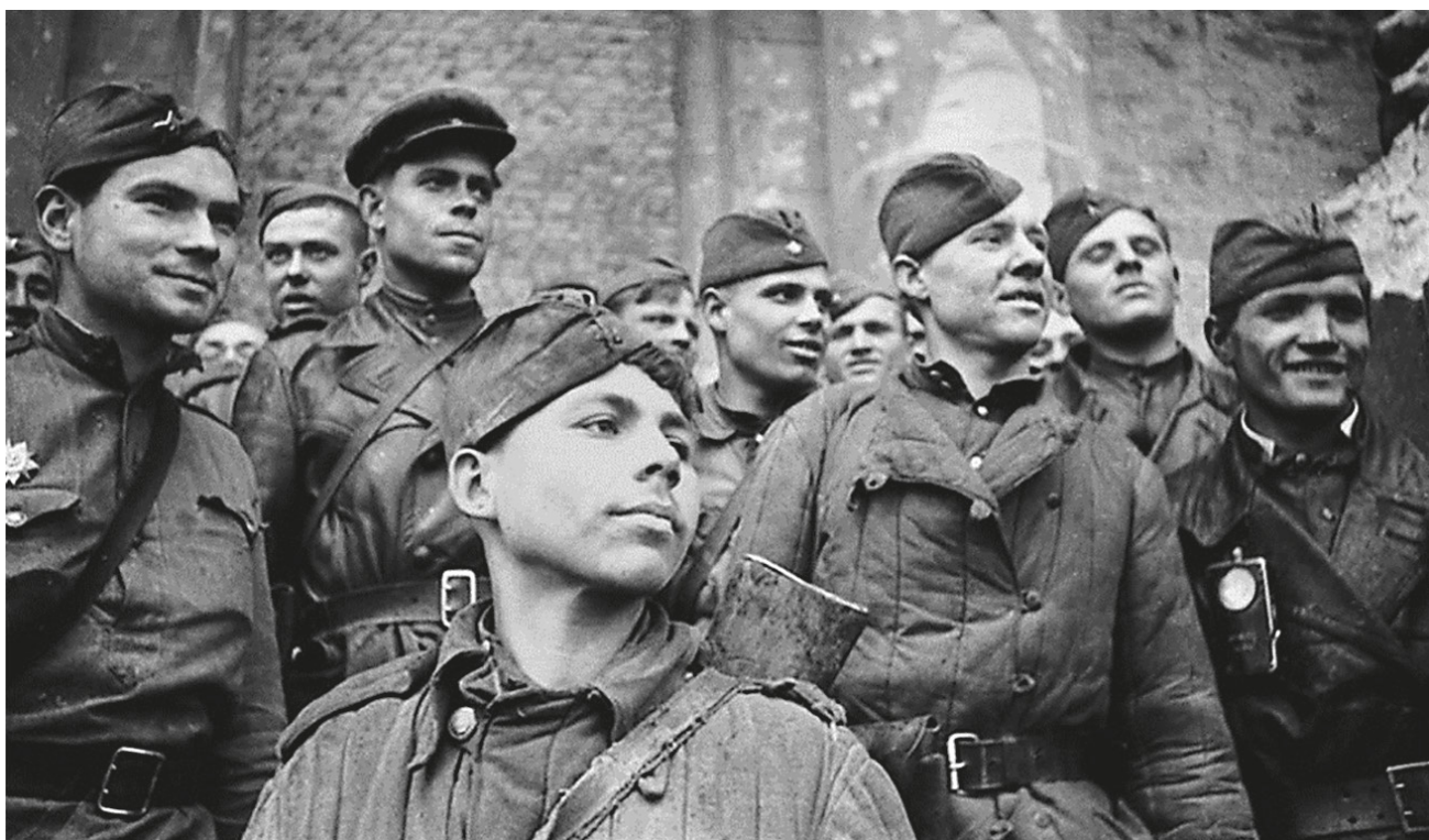
■ Май 1945 года. Герои, штурмовавшие Рейхстаг

На первом этапе Берлинской операции (16–19 апреля) самым важным было прорвать одерский рубеж обороны