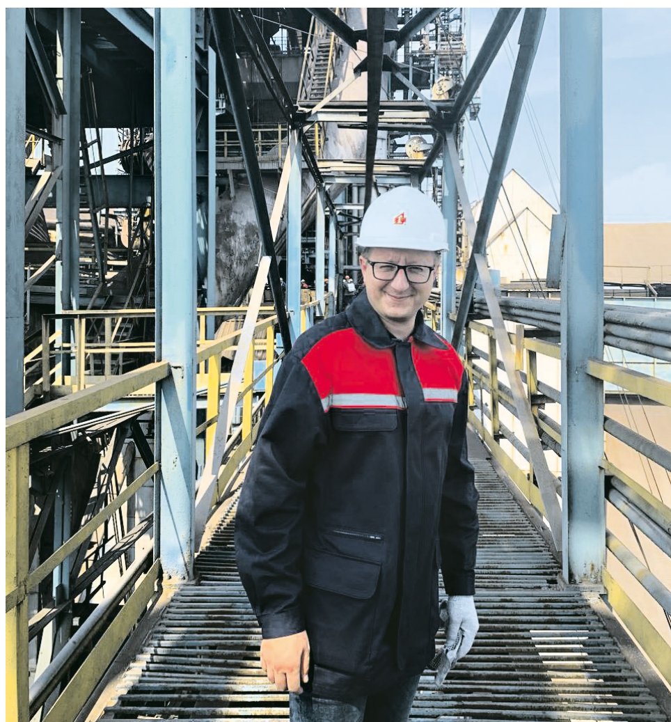
■ С визитом на Алчевском меткомбинате

– В Республике активно проводится работа по интеграции промышленных предприятий региона в экономику Российской Федерации, прежде всего, за счёт расширения кооперационных связей, в том числе в рамках межрегиональных кластеров.