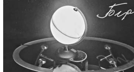
■ От фронтов Великой Отечественной до орбиты Земли – путь Берегового

«Жизнь — по-своему, тоже атака. Атака во имя поставленной перед собой цели — той единственной, самой важной, стержневой цели, которая определит твою судьбу.»