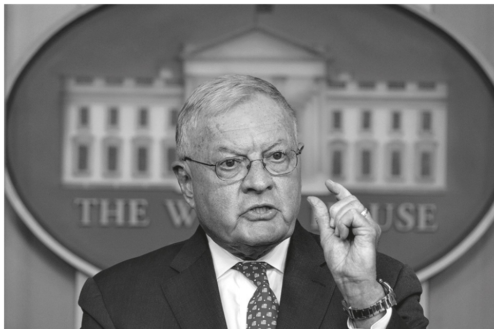
■ Кит Келлог уверяет, что его слова о разделе Украины, якобы, исказили

Непонятно одно. Какое отношение британские и французские силы имеют к Украине? Допустим, наши союзники венгры, чьи сограждане также пострадали от репрессий киевского режима в Прикарпатье (а это именно венгерские граждане, с паспортами и гражданством), могут и исторически, и логически претендовать на свои области.