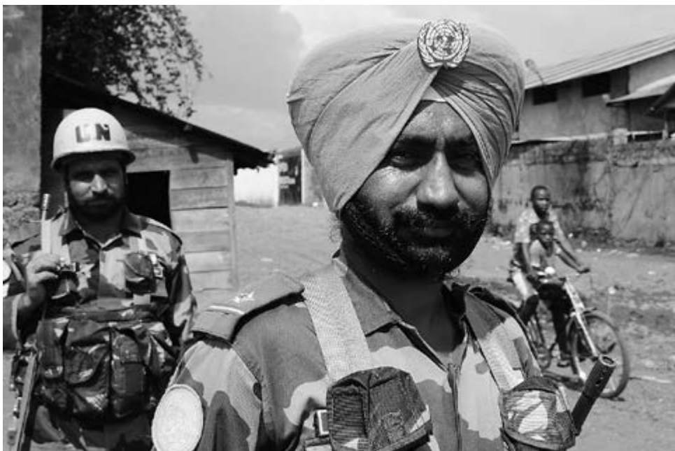
■ Несмотря на миллиардные бюджеты, такие миссии редко приносят реальный мир – лишь статус «вечных наблюдателей»

Характерный инцидент произошёл в ДРК 5 ноября 2008 года: 100 индийских миротворцев, дислоцированных в 1,5 км от деревни Киванджа, «не заметили» массовой резни, в которой погибли 150 человек.