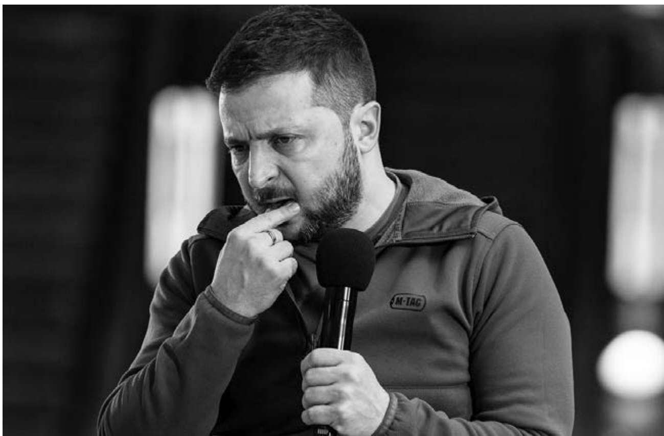
■ Зеленский в поисках поддержки, которую уже не могут или не хотят предоставлять

Меж тем встаёт другой вопрос. А сама Европа готова воевать до 2029 года? Президент США Дональд Трамп очень аккуратно бросил бывших союзников, оставив им и войну,