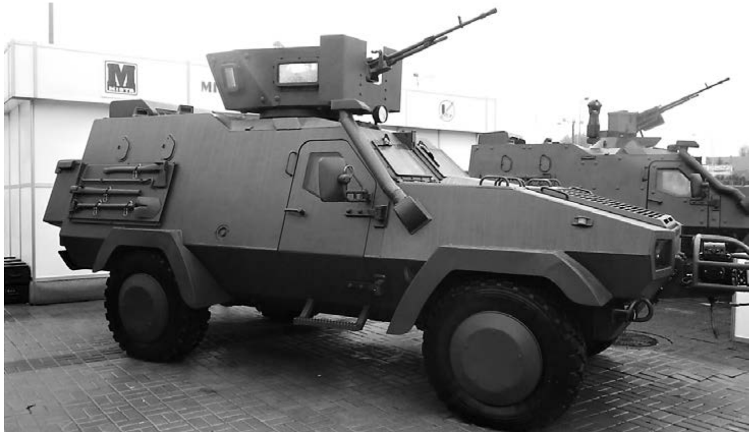
■ Бойцы армии России впервые заполучили в качестве трофея польский БТР Oncilla

Так, в Сумской и Харьковской областях противник объявил воздушную тревогу. По данным источника Telegram-канала «Осведомитель», наша авиация на Украине работает активно, а авиабомбы летят точно по целям.