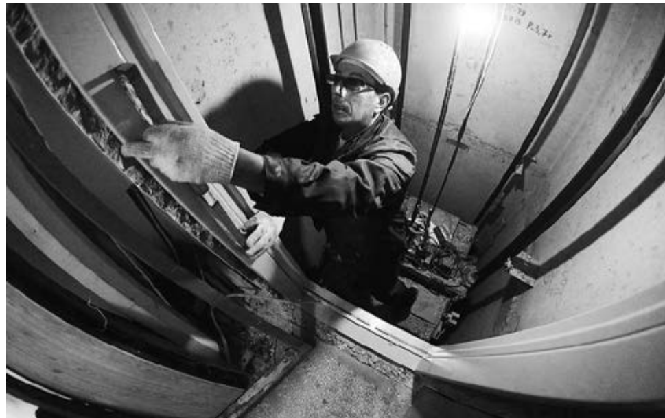
■ Новые «механические сердца» для домов

– Для пенсионеров, семей с детьми, инвалидов остановка или вообще от-