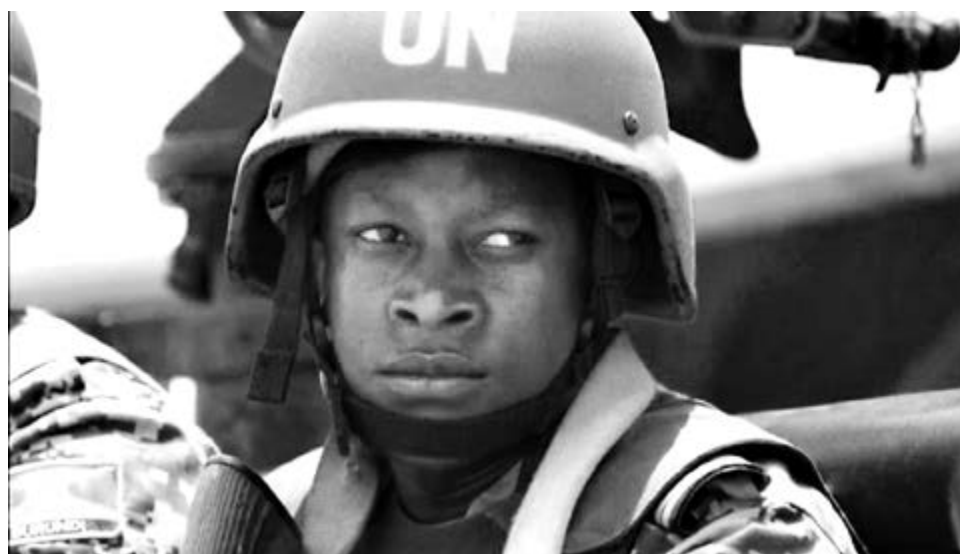
■ «Голубые каски» в Африке: дорогостоящие миссии ООН часто заканчиваются провалами

И тут, кстати, нельзя не вспомнить и миротворческую миссию НАТО, например, в сербском крае Косово, которая находится под протекторатом ООН. Первоначально миротворческая миссия была