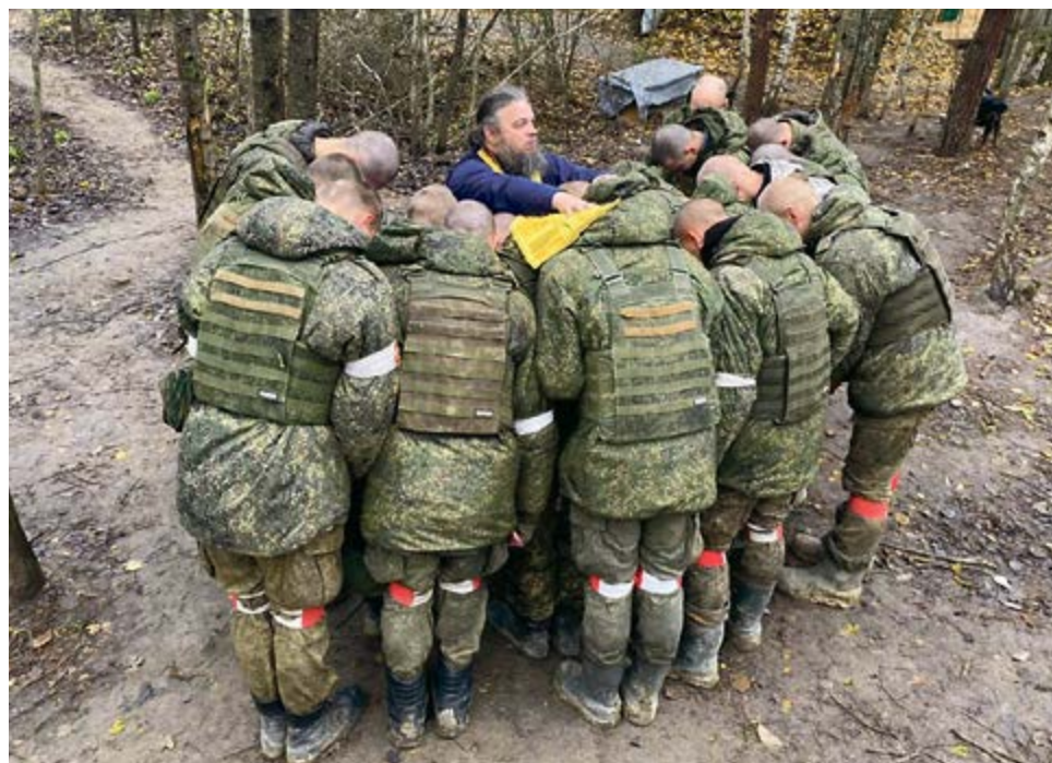
■ Благословение перед боем

После этого парень всерьёз задумался и понял, что «на войне атеистов не бывает», и ему пора что-то с этим делать. Но где взять попа на линии фронта, где, кроме военных, нет людей от слова совсем? Через два дня его направили на другую позицию на дежурство, а там смотрит – батюшка причащает ребят. Он даже не сказал своему сержанту, что куда-то уходит, только сразу побежал ко всем, чтобы священник не успел никуда уехать.