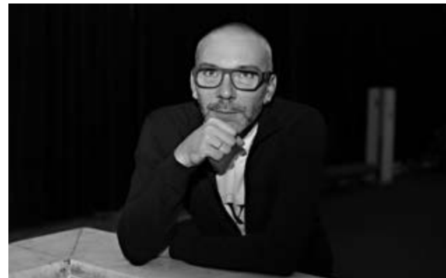
Страница Маслия ВК

Первым спектаклем, вызвавшим бурю эмоций у зрителей, стал балет «Ромео и Джульетта. Лаборатория любви», где история юных влюблённых была перенесена в далёкое будущее. Монтекки и Капулетти стали враждующими кланами, разделёнными по половому признаку – женщины против мужчин. А Джульетта – образцом идеального человека, рождённого из «пробирки». И всё это сделано со вкусом так, что не вызвало отторжения.