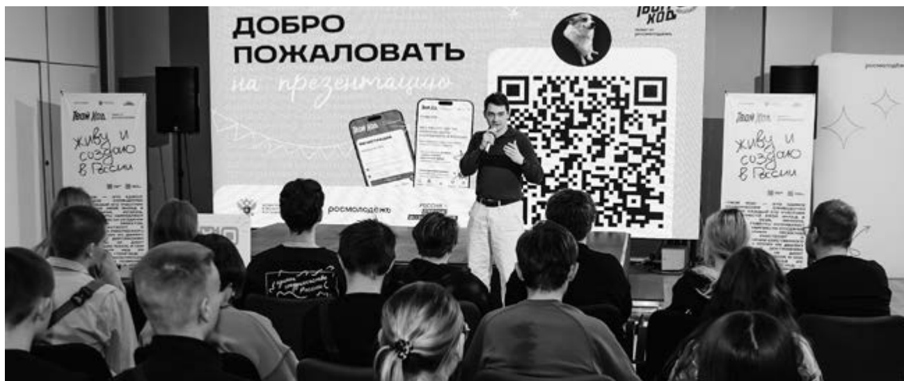
■ Для ребят проводят массу образовательных мероприятий