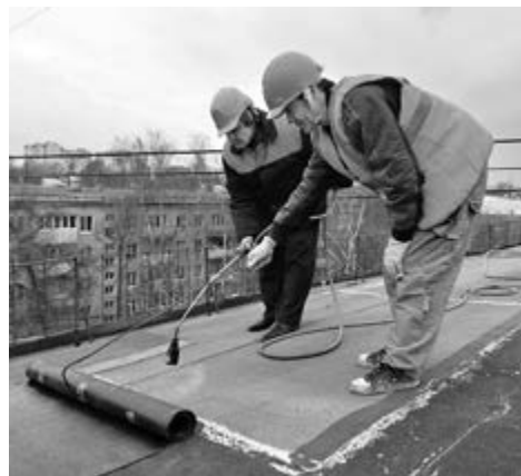
■ Капремонт кровель – защита от дождя и холода

– Объекты выбирали местные администрации. Учитывали год постройки, фактическое количество проживающих, техническое состояние систем и конструктивных элементов, общую площадь и этажность,