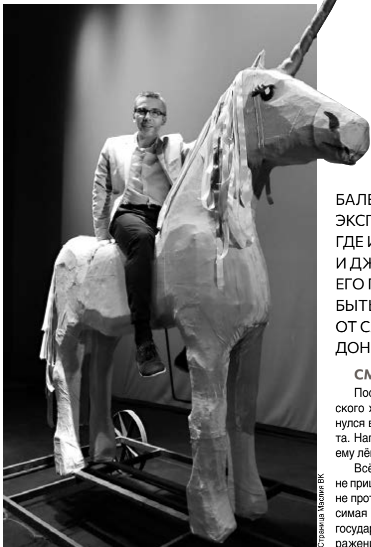
Страница Маслия ВК

■ Реквизит к спектаклю нужно проверить лично