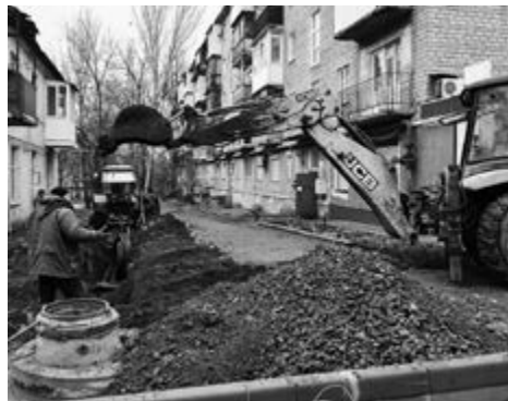
■ Обновлённые инженерные сети – шаг к комфортной городской среде

«Новые лифты абсолютно бесшумные, с плавным пуском и остановкой. Этажи озвучиваются, есть звуковые сигналы и даже мелодии. А для безопасности людей установлен фотобарьер по всей высоте двери, который не даст зацелить человека или предмет, если они находятся между двумя створками», – отмечает один из специалистов фирмы.