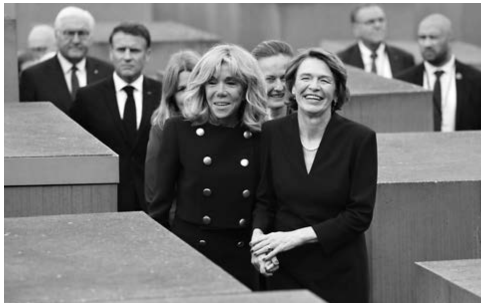
■ Первые леди Франции и ФРГ Брижит Макрон и Эльке Бюденбендер смеялись во время посещения мемориала памяти жертвам Холокоста в Берлине в 2024 году

«Я считаю бессмысленным отменять приглашение или не пускать кого-то, то есть высшего представителя какой-либо страны... Нечаева почтить память своих соотечественников. Это же не цель дипломатии. Сегодня для нас должно быть важнее всего почтить память погибших... И это – напоминание, тихое почтение памяти, и не только военнослужащих, погибли ведь и мирные жители.