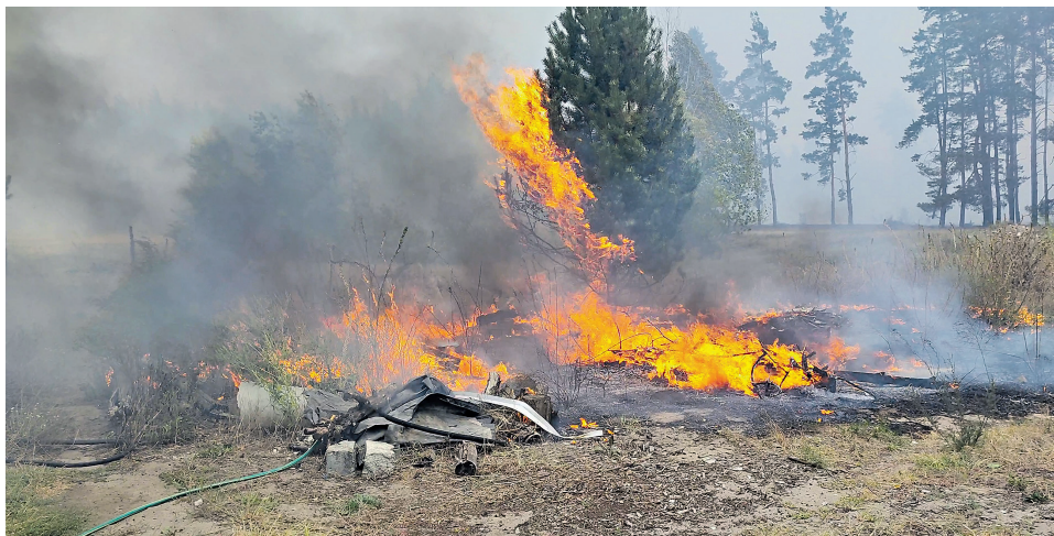
В ЛНР в 2025 году при переходе огня на частные домовладения уничтожено 283 здания и сооружения, ещё 235 получили повреждения

Я тоже помню тот август. Чёрный дым накрыл Луганск, хотя расстояние до очага пожара было не менее 40 километров. Ситуация выходила из-под контроля, и на помощь спасателям пришли коллеги из разных регионов России. Огонь был покорён, но сколько бед он натворил.