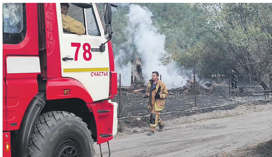
Подготовка к пожароопасному сезону начинается заранее: расчистка территорий, доступ к воде и постоянный контроль позволяют сдерживать распространение огня

ет распространению огня». Непотушенный окурок, брошенный в сухую траву, намеренный пал на огороде – этого было достаточно, чтобы за несколько минут пламя охватило гектары земли. Но был и второй, более страшный фактор: леса и поля поджигали намеренно.