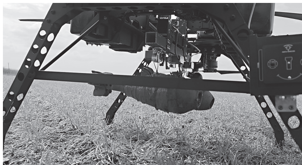
Российский гексакоптер «Кран» может переносить сразу две 82-мм мины. Радиус поражения каждой до 50 метров (на фото – тренировочный муляж)

лу. Это избавляет наших бойцов от необходимости использовать уязвимые и легко пеленгуемые системы вроде американского «Старлинк».