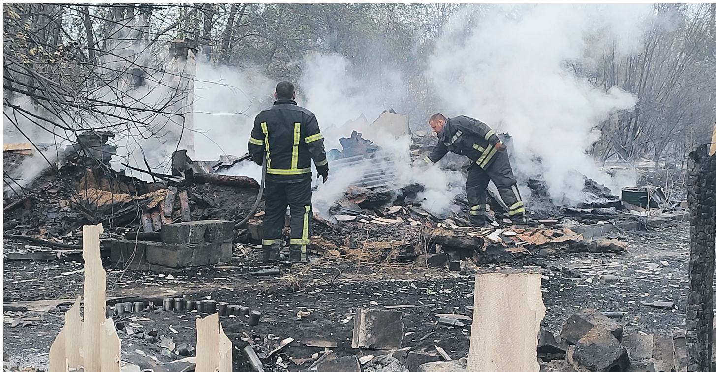
В прошлом году сотрудники МВД и МЧС составили около 300 протоколов из-за нарушений противопожарных правил в частном секторе