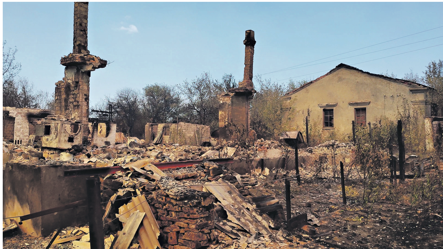
Цена одной искры: от домов остаются лишь печные трубы и груды пепла

В ту осень почти две недели полыхала вся республика. Горели даже те районы, в которых пожары такого масштаба не фиксировались много лет. Главными причинами чрезвычайной ситуации называли две. Первая – человеческая небрежность. В МЧС констатировали: «Пожар всегда начинается с чьей-то халатности. Погодные условия – это только фактор, который способствует