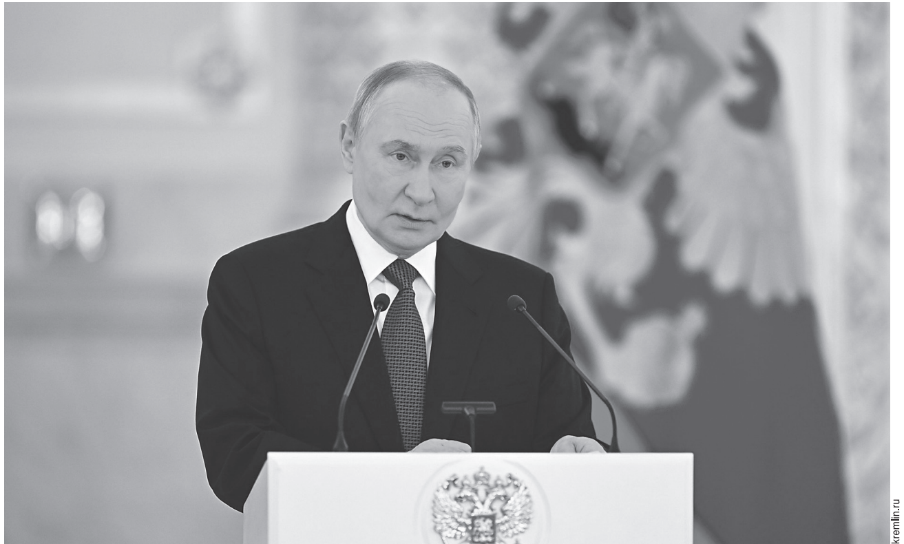
Владимир Путин подчеркнул стратегическое значение развития Арктики для России

Сейчас через СМП идут самые разные грузы от красок до деталей станков и оленьих рогов или косметики из водорослей. Одним из основных поставщиков косметики, леса и химической продукции является Архангельская область. Объём несырьевого экспорта которой в 2025 году составил 149 млрд долл. Через регион проходит экспорт одной только агарной продукции в 160 стран мира. Не только по морю, но и через сухопутные транспортные коридоры, которые связывают Северный морской путь с глобальной транспортной евразийской системой.