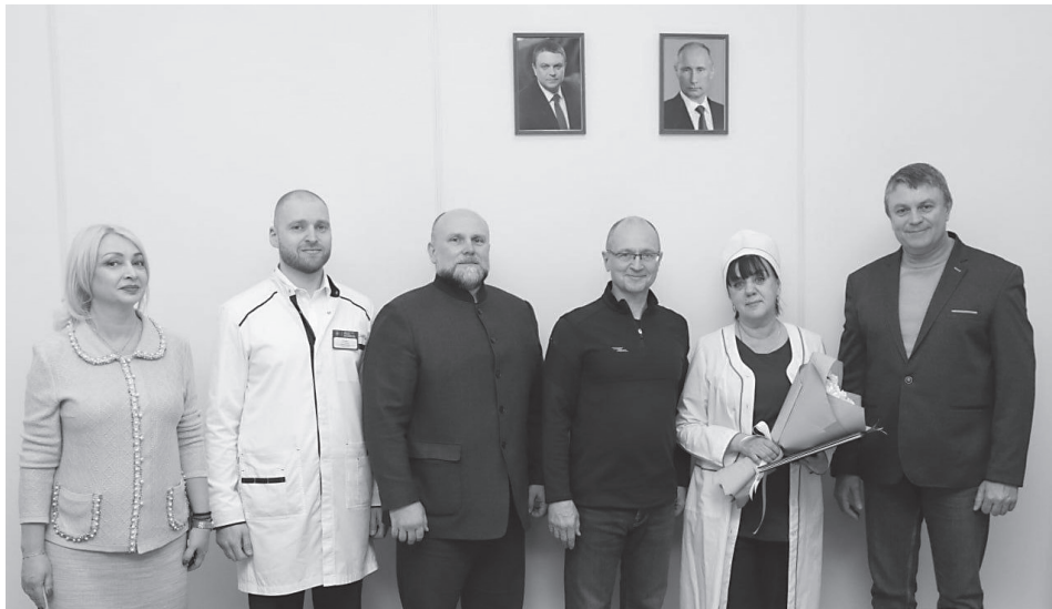
На открытие обновлённой больницы приехали первый заместитель руководителя Администрации президента Сергей Кириенко и глава ЛНР Леонид Пасечник