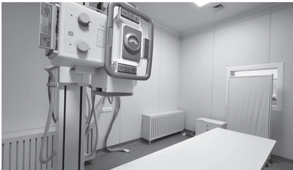
После реконструкции больница получила современное оборудование, позволяющее проводить диагностику и лечение на новом уровне