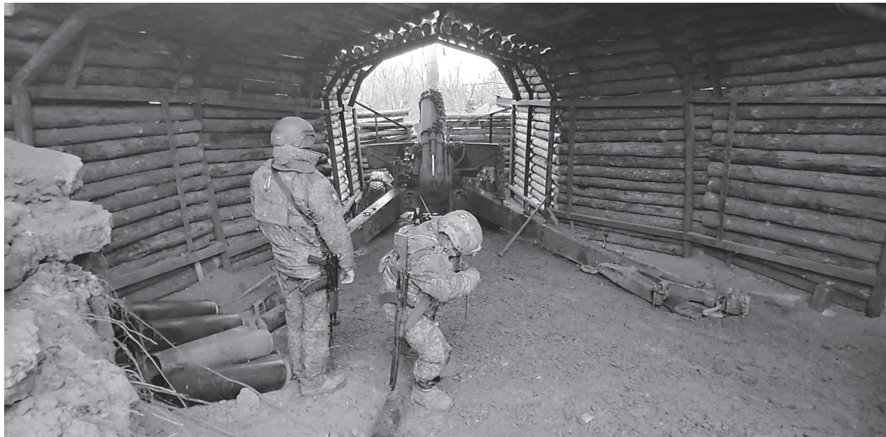
Один выстрел из артиллерийского орудия «Гиацинт-Б» способен полностью уничтожить даже хорошо укрепленное укрытие боевиков ВСУ

«Любые разговоры о том, что это оружие будет использоваться только для „обороны“ или на-