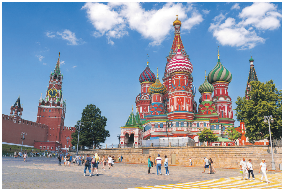
Собор Василия Блаженного и Спасская башня Кремля – самый узнаваемый вид Красной площади

С противоположной стороны площади – строгий и монументальный Московский Кремль. Его стены и башни – это уже не просто архитектура, а символ российской государственности. Особое внимание привлекает Спасская башня