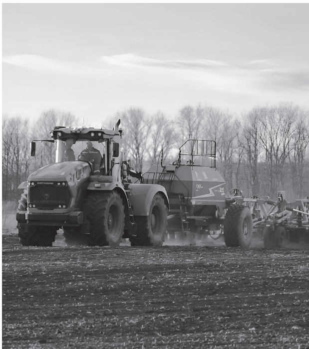
На полевые работы выйдет около пяти тысяч единиц сельхозтехники. Обновлённый автопарк готов на 92 %

«Размер господдержки региона в этом году заметно вырос – почти на 200 миллионов больше прошлогоднего. На прямые субсидии направлено около 900 миллионов, ещё свыше 500 – на развитие сельских территорий. Расширены и лизинговые программы: работает и федеральный механизм, и наша республиканская лизинговая компания, которой выделено финансирование для передачи техники малому агробизнесу. Плюс предприятия активнее пользуются кредитами – мы подтверждаем заявки перед банками, и уже есть первые одобренные проекты, в том числе для перерабатывающей промышленности», – отмечает глава Минсельхоза ДНР Артём Крамаренко.