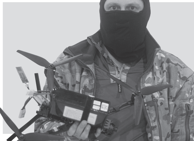
Именно беспилотники сегодня во многом меняют ход боя и помогают спасать жизни

Оперативники улыбаются глазами из-за балаклав, скрывающих лица. Но каждый посетитель узнаёт, что