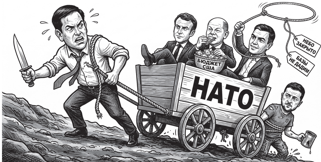
Вашингтон намекает Европе, что эпоха бесплатного американского покровительства подходит к концу

В современной политике так сложилось, что не принято нападать без повода, похищать