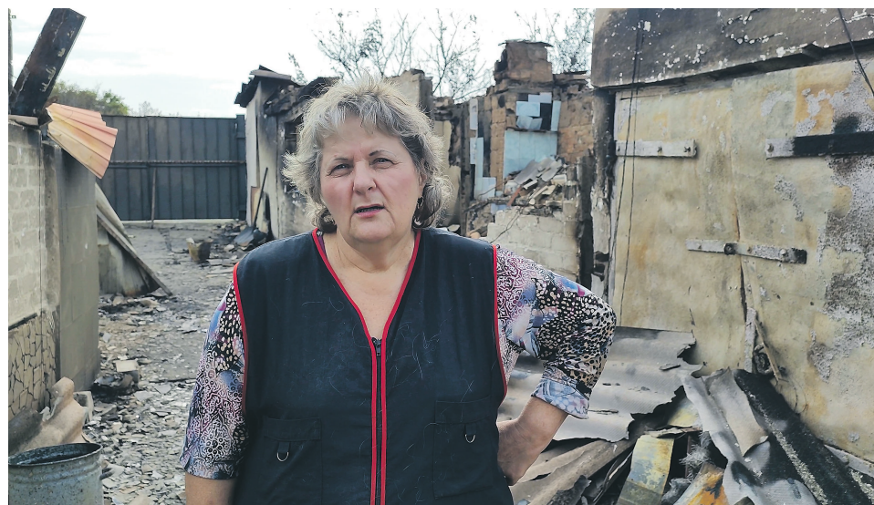
Спасаясь от огня, жители пострадавших посёлков успевали взять из домов только самое необходимое

Мы привыкли к тому, что режимы и запреты часто воспринимаются как формальность. Но здесь логика железная: легче запретить сжигать прошлогоднюю траву в апреле, чем тушить десятки домов в мае. В диалоге со спасателем всплывает самый больной вопрос