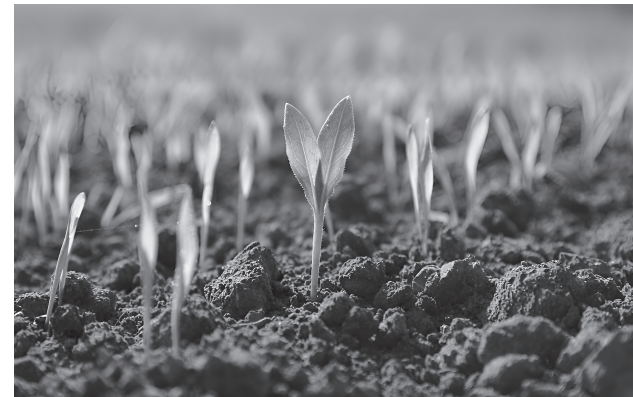
От качества весенней посевной и сроков напрямую зависит будущий урожай и продовольственная безопасность республики

Также республика перестраивает подход к аграрному образованию, делая ставку на практическую подготовку и преемственность знаний. Участие в федеральном проекте по созданию агроклассов уже приносит результат: