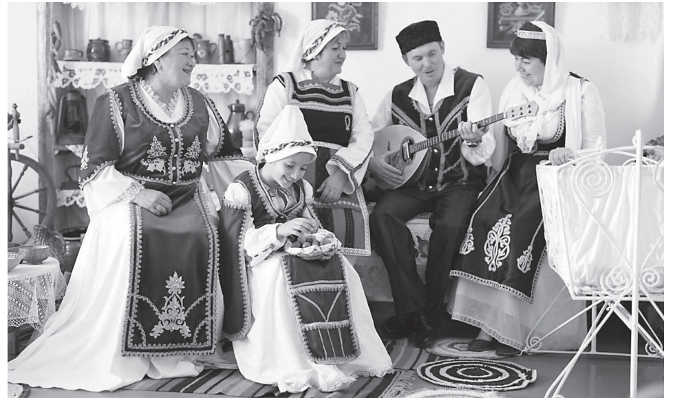
Греки Приазовья из поколения в поколение передают свою культуру: сохраняют язык, традиционные наряды и обычаи

В той войне греки поддержали Россию, сформировав из выходцев