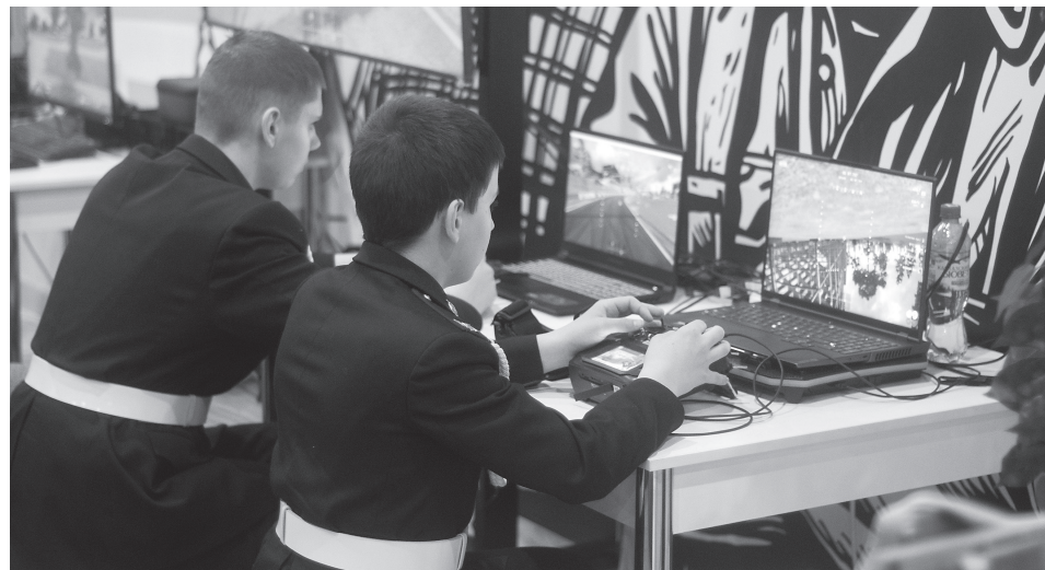
На площадке молодёжь осваивала управление БПЛА на тренажёрах

«Молодёжь у нас – самая уязвимая часть населения, и преступники постоянно пытаются посредством наших детей, наших молодых людей совершать какие-либо преступные посяательства. Таким образом, мы должны предостеречь детей. В принципе, молодёжь у нас бдительная и так, но с нашей сто-