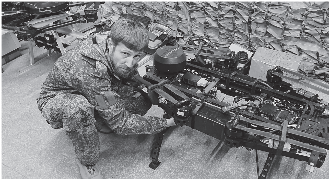
Боец 4-й бригады проверяет отечественный тяжёлый гексакоптер – новейшую разработку из Москвы, превосходящую украинскую «Бабу Ягу»

Грузоподъемность московского гексакоптера – внушительные 10–12 килограммов, а дальность полёта в боевых условиях достигает 13, а в некоторых случаях – при установке усиленных батарей – и 18 километров. Управление – по защищённому цифровому радиоканалу.