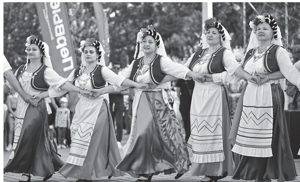
К престольным дням в греческих сёлах устраивают праздник Панаир с народными гуляниями, танцами и борьбой куреш

полуострова восемь добровольческих батальонов. После победы над турками и подписания Кючук-Кайнарджийского мира в 1774 году Екатерина II предложила грекам переселение и переход под защиту России с землёй и льготами. Позже императрица пожаловала им грамоту: по десять десятин земли, осво-