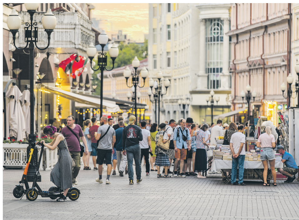
Арбат тянется от площади Арбатские Ворота до Смоленской площади – между Пречистенкой и Новым Арбатом

на них – и слышишь: здесь и Пушкин хаживал, и Цветаева дышала этим же воздухом, и московские артисты, и купцы, и простой люд, чьи имена и не записаны в книги, а намертво вросли в эту землю.