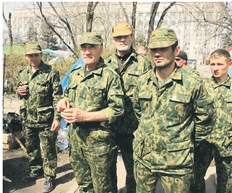
Весной 2014 года республику в Луганске поднимали не кадровые военные, а обычные мужики с площади

Невозможно осознать тот масштаб ужаса, в котором оказался Луганск в июле–августе 14-го, не прожив это лично. Город был взят в кольцо. Сорок два дня жесточайшей блокады. Без света, без воды, под непрерывными ударами артиллерии и авиации. Украинские танки уже заходили в посадки пе-