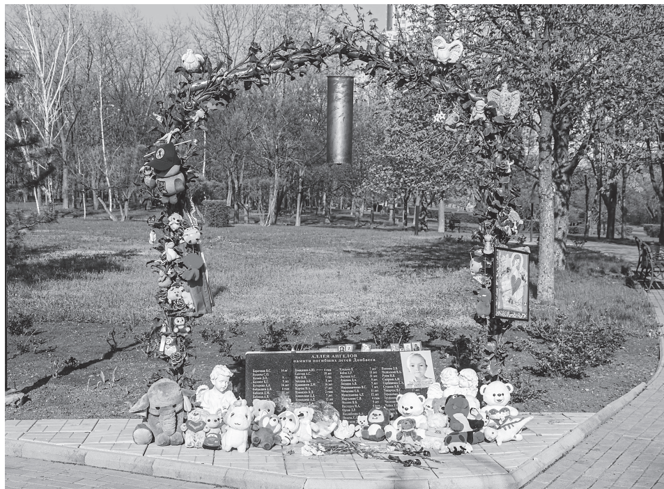
Аллею ангелов в Донецке открыли в 2015 году в память о детях Донбасса, погибших с 2014 года от рук укронацистов

Вызвать скорую невозможно. Истекающие кровью женщины сидят во дворе рядом с телом мёртвой шестилетней девочки и просто ждут. Лишь минут через пять на звук разрыва примчались военные, подхватили их и повезли в областную больницу.