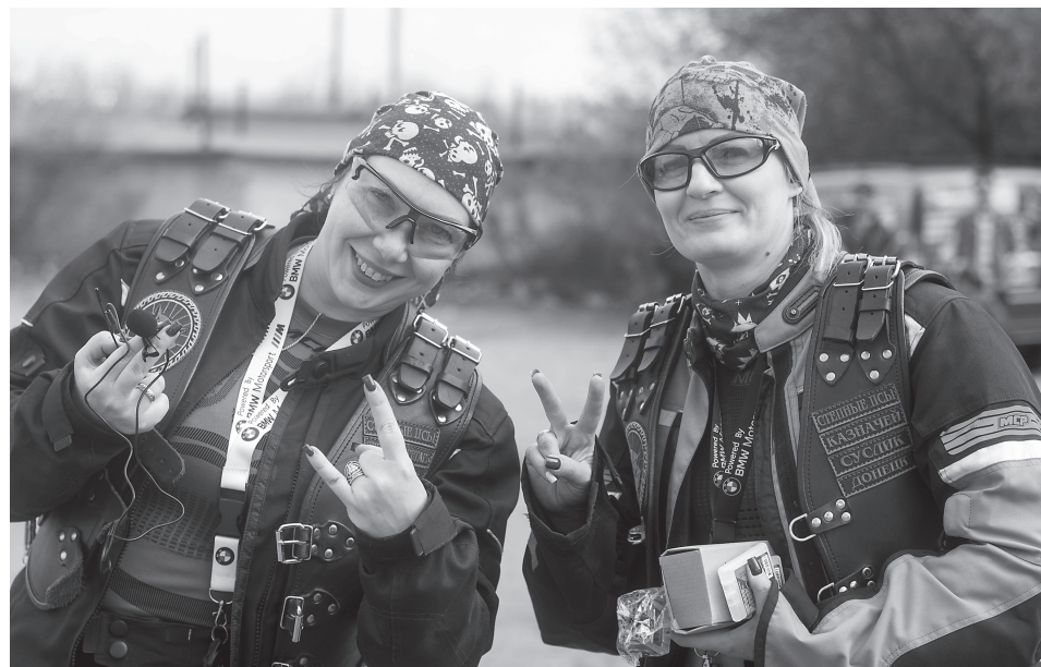
В американском кино байкеры – бандиты с оружием. В реальном Донбассе они угощают виноградным соком, пирожками и везут Вечный огонь на Саур-Могилу

«Когда меня посадили за руль, я поняла: я могу, это моя мечта. Потом как-то всё отошло на второй план. <Были важнее> семья, первый ребёнок, другие, совсем повседневные заботы. А когда родился второй сын, муж вспомнил о моей мечте и подарил мне тот мотоцикл, который сейчас у меня есть».