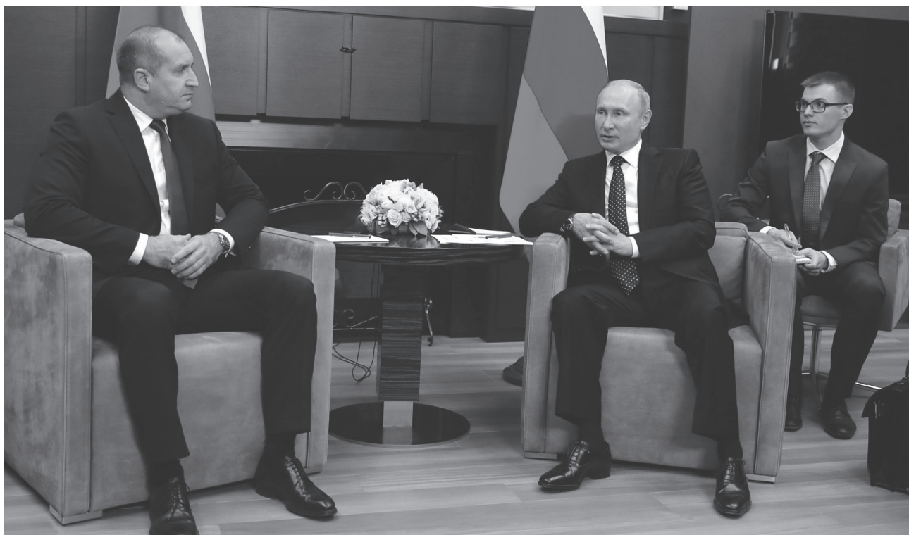
На встрече с президентом Владимиром Путиным в 2018 году Румен Радев выступил за возобновление диалога между Россией и Болгарией

Если этот конфликт разразится, то надежда Киева на вооружённую и экономическую помощь