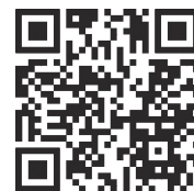
Канал МФЦ ДНР в МАХ

Подписывайтесь уже сегодня, чтобы быть в курсе последних изменений, оперативно получать достоверную информацию и экономить время на поиске необходимых сведений.