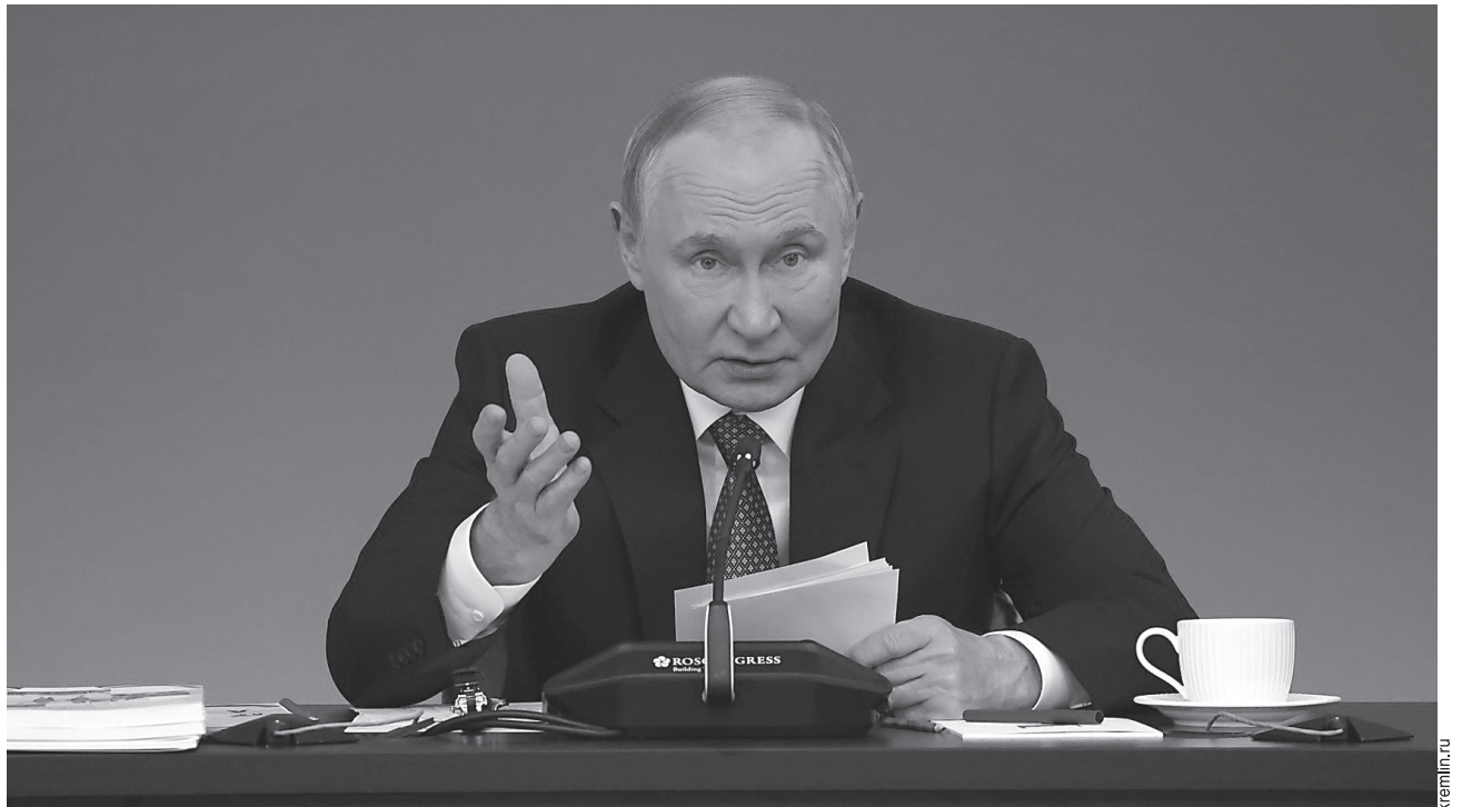
Владимир Путин ранее предупреждал: поставки оружия Киеву пересекают «красные» и даже «бордовые линии»

В этой связи весьма красноречиво высказался зампред Совета Безопасности России Дмитрий Медведев: