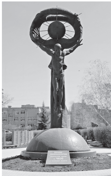
Мемориал ликвидаторам ЧАЭС в Луганске открыт 26 апреля 2001 года. Авторы – скульптор Е. Ф. Чумак и архитектор Н. А. Монастырская

духе радиоактивного стронция очень много. А вот если они летают или сидят на деревьях – значит, можно снять респиратор и немного подышать».