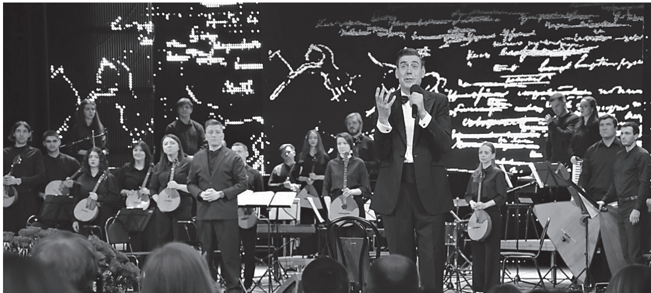
Заслуженный артист России в одиночку смог воплотить на сцене всех героев «Евгения Онегина» и самого автора – Пушкина. Зал аплодировал стоя

«Первые 10 месяцев мы занимались только произведением: разбирали, о ком писал Александр Сергеевич, что стоит за каждой фразой, каково значение слова. Пушкин – гений, а значит, он прост и лёгок, как все гении, и одновременно непостижим. Он удивительно строит фразы так, что смысл раскрывается постепенно».