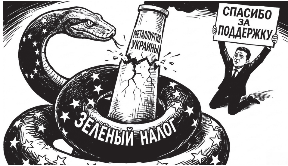
Политика ЕС оборачивается потерями для украинской промышленности и экономики

Украина может недополучить до 1,75 миллиарда долларов экспортной выручки от металлургии в ближайшие пять лет – промышленники бьют тревогу, эксперты уже говорят о 4,8 % падения ВВП только в 2026-м. Но! Это не случайность и не ошибка. Европа сознательно добивает украинскую промышленность «зелёным» налогом СВМ, откладывая Киеву в отсрочке даже в условиях вооружённого конфликта. Очевидно, что Брюссель отводит Украине лишь роль военного плацдарма и поставщика пушечного мяса. Почему Евросоюз цинично уничтожает последние остатки украинской металлургии – в материале «ДК».