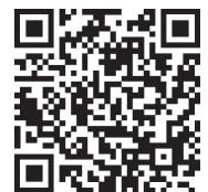
Чат-бот МФЦ ДНР

МАХ – ЭТО НЕ ПРОСТО МЕССЕНДЖЕР, А СОВРЕМЕННЫЙ ИНСТРУМЕНТ ДЛЯ ЭФФЕКТИВНОГО И БЕЗОПАСНОГО ВЗАИМОДЕЙСТВИЯ!