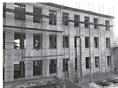
Почти 20 лет эта часть дворца пустовала и разрушалась

В конце восьмидесятых финансирование дворца стало уменьшаться: СССР переживал не лучшие