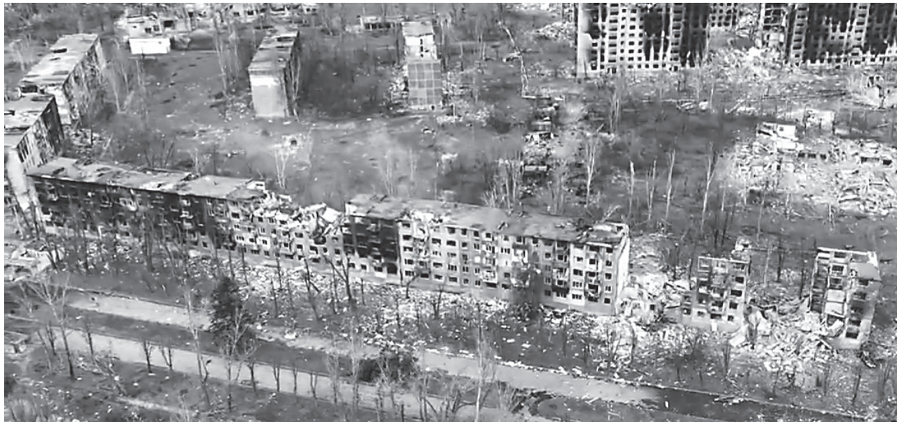
Разведка с воздуха стала основным инструментом наблюдения в городской застройке

Значение для ВС РФ: взятие Константиновки взламывает южный фланг последней мощной линии обороны ВСУ в Донбассе. Это прямой выход на Дружковку и Краматорск. Падение этого узла станет фатальным ударом по обеспечению неонацистов на всём направлении.