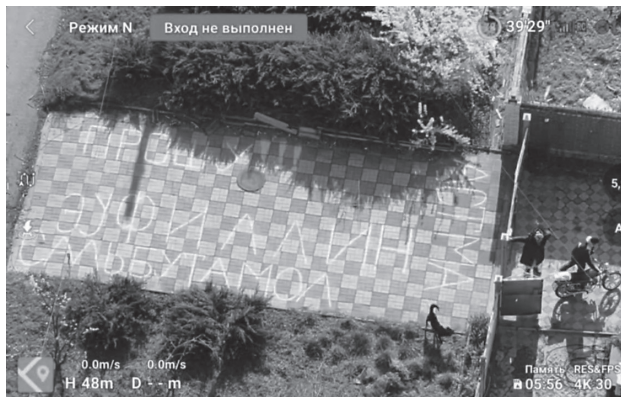
В Константиновке местные жители написали на плитке просьбу о лекарствах, чтобы её заметили с дрона

Подразделение разведки третьего армейского корпуса. Всё та же Константиновка. Во время очередного облёта территории оператор замечает у одного из частных домов надпись мелом «Прошу! Эуфилин, сальбутамол. Астма». Рядом – пожилая пара. Местные жители, которые отчаянно нуждаются в медицинской помощи. От своих «захисников» они её явно не получили.