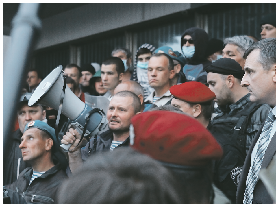
На площади у бывшего здания СБУ луганчане весной 2014 года требовали прекратить преследование «Беркута» и не трогать русский язык