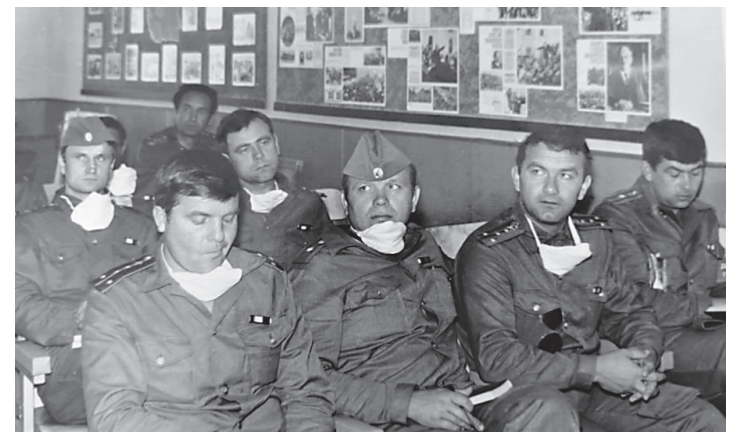
Ликвидаторы аварии на ЧАЭС перед выездом в зону, где им предстояло работать в условиях радиационного заражения