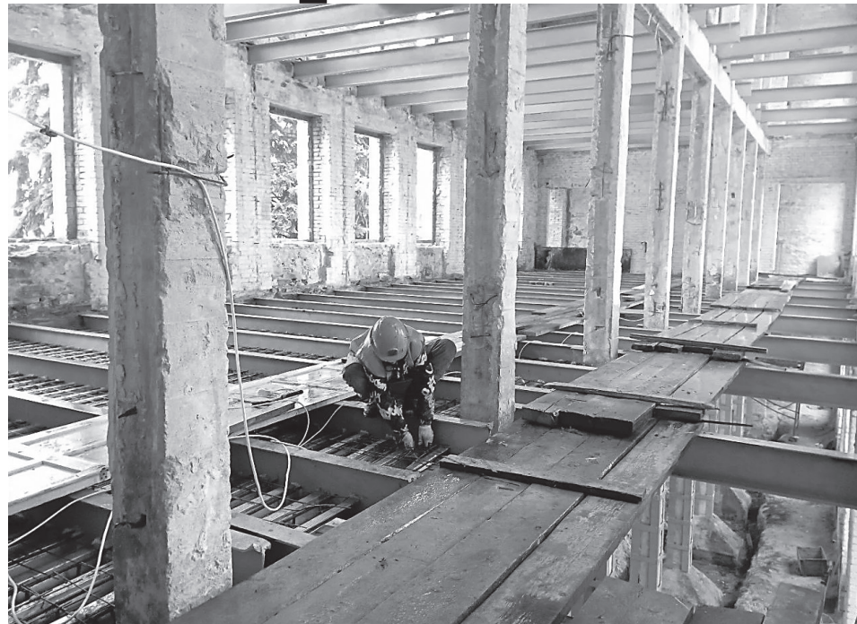
В клубной части ДК Ленина сейчас усиливают колонны и заливают межэтажные перекрытия

Дворец повидал многое. Во время Великой Отечественной