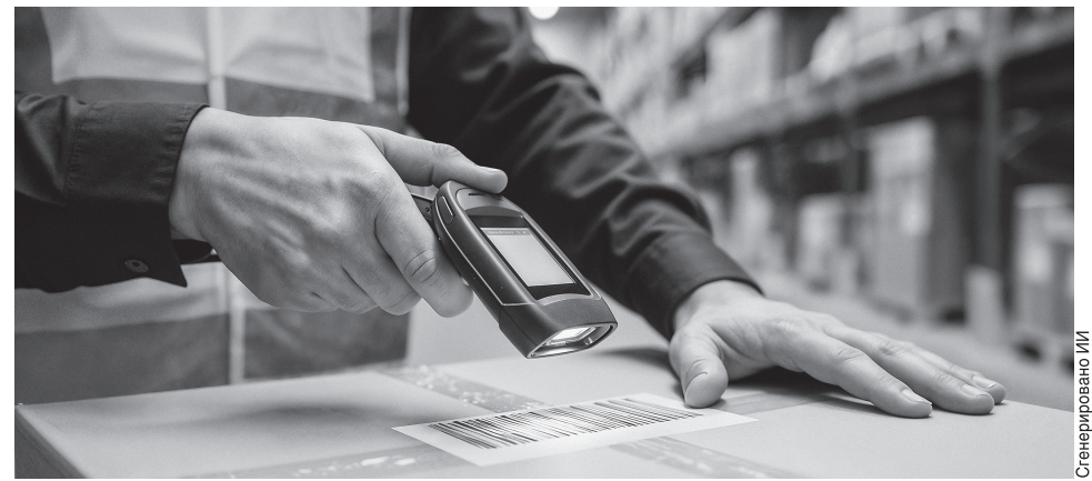
Система «Честный знак» помогает отслеживать путь товара от производителя до покупателя и защищает рынок от контрафакта

При этом разрешение на строительство для хозяйственных построек обычно не требуется, но в каждом случае есть нюансы, поэтому перед оформлением лучше уточнить порядок в местной администрации или у специалистов (ч. 17 ст. 51 Градостроительного кодекса РФ).