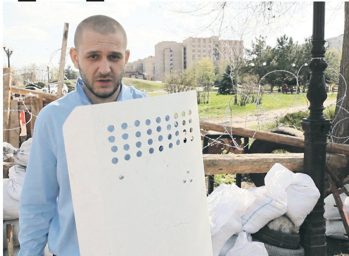
В Луганск военкор «ДК» приехал 12 апреля 2014 года журналистом в командировку, ещё не зная, что совсем скоро почувствует себя частью этой земли

жейки СБУ не ради грабежа, а ради того, чтобы их дома не пришли жечь радикалы „Правого сектора“*.