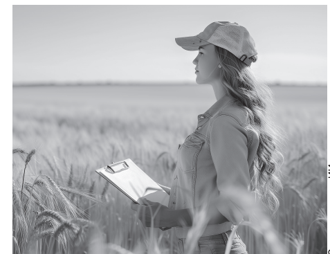
Фермеры ДНР смогут вернуть часть расходов на ремонт агроклассов и привлечение молодых специалистов

Также скорректированы требования к документам. Для получения субсидии теперь нужно подтвердить реализацию молока