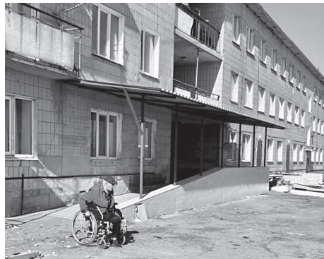
После ремонта в доме-интернате в Антраците станет комфортнее и безопаснее для более чем 250 его жителей

Ход ремонта проверила министр труда и социальной политики ЛНР Елена Макаренко. После завершения интернат должен стать