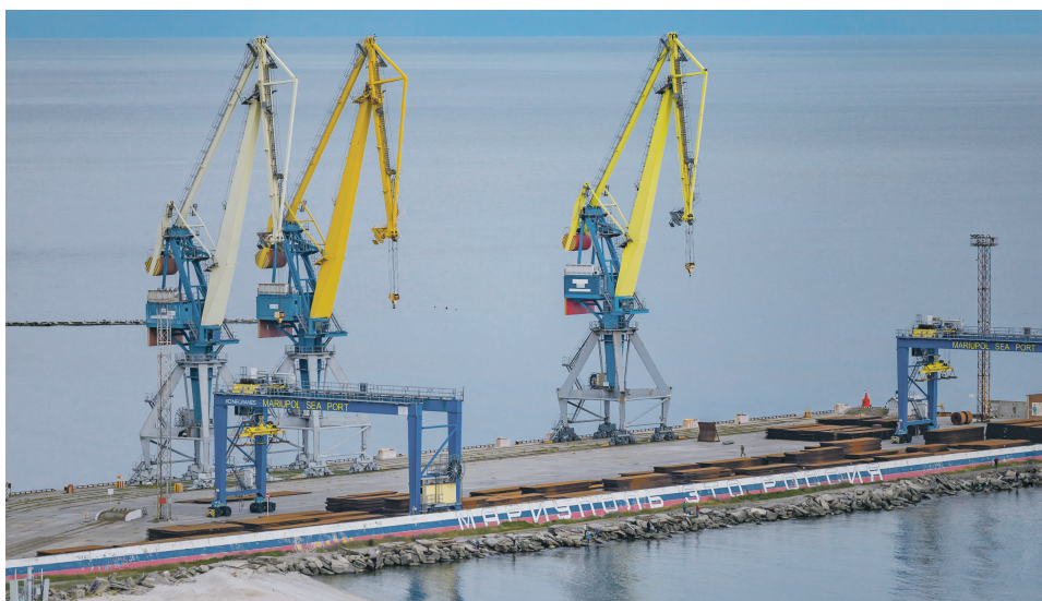
Экспорт зерна из ДНР через порт Мариуполя вырос почти на 80 % за прошлый год