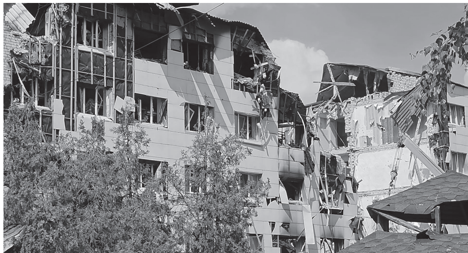
ВСУ били по общежитию в Старобельске в момент, когда дети выбегали из здания, заявила уполномоченная по правам человека в РФ Яна Лантратова