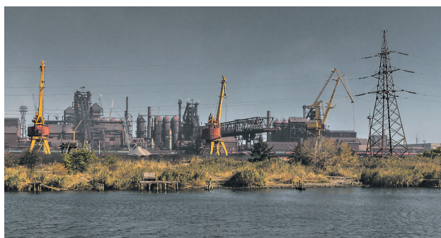
На месте «Азовстали» планируют создать постиндустриальный кластер с производствами, деловыми центрами и туристической инфраструктурой

цен на новостройки. По данным на конец 2025 года, за год цена за 1 кв. метр нового жилья в городе увеличилась со 100–110 тыс. рублей до 170–200 тыс. рублей. Общий объём жилищного строительства в ДНР составляет более 270 тыс. кв. м, при этом в одном Мариуполе реализуется более 40 проектов на 6 тыс. квартир в новостройках. Планы развития города основаны на программе строительства нового жилья общей площадью 6 млн кв. м.