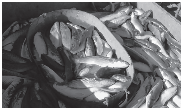
Пеленгас считается одной из самых перспективных рыб Азова – у него плотное белое мясо, минимум костей и высокий спрос у переработчиков

нескольких видов остаётся стабильной. А «Бычки в томате» – это классика, не теряющая спроса.