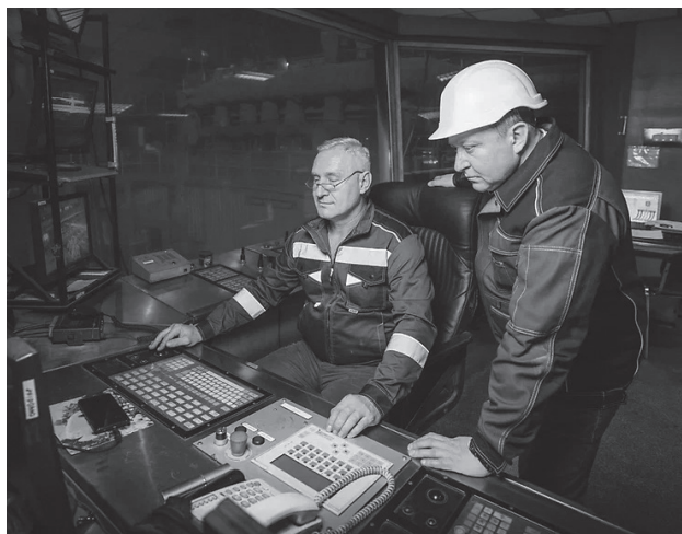
Люди, которые держат жар: именно квалифицированные руки превращают инвестиции в металл и реальную прибыль

ших заводов. За три года только капитальные вложения компании в восстановление инфраструктуры, закупку и модернизацию оборудования достигли 12,5 млрд рублей. Всего на стабилизацию технологических процессов, погашение долгов по зарплате и расчёты с поставщиками направлено более 34 млрд рублей.