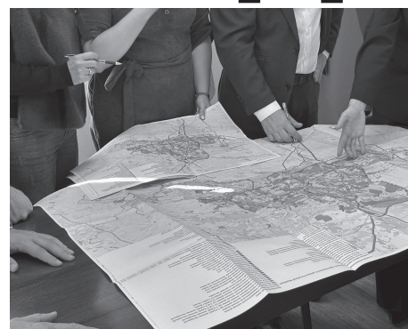
Институт также работает над планом развития Донецкого Приазовья с охватом всех 124 километров береговой линии

автомобильного моста через реки Мокрые Ялы и Кашлагач, формируя агропромышленный кластер.