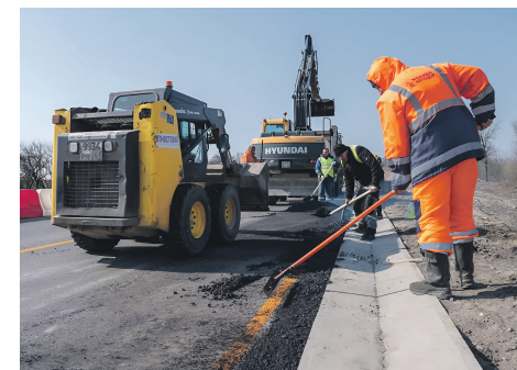
Строительство Азовского кольца меняет логистику региона и открывает путь к курортам новых регионов

Азовское кольцо станет основой транспортного и экономического роста всего макрорегиона. На участке Ростов – Мариуполь дорога уже расширена до четырёх полос, продолжается строительство 31-километрового обхода Мариуполя, а также расширение 32-километрового отрезка до границы Запорожской области, после чего приступят к участку дороги в направлении курортного Бердянска. По оценкам специалистов, после начала полноценной работы Азовского кольца туристический поток в Крым и воссоединённые регионы увеличится на 35–40 %.