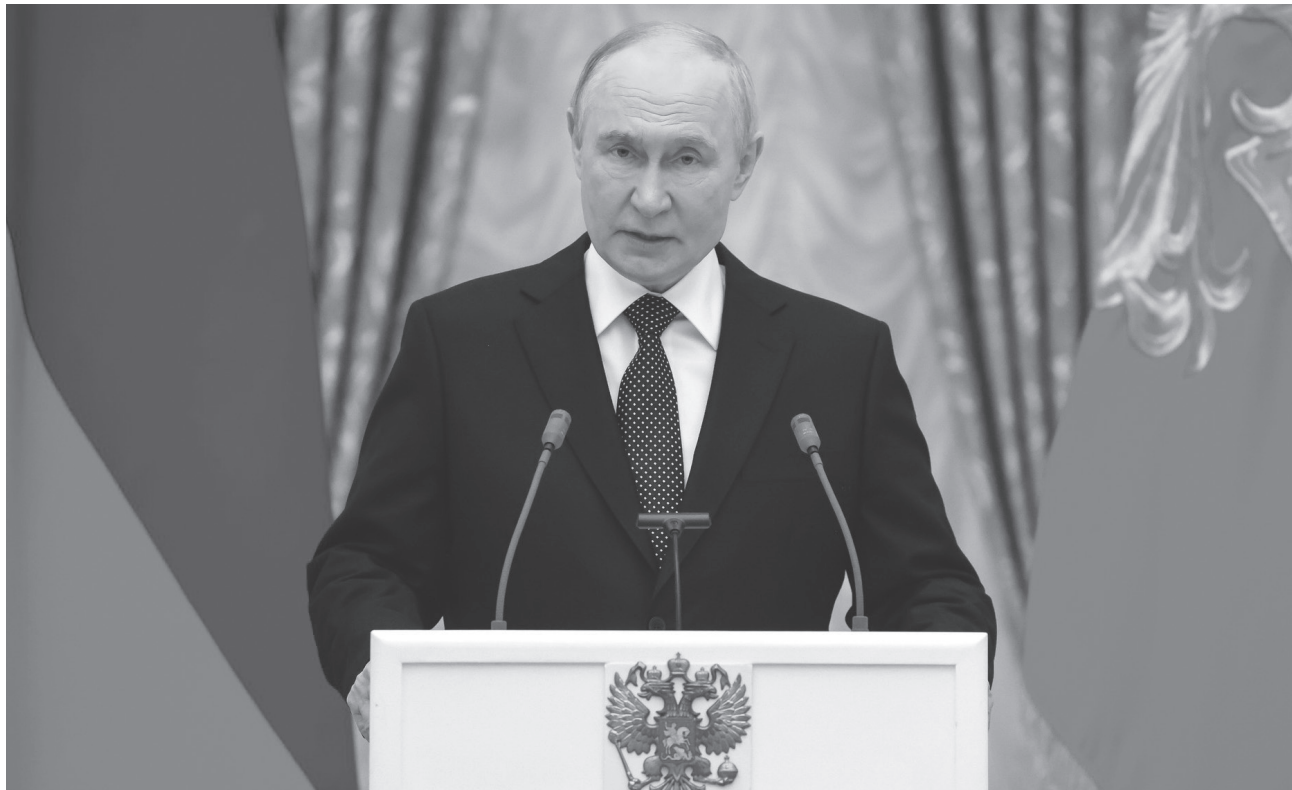
Президент Владимир Путин обозначил главный принцип ПМЭФ-2026: открытость к сотрудничеству при жёсткой защите экономического суверенитета России

При этом в послании Владимира Путина нет упоминаний западных государств и альянсов,