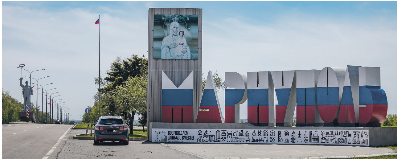
Новые жилые кварталы Мариуполя строят одновременно с восстановлением дорог, коммунальных сетей и общественных пространств

Мариуполь стал лидером новых регионов как по объёмам возводимого жилья, так и по динамике