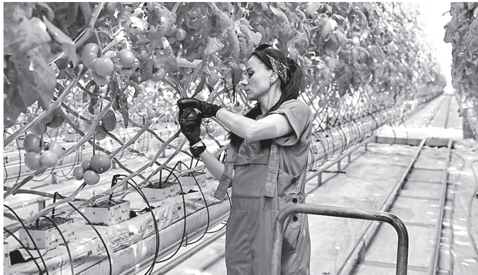
Один из крупных инвестиционных проектов – расширение тепличного хозяйства для круглогодичного выращивания овощей

«Сегодня более 67 % территории нашего региона – это земли сельхозназначения. Вместе с тем часть земель до сих пор остаётся в „серой зоне“ из-за наличия взры-