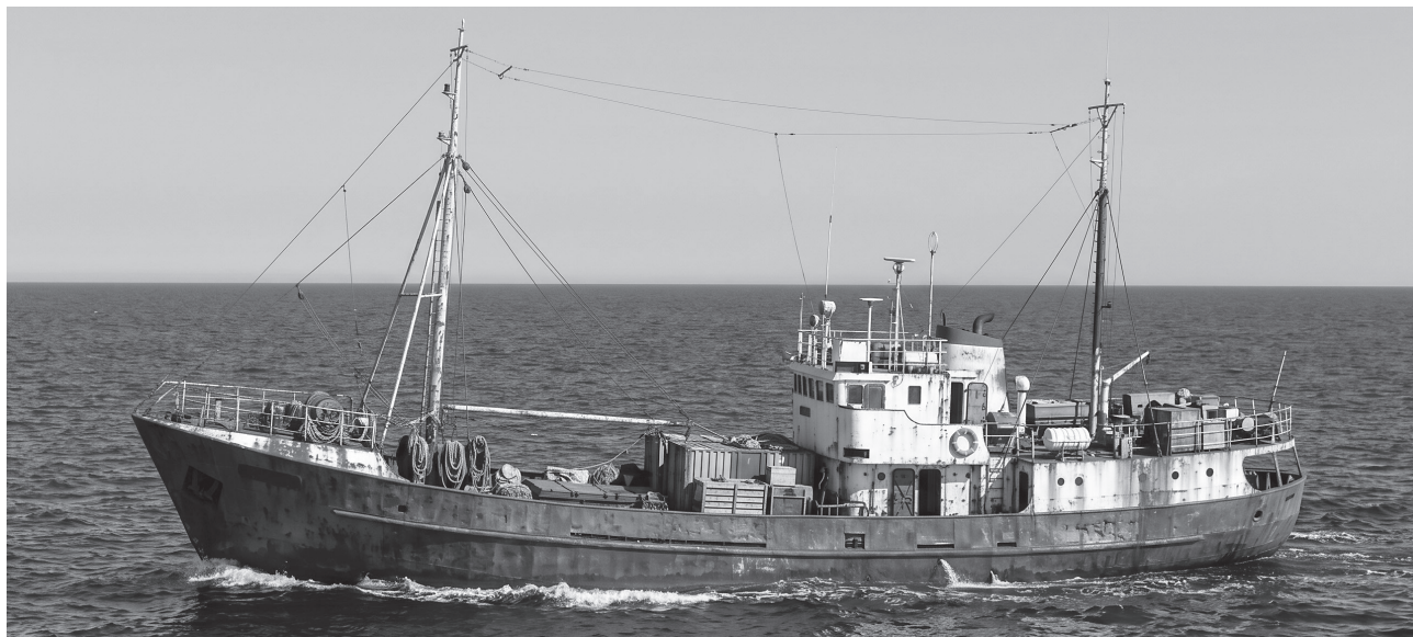
Рыболовецкий флот ДНР нуждается в обновлении – основу промысла сегодня составляют маломерные суда и траулеры

В Китае, Японии, Кореи и странах Юго-Восточной Азии выловленных медуз используют в качестве снеков. Гурманы ценят её не за вкус, а за текстуру – она приятно и специфически хрустит на зубах. Традиционно её подают в виде холодной закуски, заправляя соевым соусом, кунжутным маслом, рисовым уксусом, чесноком, кинзой и перцем чили.