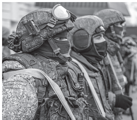
Заставы и сегодня несут службу там, где мирная граница в любой момент может превратиться в линию фронта

время на выдвижение, эвакуацию, занятие обороны. Цена этих часов была огромной – и чаще всего оплачена жизнями пограничников.