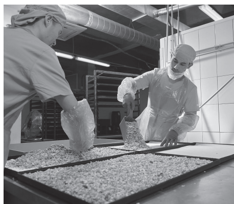
На пищевую промышленность ДНР сегодня приходится уже 10 % всей промышленности региона

условий и существенно повышают урожайность», – отметили представители Минсельхоза.