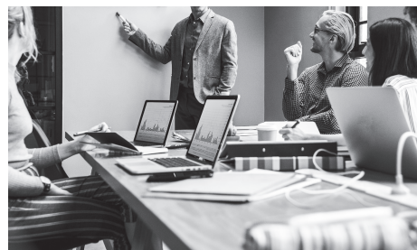
Льготное финансирование помогает предприятиям расширять производство, создавать рабочие места и запускать новые проекты

Для бизнеса сохраняются и налоговые льготы. В республиках действуют пониженные ставки по упрощённой системе налогообложения и налогу на прибыль,