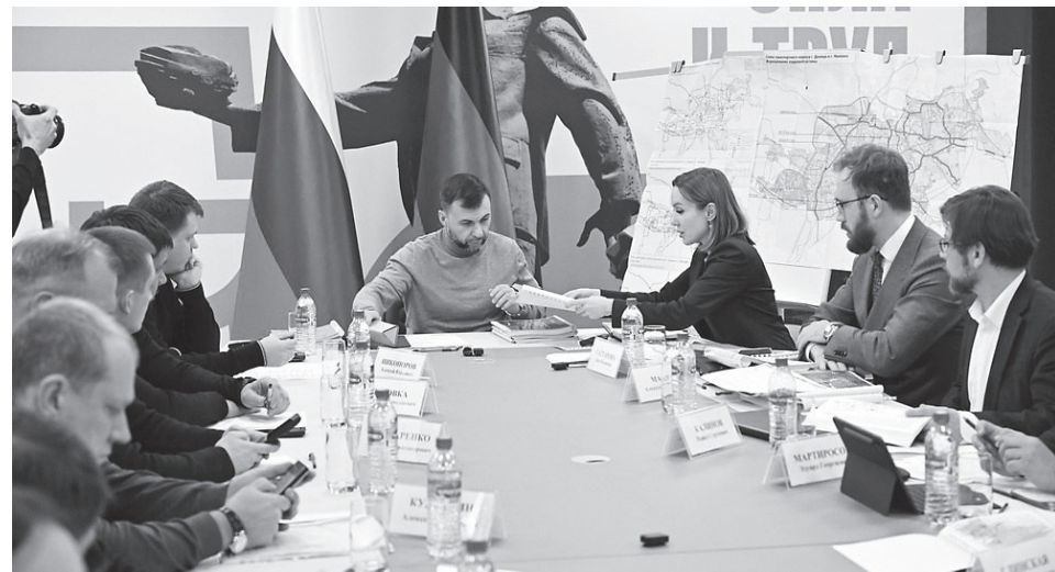
Генпланы – это основа развития муниципалитетов для долгосрочного планирования. Концепцию разработали для 12 округов ДНР

Согласно генпланам, в Артёмовске предлагается восстановить завод шампанских вин и соляные шахты, сделав акцент на переработке сырья, в Курахово – местную теплоэлектростанцию и две дамбы через водохранилище, а также запустить элеватор, хлебозавод и предприятие по производству автокомплекующих. В Великой Новосёлке – отремонтировать четыре