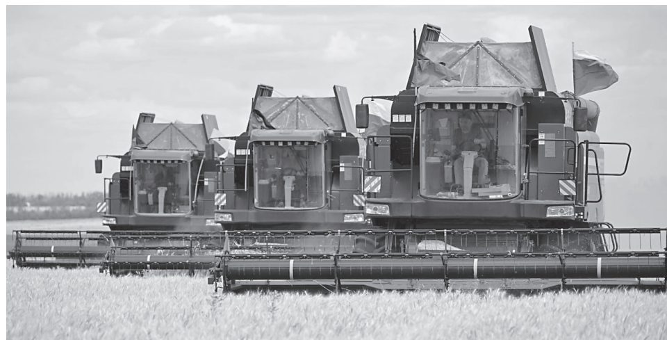
Современный автопарк сельхозтехники растёт – это ускоряет обработку земель и повышает урожайность

«Обязательно всегда готовимся тщательно, формируем определённую концепцию стенда, с этим работает у нас Корпорация развития Донбасса. Важно показать, что ДНР – это не только территория, пережившая тяжёлые события. Это регион, который восстанавливается, развивает экономику и готов предлагать инвесторам конкретные возможности».