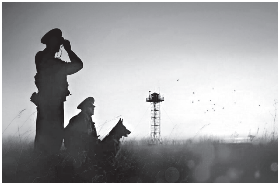
Пограничники первыми встречают врага – так было в 1941-м, на Даманском, в Таджикистане и в Курской области летом 2024 года

Немецкие части нередко были вынуждены задерживаться у небольших застав, которые по расчётам должны были быть сняты сразу. Это имело важное значение. Даже несколько часов сопротивления на приграничном участке давали тыловым подразделениям, штабам, частям Красной армии