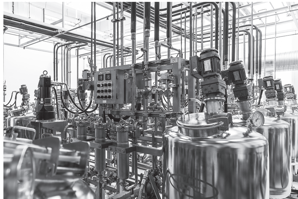
В ДНР планируют восстановить крупнотоннажное производство минеральных удобрений на действующих промышленных площадках

Подать заявку на поддержку можно через портал МСП.РФ, инвестиционный портал ДНР, центры «Мой бизнес», региональные министерства экономического развития, Корпорацию «МСП» и ПСБ.