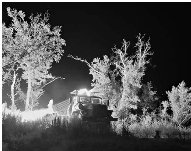
Несмотря на господство беспилотников в небе, ствольная артиллерия остаётся одним из ключевых инструментов поддержки штурмовых подразделений