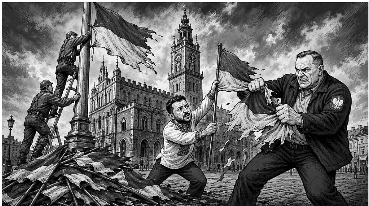
Поезд украинско-польской дружбы сошёл с рельсов исторической памяти: пока Киев чествует героев УПА*, Варшава вспоминает жертв Волыни

С февраля 1943 года формирования украинских националистов начали масштабную кампанию против польского населения Волыни. Наиболее трагическим эпизодом стало 11 июля 1943 года, когда подразделения ОУН-УПА* одновременно атаковали около сотни польских населённых пунктов. По оценкам польской стороны, жертвами этих событий стали около 100 тысяч человек, преимущественно мирные жители – женщины, дети и пожилые люди. В 2016 году польский Сейм официально признал Волынскую резню геноцидом, а 11 июля 2025-го получил статус государственного дня памяти жертв этих событий.