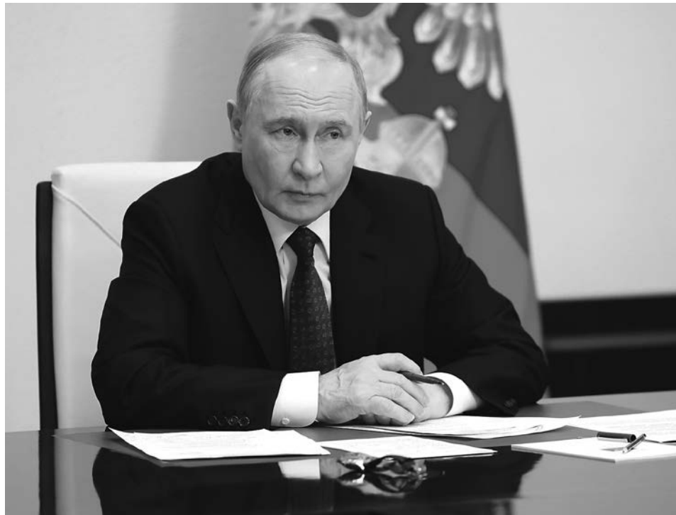
После трагедии в Старобельске Владимир Путин заявил, что преступление против детей не останется без ответа

«Просил бы вас дать свои оценки произошедшему и доложить о том, как идёт работа по выявлению преступников. Все они должны получить заслуженное наказание. И оно будет неотвратимым».