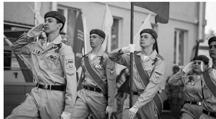
Юнармейцы участвуют в памятных акциях, общественных проектах и мероприятиях по сохранению исторической памяти