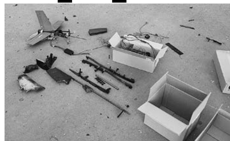
Обломки БПЛА «Хорнет» производства США. Такие дроны враг чаще всего использует для ударов по транспорту в глубоком тылу

трассы практически до самой границы с Крымом. Конечно, ни о какой блокаде речи не идёт. Наша ПВО, мобильные огневые группы, пункты воздушного наблюдения сдерживают практически весь поток БПЛА, который враг направляет по мирным людям. Но изредка им всё же удаётся прорваться.