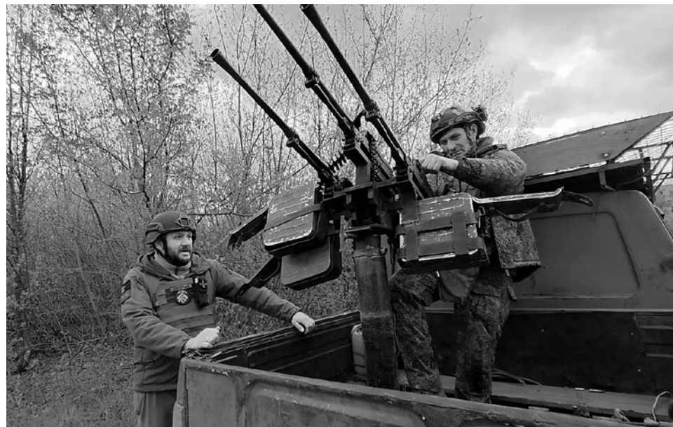
Дорогу патрулируют экипажи мобильных огневых групп, которые сбивают дроны противника из всего доступного им арсенала

Подобная ситуация, как рассказывают местные жители, проявляется на некоторых участках