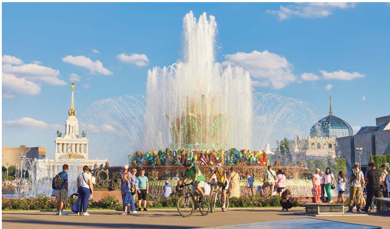
Знаменитый фонтан «Каменный цветок» – один из символов ВДНХ и любимое место прогулок для тысяч посетителей

А ещё непременно загляните в павильон под названием «Макет Москвы». Диво это способно удивить даже бывалого путешественника. На огромном пространстве раскинулась вся столица в миниатюре: улицы, площади, мосты и знаменитые здания исполнены с такою