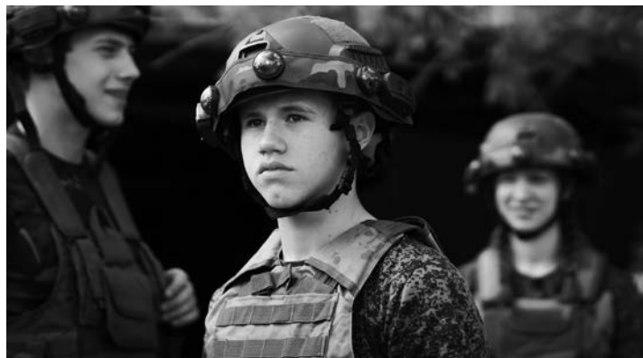
Школьники и студенты из ЛНР регулярно участвуют в федеральных форумах, фестивалях и образовательных проектах

И за эти годы сделано действительно много. Только вду-