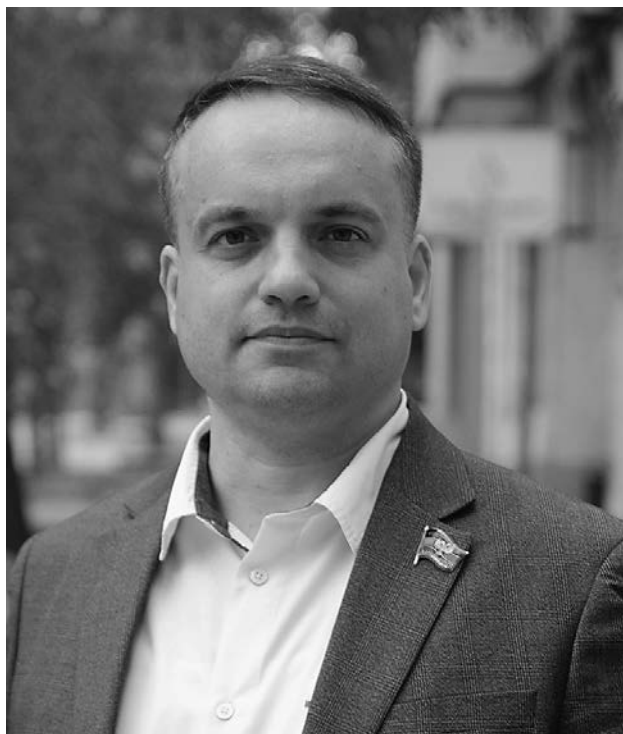
«Позитивная повестка – не просто разоблачать мифы, а показывать общую с Россией историю»

на то, что многолетняя массивированная украинская пропаганда успела внедрить в сознание жителей новых регионов целый пласт политических и исторических мифов. Демонтировать их быстро невозможно – требуется системная государственная политика памяти. И основа для неё уже есть, но ключевой принцип – позитивная повестка: не просто разоблачать украинские фальшивки, а показывать общий с Россией исторический опыт, героев, которые состоялись в рамках российской государственности от Суворова до Судоплатова, от Екатерины II до Маргелова. Памятники, кадетские классы, краеведческие конференции – всё это должно заработать как единый механизм.