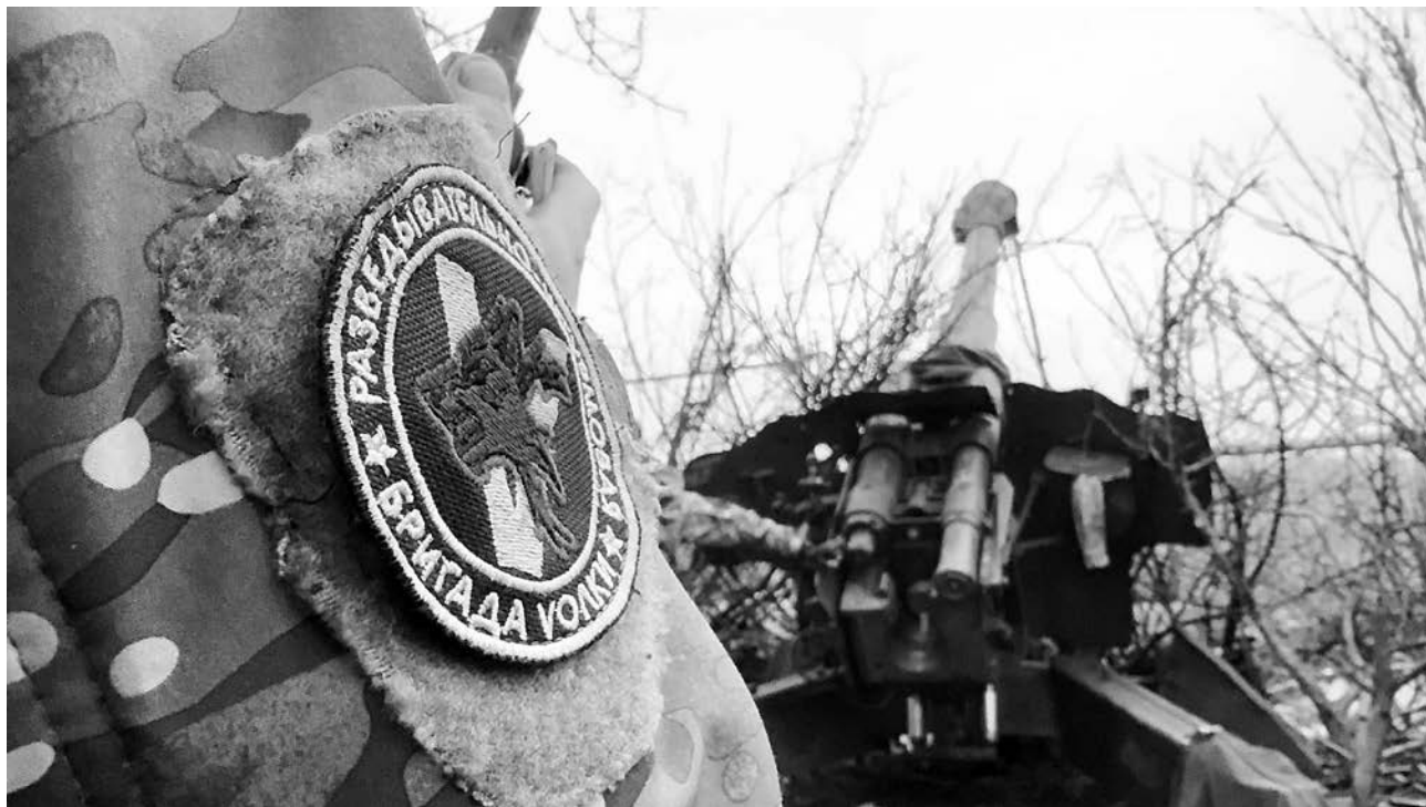
Расчёты бригады «Волки» поддерживают пехоту, уничтожают опорные пункты и работают в тесной связке с операторами БПЛА

Вот это, дорогой читатель, и есть артиллерийское везение, помноженное на холодную голову. Титаны не горят.