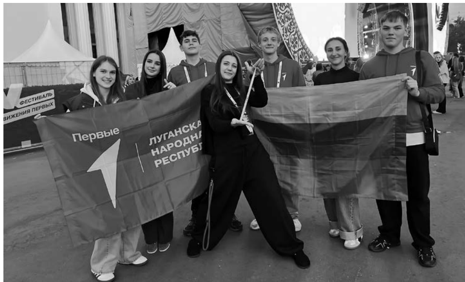
Военно-патриотические клубы и профильные смены помогают подросткам находить новых друзей, получать полезные навыки и чувствовать себя частью большой страны

майтесь: отремонтированы и построены сотни километров дорог, множество зданий. Но самое важное – приведены в порядок детские сады, школы, больницы, парки.