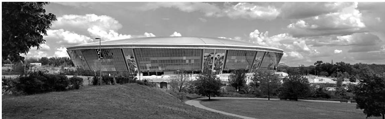
Когда-то трибуны «Донбасс Арены» собирали более 52 тысяч болельщиков. С 2014 года матчи здесь не проводятся